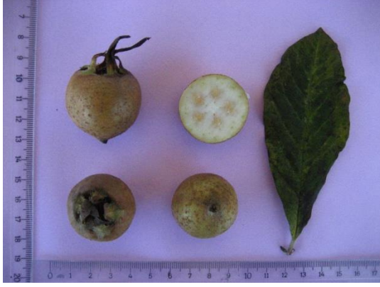
Tip No: 1