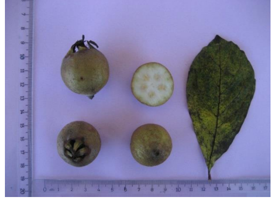
Tip No: 2