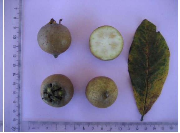
Tip No: 14