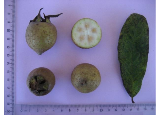
Tip No: 16