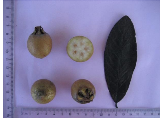
Tip No: 10