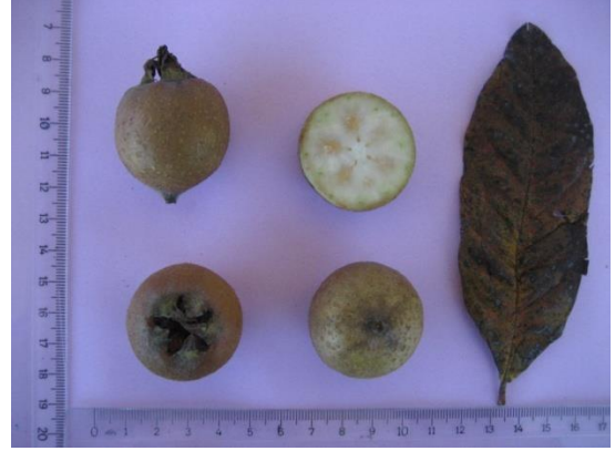
Tip No: 8