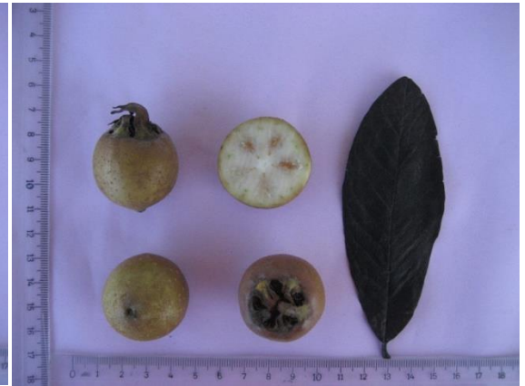
Tip No: 18