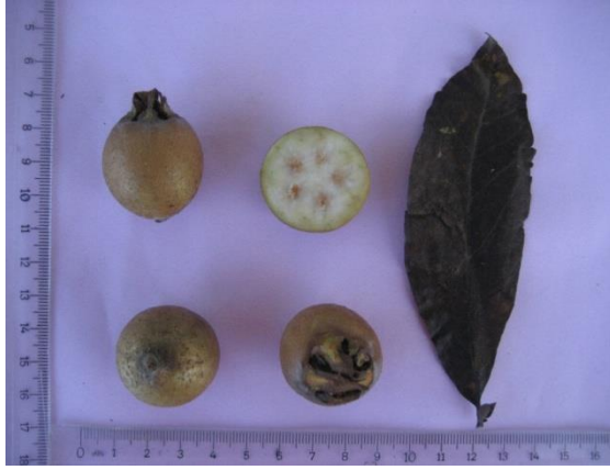
Tip No: 13