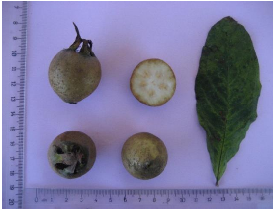
Tip No: 17