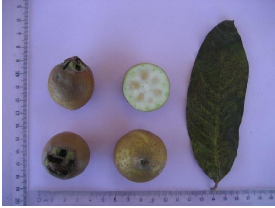
Tip No: 19