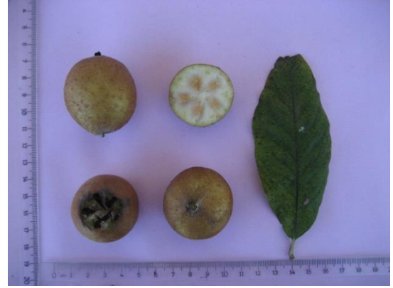
Tip No: 20