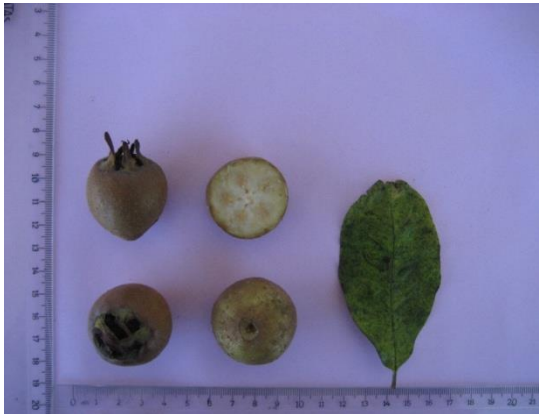
Tip No: 11