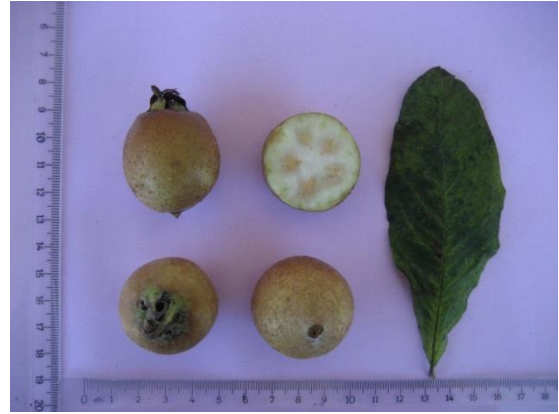
Tip No: 4