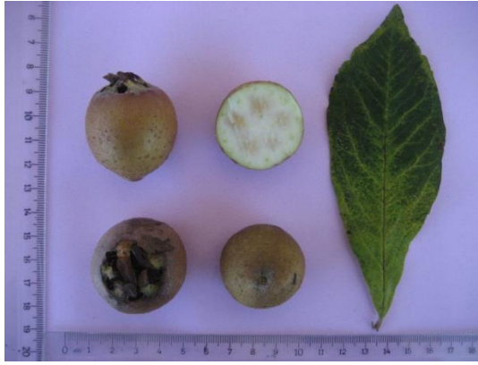
Tip No: 15