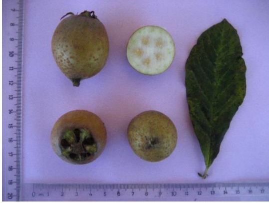
Tip No: 7