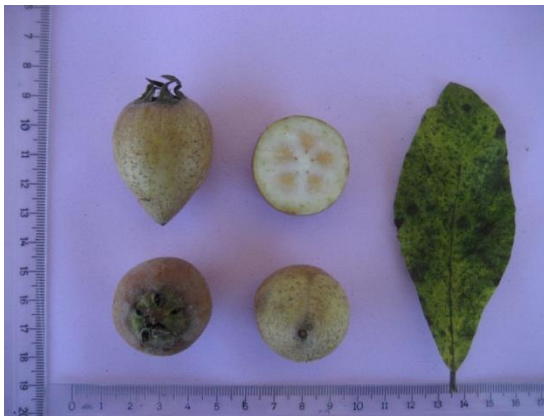
Tip No: 5