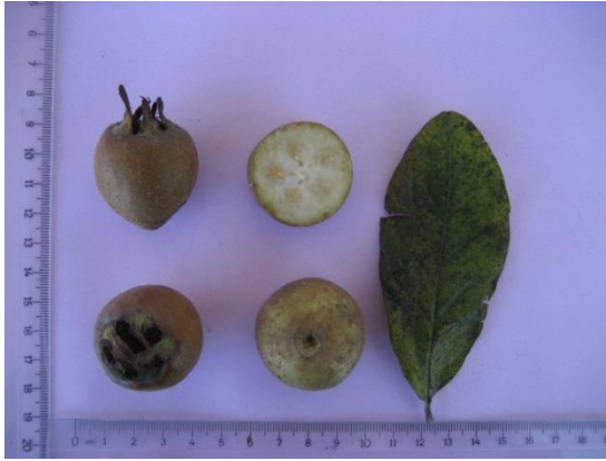
Tip No: 3