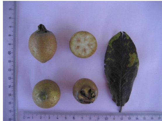
Tip No: 12