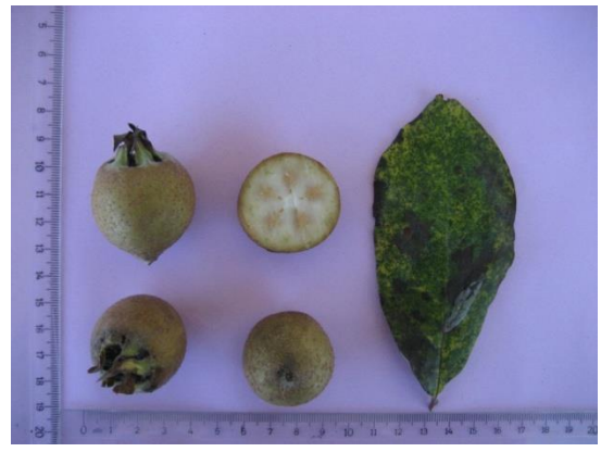
Tip No: 6