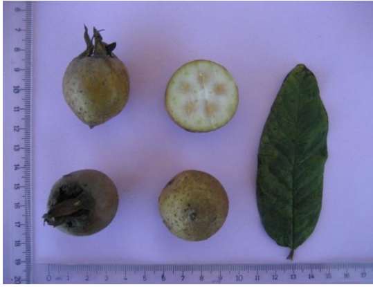
Tip No: 9