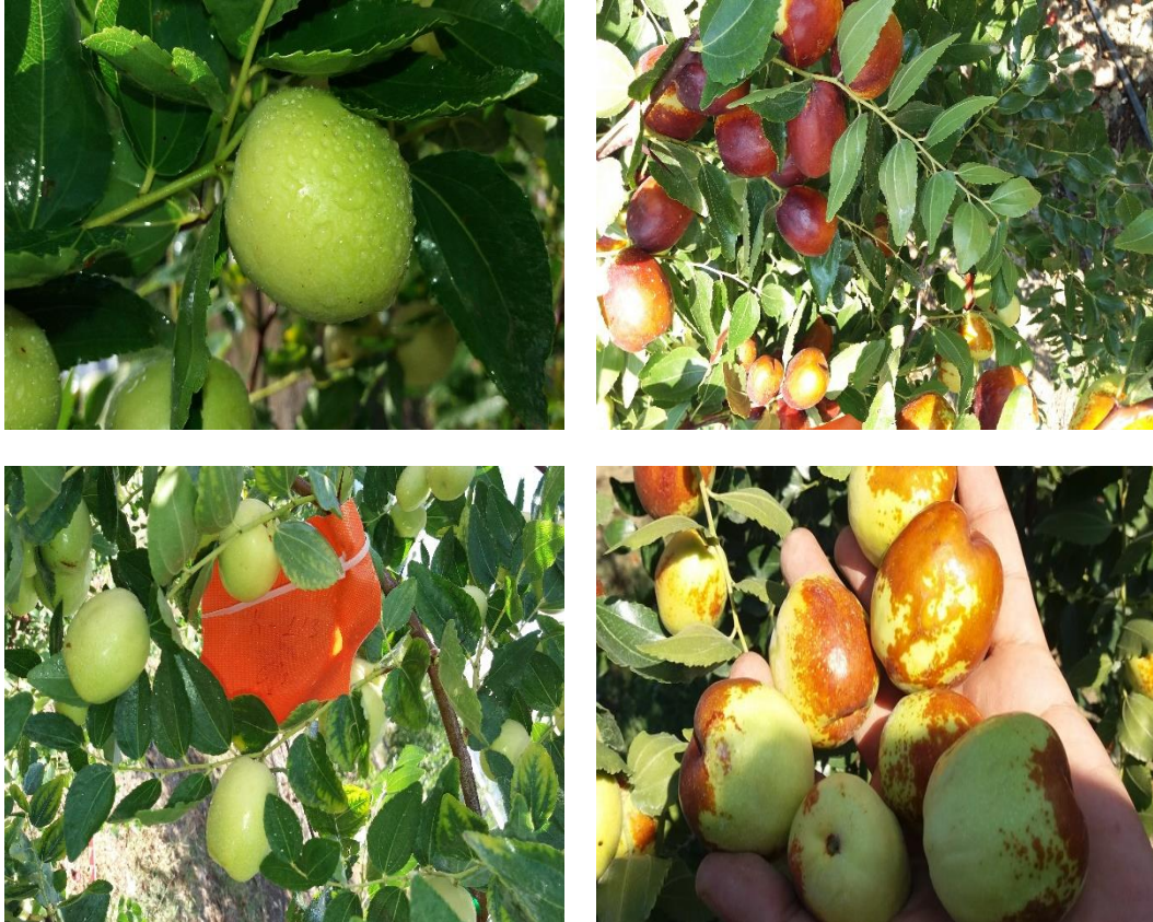
Şekil 3.4 Meyve bahçesinde uygulama yapılan ağaçların ve meyvelerin görünümü