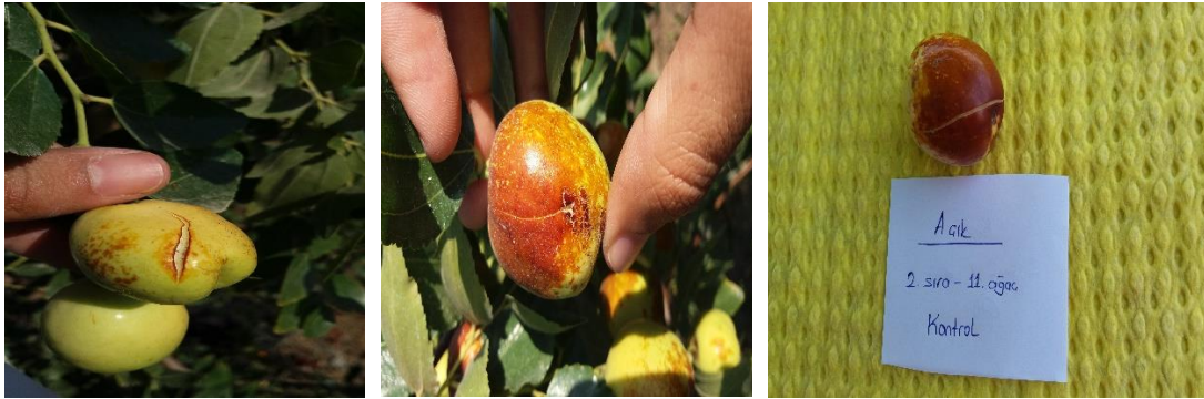
Şekil 3.5 Meyvelerde gerçekleşen çatlamlalar

Aynı zamanda her bir blokta her bir uygulamadan hasat döneminde derilen meyvelerde, suya batırma yöntemine göre çatlama indeksi tespit edilmiştir. Rastgele alınan 40 meyve, 5 L'lik su ( 20 \pm 1 °C) dolu kap içerisinde bekletilmiştir. Meyveler sudan 2 h, 4 h ve 6 h sonra sudan çıkarılmıştır ve çatlayanlar sayılmış, çatlamayanlar derhal tekrar suya batırılmıştır. Bu işlem 3 kez tekrarlanmış ve çatlama indeksi = (5a + 3b + c) \times 100/250 formülüne göre belirlenmiştir. Burada a : 2 h sonra çatlayan meyve, b : 4 h sonra çatlayan meyve ve c : 6 h sonra çatlayan meyve sayısını ifade etmektedir. 5 : 2 saat sonra çatlayan meyve sayısı çarpım faktörü, 3 : 4 saat sonra çatlayan meyve sayısı çarpım faktörü, 1 : 6 saat sonra çatlayan meyve sayısı çarpım faktörünü ifade etmektedir. Toplamda batırılan meyve = 40; 2 saat sonra çatlayan meyve sayısı çarpım faktörü 5 ile çarpımı sonrası, maksimum çatlama= 40 \times 5 = 200 olarak alınmıştır (Bilginer ve ark., 1999; Yıldırım ve Koyuncu, 2010).