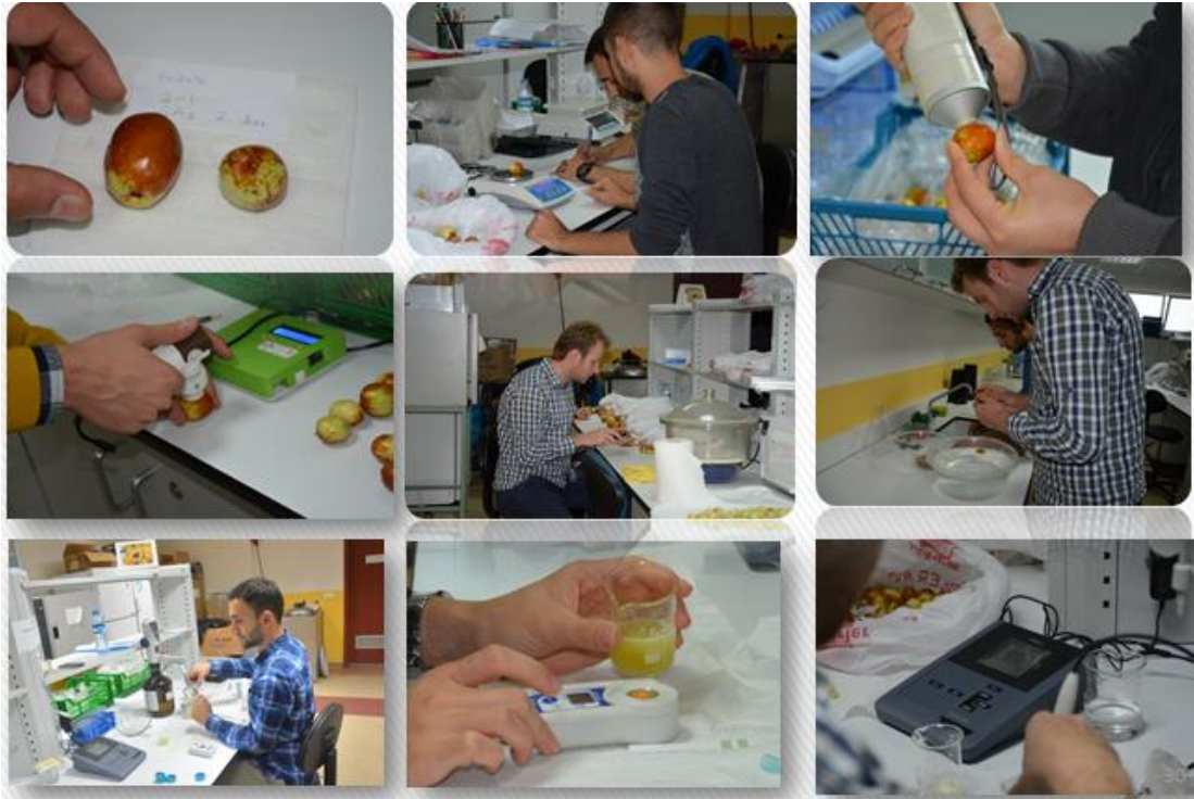
Şekil 3.6 Yürütülen ölçüm ve analizlere ilişkin görünüm

Her bir blokta her bir uygulamaya ait 10 meyvenin meyve eti sertliği dijital sertlik ölçer (Agrosta 100 field, Agrotechnologie, Fransa) ile belirlenmiştir. İlk olarak meyveler düz bir zemine yerleştirilmiştir. Ölçümlerde, meyvede her hangi bir kesim [parçalamadan ölçüm (nondestructive)] yapılmamıştır. Meyvenin ekvatorial kısmının zıt yanaklarına cihazın 10'luk ucu dik olarak temas ettirilmiş, daha sonra dijital ekranda beliren yüzde değer kaydedilmiştir. Dijital sertlik ölçerde değerlerin 0'a yaklaşması meyvenin yumuşadığını, 100'e yaklaşması ise meyvelerin sert olduğunu ifade etmektedir.