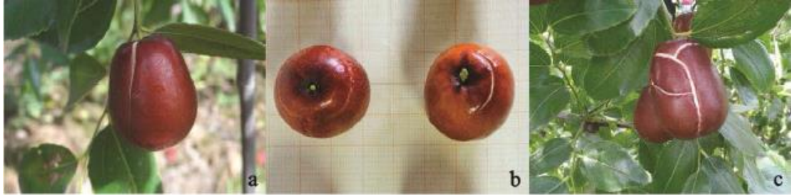
Őekil 1.1 Boyuna atlama (a), yuvarlak ve dairesel atlama (b) ve d zensiz atlama (c)

Meyvelerde hem meyve kabuĐunda hem de meyve etinde meydana gelen atlama, meyve verimini, kalitesini, soĐukta muhafaza ve raf  mr  s resini, son olarakta pazar deĐerini etkileyen, nedeni fizyolojik, morfolojik, evresel ve genetik fakt rlere dayanan fizyolojik bir durumdur. atlama olayı baŐta kiraz olmak  zere elma, Őeftali,  z m, nar, trabzonhurması, erik ve portakal gibi meyve t rlerinde  reticiler iin sorun olarak ortaya ıkmaktadır (Khadivi-Khub ve ark., 2015). atlamanın meydana geldiĐi bir diĐer meyve h nnap ( Ziziphus jujuba Mill.) meyvesidir. H nnap meyvesinde atlama genel olarak meyve kabuĐunda, boyuna, dairesel ve d zensiz Őekilde meydana gelmektedir (Őekil 1.1). atlama sonucunda kabukta yarıлма, meyve etinde bozulma ve asitleŐme meydana gelmektedir.