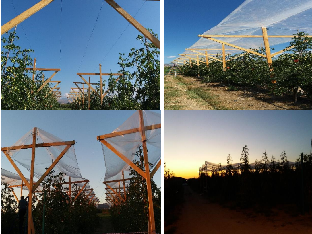
Şekil 3.2 Örtü materyalinin hünnap ağaçlarına uygulanma şekli