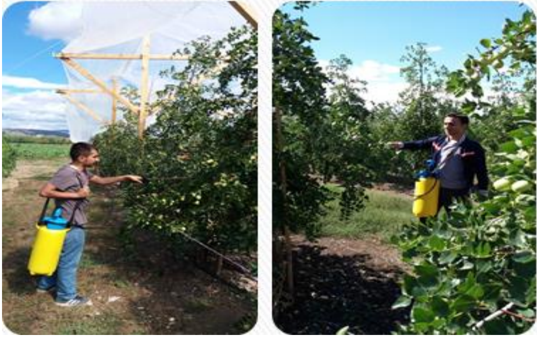
Şekil 3.3 GA3 ve Parka püskürtme uygulamalarına ait görünüm