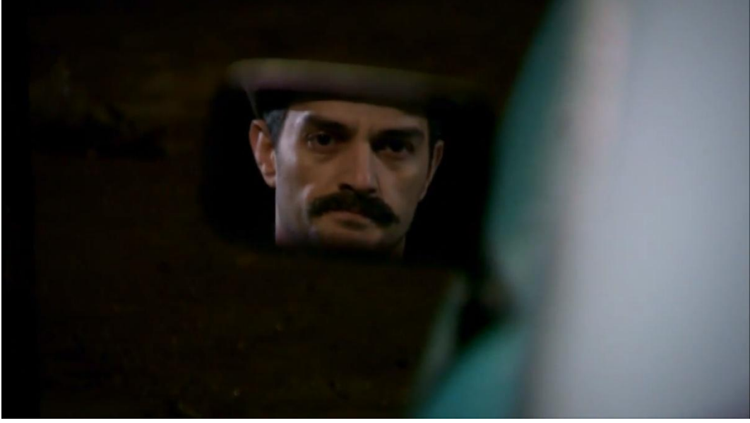
Resim 2 Keşanlı Ali Destanı, 3.Bölüm, 2011

Diğer taraftan dizide dönemsel özelliklere de dikkat edilmiştir. Kullanılan gazete haberlerinin dönemsel gelişmeleri göstermesi, insanların sınıfsal olarak giyim seçimleri, kostüm ve uniformalar, kullanılan aksesuarlar, otomobiller, kurum araçları, iş yeri, hapishane, fabrika tabelaları gibi dış çevreyle ilgili ayrıntılar üzerinde dikkatli bir çalışma söz konusudur.