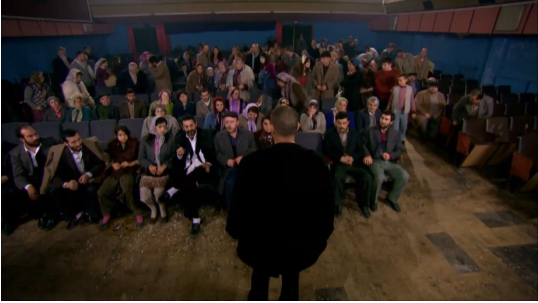
Resim 3 Keşanlı Ali Destanı, 6. Bölüm, 2011

Borçlarından dolayı mahalle kahvesini eline geçiren Sipsi'nin karşısında Ali, mahalle lokalini alarak kahve açacağına müjdesini verir. Fakat bu müjde buradaki çarkı döndürenlerin pek hoşuna gitmemiştir. Sineklidağ'da yeni bir film başlamaktadır. Bu durum son sahnede gösterilen Ali'nin iç sesiyle İstanbul'a karşı yakarışıyla netlik kazanır ve yönetmen bu destanı sürdürmek istediğini Ali'nin nezdinde daha güçlü bir zemine oturtur.