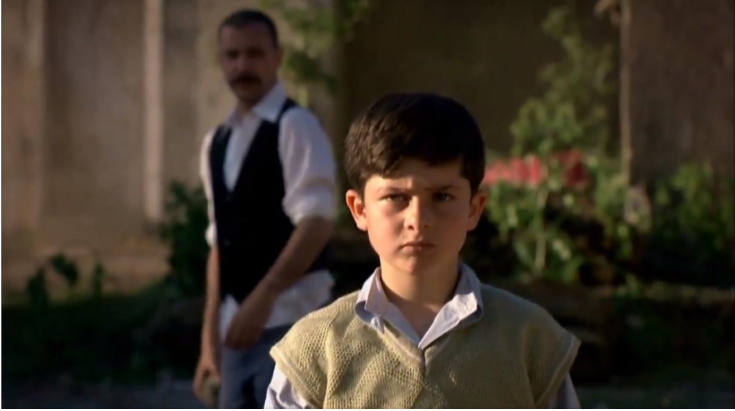
Resim 4 Keşanlı Ali Destanı, 20. Bölüm, 2011

koymuşlardır. Ali ile arasında fizyolojik bir benzerlik kurularak geriye yeni umutların tohumu olarak çocuklar bırakılmıştır.