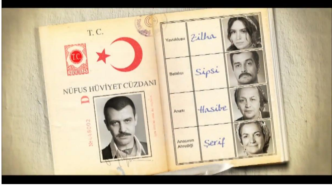
Resim 1 Keşanlı Ali Destanı, Jenerik, 2011

başlamamışken Ali'nin çevresi ve ilişkileriyle ilgili bilgi sahibi olur. Bu da bir çeşit yönlendirir.