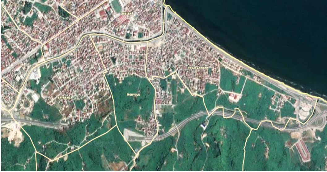
Görsel 1. Alan Çalışmasının Yapıldığı Mahallelerin Haritası

Fevzi Çakmak Caddesi'nde ticari işyerleri yoğun olarak bulunmakla birlikte ara sokak ve caddelerde de seyrek olarak ticari işyerleri bulunmaktadır. Ayrıca Bayramca ve İpek Yolu Mahallelerinde ticari işletmeler bulunmaktadır. Fakat, bu ticari işletmeler, Fevzi Çakmak Caddesi'ndekiler kadar ticari yoğunluk taşımamaktadır. Başka bir anlatımla, tarımsal ürünün pazarlanması, hizmet sektörünün alım ve satımı gibi kapitalist ticari ilişkiler yoğun olarak Fevzi Çakmak Caddesi üzerinde gerçekleşmektedir.