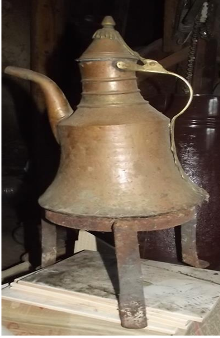
Görsel 26. Sacayağı