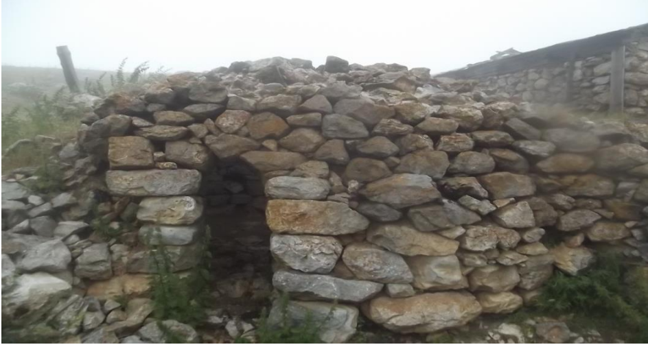
Görsel 23. Arpalı yaylasındaki Rum kelifi