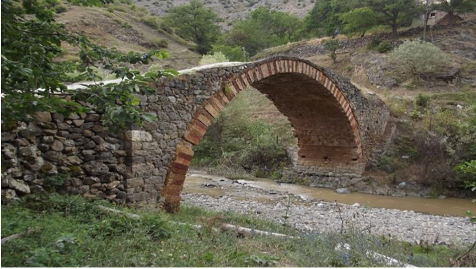
Görsel 14. Emruk mahallesi köprüsü

beşik tonozla örtülü olup çevresi duvarlarla çevrilidir. Köprü tek sivri kemerlidir.” 15 Kemer düzgün yontma taşla örülüdür. Günümüzde kullanmaya devam edilmektedir. Gümüşhane Kültür ve Turizm Müdürlüğü 2012 yılında alınan kararla restore edilecek 43 kemer köprüden biridir.