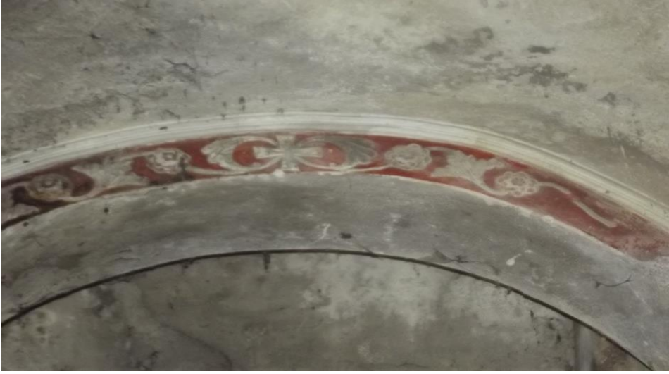
Görsel 15. Emruk mahallesi kilisesi içindeki şekiller

Köylerde her mahallenin birbirine yakınlığı veya uzaklığı dikkate alınmadan kilise inşa edilmesi, Rumların dinî vazifelerine ne kadar önem verdiğini göstermektedir. Demirkapı köyünün eski mahallelerinden biri olan Arpalı Köyü'nde papaz yetiştirme okulunun olduğu ve buradan yetişen papazların her pazar ayin için mahallelere ve diğer köylere gönderildiği bilinmektedir (KK10, 12). Rumların yörede tarım için inşa ettikleri yapıların sağlamlığı yöre halkını şaşkın bırakmakta, teknoloji olmadan bunu yapabilmiş olmaları yöre halkınca hayranlıkla karşılanmaktadır (KK8).