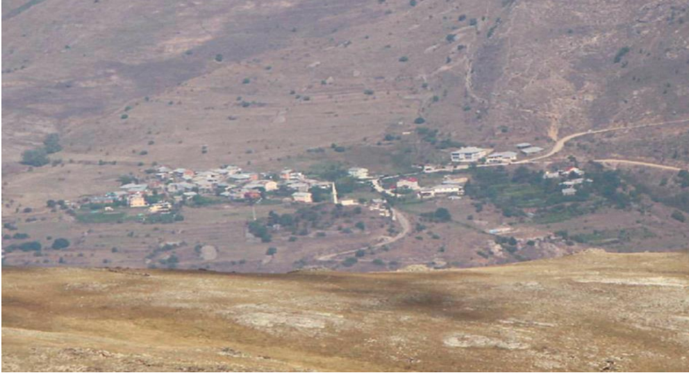
Görsel 6. Güzeloluk köyü

Güzeloluk köyü Torul ilçesine 28 km uzaklıktadır. 2017 tarihli nüfus sayımına göre köyün 27'si erkek 27'si kadın olmak üzere toplam nüfus 54'dür. Bu köyün gerçek nüfusu çeşitli sebeplerle göç etmiş, nüfus ve yerleşim oranı düşmüştür. Bu köyün diğer adı Beşkilise' dir. Bu isim köyde Rumlara ait olan 5 tane kiliseden dolayı verilmiştir. Köyün 1 camisi vardır (Üçüncüoğlu, 1988c, s.209).