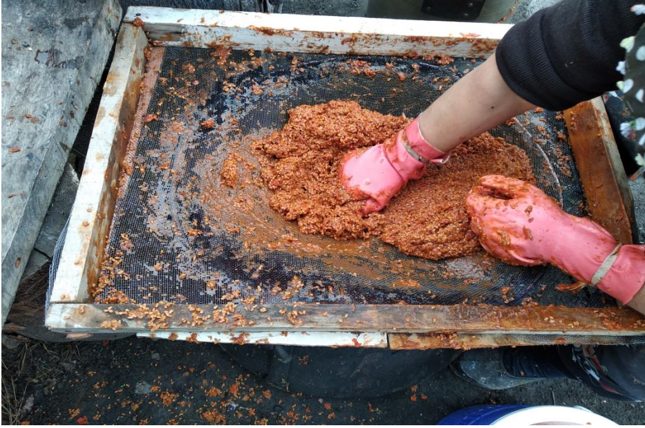
Görsel 34. Kuşburnu çıkarma işlemi