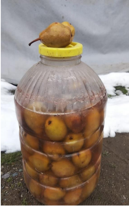
Görsel 32. Armut Sirkesi

Ağaçta tamamen olgunlaşmış küp armutları yaprakları seçilerek yıkanır. Temizlenen armutlar büyük bir bidona yerleştirilir ve üzerine su dökülür. Suyu ağzına kadar dökülünce üzerine bir avuç tuz eklenir ve bidonun ağzı sıkıca kapatılır. Yaklaşık bir ay serin bir yerde asitlenmesi beklenir. Bir ay geçince kontrol edilir asitlenmesi tamamlanmışsa yenilebilir. Bu armudun suyu hem insanlara hem de hastalanan hayvanlara iyi gelir (KK35).