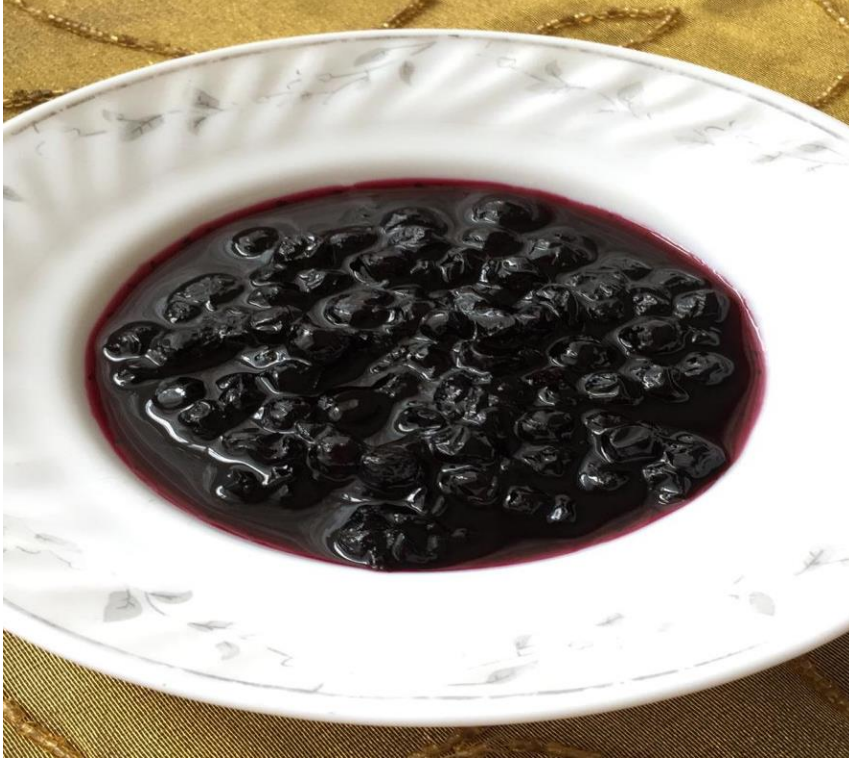
Görsel 35. Dağ Çileği Reçeli

alınır ve kavanozlara koyulur. Rengi siyaha yakındır. Ayrıca bu reçel sulanarak hoşaf olarak da içilebilir (KK35).