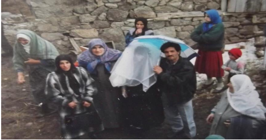
Görsel 17. Gelin alayında çarşaf giydirilmiş gelin

Kız evine giden yengelere kızın kardeşleri tarafından kahve ikram edilir. Yengeler kahve içerken önlerine ayak eni denilen bir bez serilir ve bu bez bir yengenin önüne serildiğinde ondan bahşiş istenir. Yengeler kahvelerini içerken kız kardeşler eğer onları iğneyle oturdukları yere dikebilirlerse kardeş ipliği çözmek için yengeden bahşiş ister. Yengelerden birinin başına doruk sakızı veya zif yapıştırılmaya çalışılır ancak yenge çok dikkatli olmalıdır. Yengenin üzerine çökelek sürülür. Çökeleğin temizlenmesi için yengenin çökeleği sürene bahşiş vermesi gerekir. Bu sırada yengelerden yaşı en küçük olan yenge, kız evinden bir şey çalmalı ve gelin çıkana kadar çaldığı şeyi gizlemelidir. Eğer gizleyemez yakalanırsa yengenin yüzüne çökelek sürülür (KK1, 9, 21, 31).