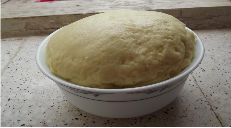
Görsel 28. Deleme

Çiğ süt ekşitildikten sonra ocağa konulup hafif ısıtılır. Isınan süt bir torbaya dökülüp sızdırılır. Sütün artık suyu sızdıktan sonra bir kapta ufalanır ve bekletilir. Ocağa tekrar süt koyulur ve kaynatılır. Kaynayan sütün üzerine ufalanan malzeme dökülür. Malzeme ile kaynayan süt tekrar bir torbaya dökülür ve suyunun çıkması beklenir. Suyu çıkan ve katı hâle gelen malzeme sıcakken bir kaba dökülür. Kaba dökülen malzemeye biraz kaymak, tereyağı ve tuz eklenip hızlıca karıştırılır. Yoğurularak katılaştıran bu karışım küçük kaplara koyularak soğuk yerde bekletilir. Bu peynir yapı olarak kaşar peynirine benzemektedir (KK1, 8).