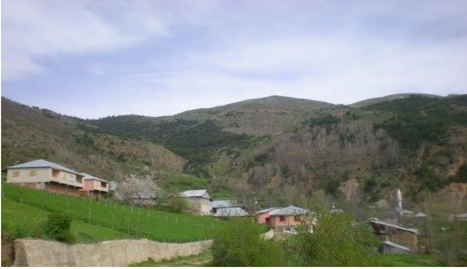
Görsel 7. Almyayla köyü

adı Macara ' dır. Bu köyün gerçek nüfusu çeşitli sebeplerle göç etmiş, nüfus ve yerleşim oranı düşmüştür. Köyün 1 camisi vardır (Üçüncüoğlu, 1988ç, s.235).