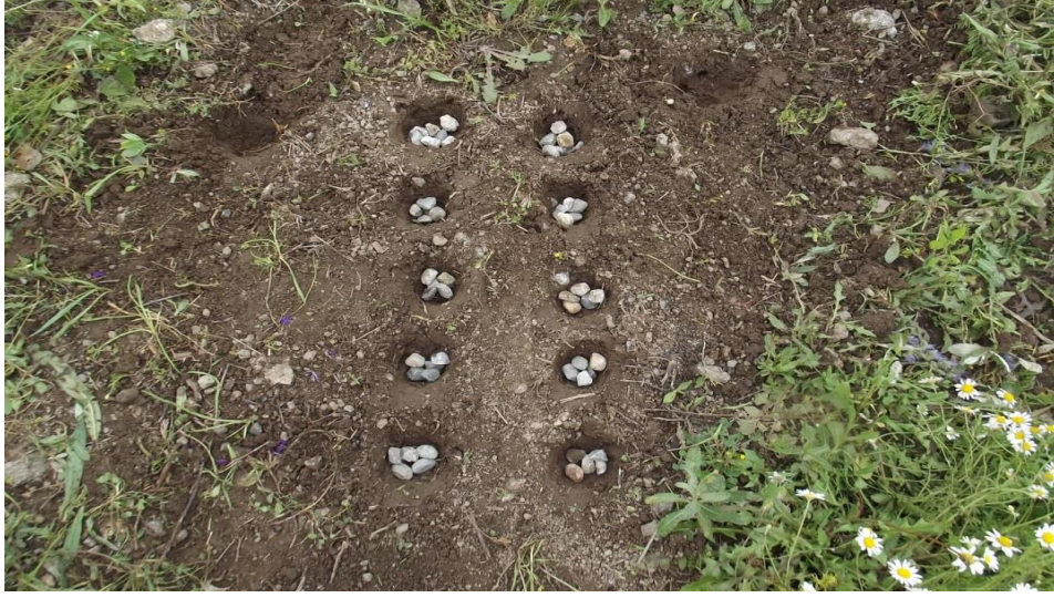
Görsel 22. Pısıll oyunu kümeleri

yapan çocukların vakit geçirmek için oynadığı oyundur (KK2, 18, 19, 23, 32, 24, 13, 14, 35).