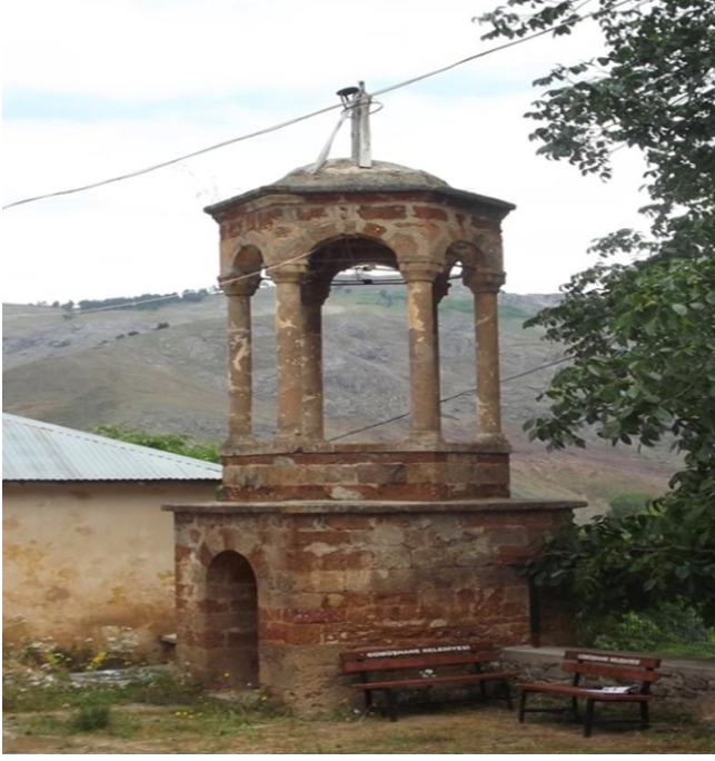
Görsel 11. Arpalı köyü kilisesi çanı

Demirkapı köyü mahalleleri olan Kayadibi, Kurtdüzü, Hıdırellez ve Emrukde bulunan kiliseler 18.yüzyılın ilk yarısına aittir.