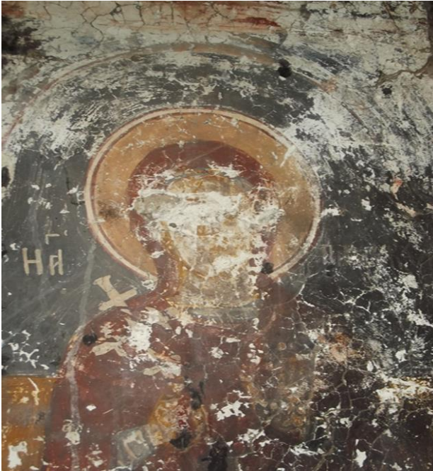
Görsel 13. Kurtdüzü mahallesindeki kilise içi şekilleri

Kurtdüzü mahallesinde bulunan kilise ise özellikle içerisinde bulundurduğu semboller ve resimlerle çok dikkat çekicidir. Kilisenin tüm duvarları düzgün yontma taşla yapılmış, giriş kapısı güney tarafta olup, kapının üzerinde küçük bir ker geçişi vardır. Yapı sağlam durumdadır. Yüksek yerleşim alanlarında yapılan kiliselerde olduğu gibi burada da tabiat şartlarına bağlı olarak çatısı üçgeni geçişle tamamlanmıştır.