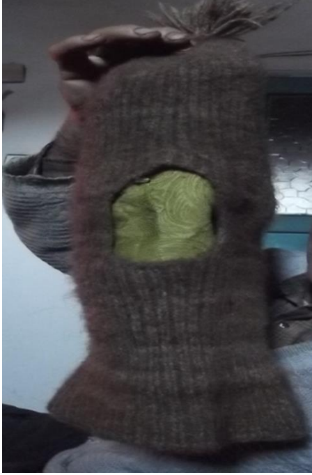
Görsel 25. Tiftikten yapılan bere

Cizere köylerinde dayanıklılığı, iyi boyanması ve rengini uzun süre muhafaza etmesiyle en çok tercih edilen giyimlerden biridir. Keçiler kırıldıktan sonra tüyler iyice yıkanır. Yıkanan sert kıllar yün tarağından geçirilir ve altında kalan yumuşak ve ince tüyler kirmen ve terşide ip hâlini alır. İp olan keçi yününden çorap, bere ve atkı yapılır. Genelde kış aylarında ava çıkan köylüler tarafından kullanılır (KK12).