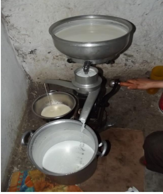
Görsel 27. Süt makinesi ile yağı ayrılan süt