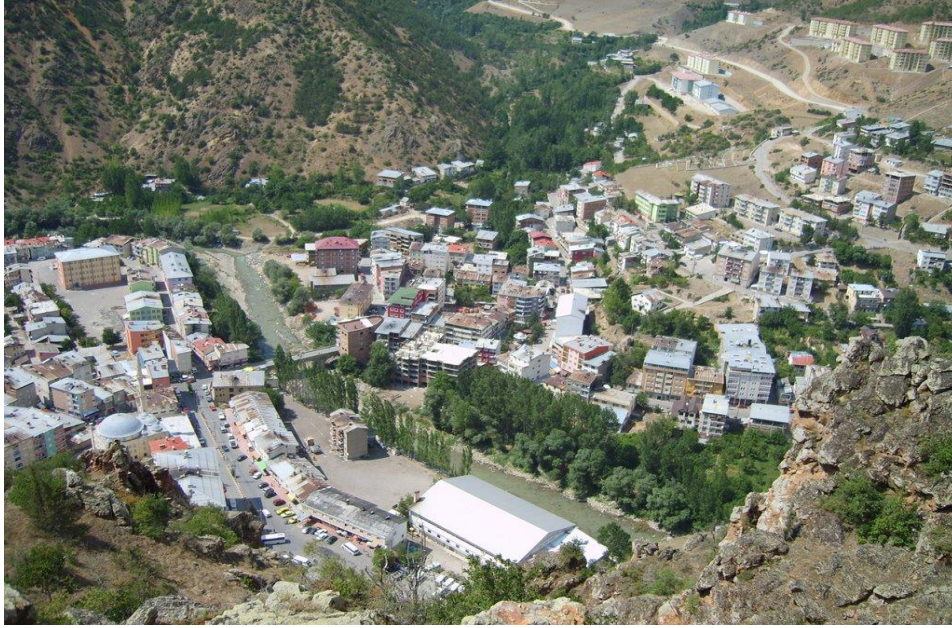
Görsel 2. Torul ilçesi

Torul ilçesi turizm bakımından oldukça zengindir. Karaca Mağarası, Zigana Dağı, Limni Gölü, Yedi göller, Tarihi İpekyolu Köprüsü bunlardan bazılarıdır. 2018 yılında açılan Cam Seyir Terası ise turistlerin ilgisini çekmektedir.