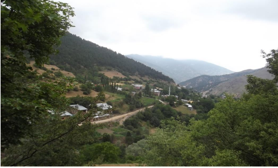
Görsel 5. Arpalı köyü