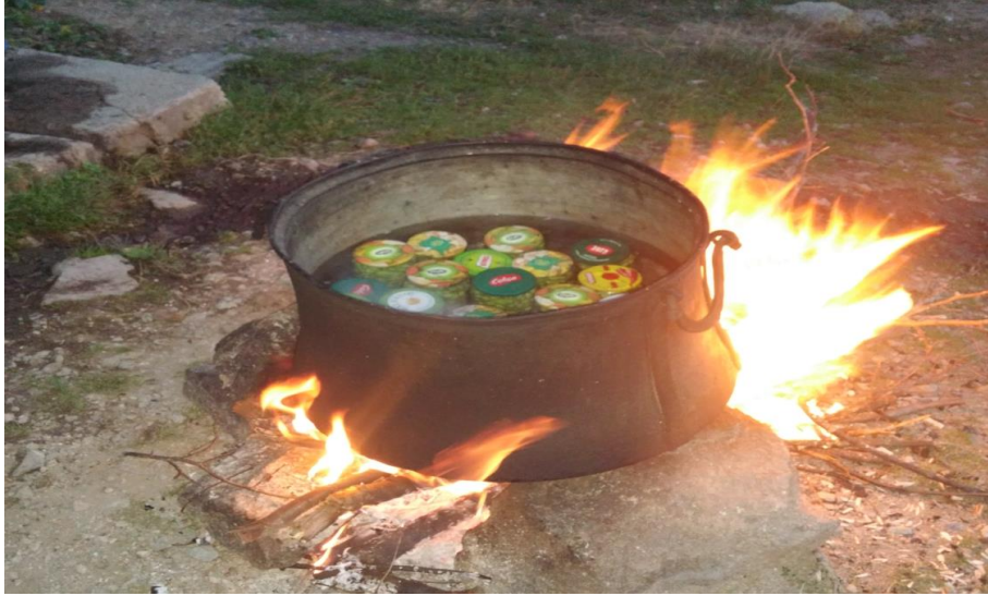
Görsel 30. Konserve şişelerinin pişirilmesi

Taze fasulyeler kırılır ve temizlenir. Yumuşayıncaya kadar kaynatılır, tuzu eklenerek kavanozlara koyulur. Kavanozlara koyulan fasulyeler bir kazana yerleştirilir ve bir saat pişirilir. Kışın kullanılmak üzere soğuk bir odada saklanır (KK21, 22, 26, 23, 31).