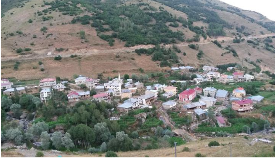
Görsel 9. Kopuz köyü

Kopuz köyü Torul ilçesine 31 km uzaklıktadır. 2017 tarihli nüfus sayımına göre köyün 11'i erkek 17'si kadın olmak üzere toplam nüfus 28'dir. Bu köyün gerçek nüfusu çeşitli sebeplerle göç etmiş, nüfus ve yerleşim oranı düşmüştür. Köyün 1 camisi bulunmaktadır (Üçüncüoğlu, 1988e, s.263).