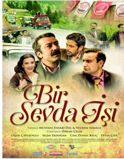
Resim 34. Bir Sevda İşi Filmi'nin Afışı

TRT TV Filmleri kapsamında 2016'da çekilen Bir Sevda İşi filmi, dram-komedi ağırlıklı olup 95 dakika sürmektedir.