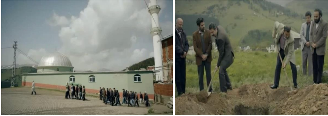
Resim 47. Bir Sevda İşi, Cenaze Kaldırma ve Toprağa Verme