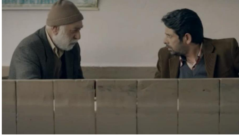
Resim 42. Bir Seveda İşi, Köydeki Erkeklerin Giyimi

Filmde geçen kostümlere bakıldığında; erkekler gömlek, süveter, yelek ve üstlerine ceket giymektedirler. Bazı köy büyüklerinin kafasına da takke taktığı görülür. Kadınlar ise başörtü olarak yazma, basma etek ve üstlerine şal almıştır. Türk kültüründeki köy giyimini yansıtmaları bakımından filmde tutarlı kostümler seçilmiştir.