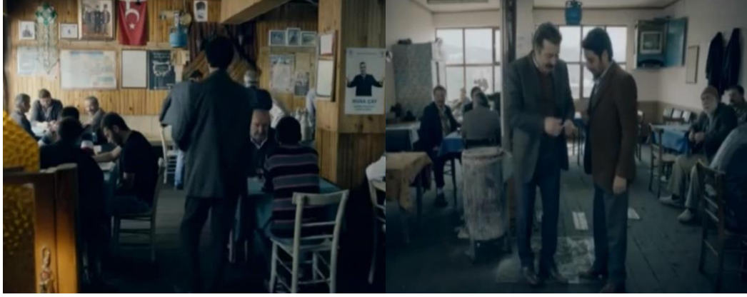
Resim 40. Bir Seveda İŖi, Kahvehanede Kullanılan Dekor