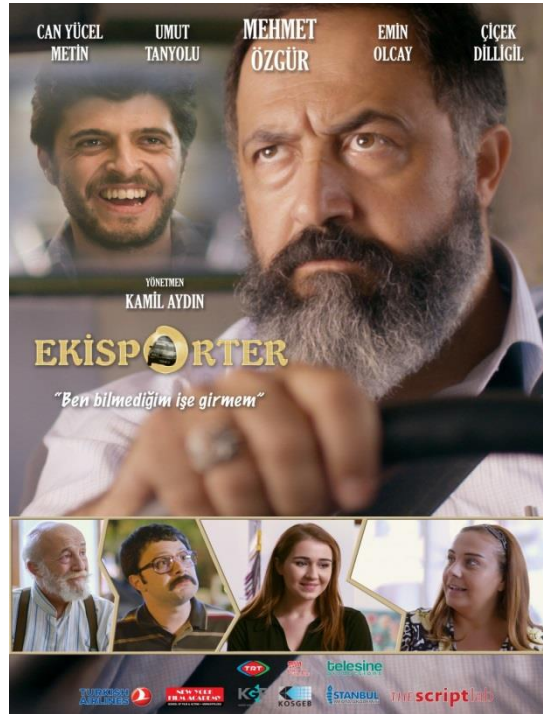
Resim 18. Ekisporter Filmi'nin Afışı

TRT TV Filmleri kapsamında 2016'da çekilen Ekisporter filmi, dram-komedi ağırlıklı olup 90 dakika sürmektedir.