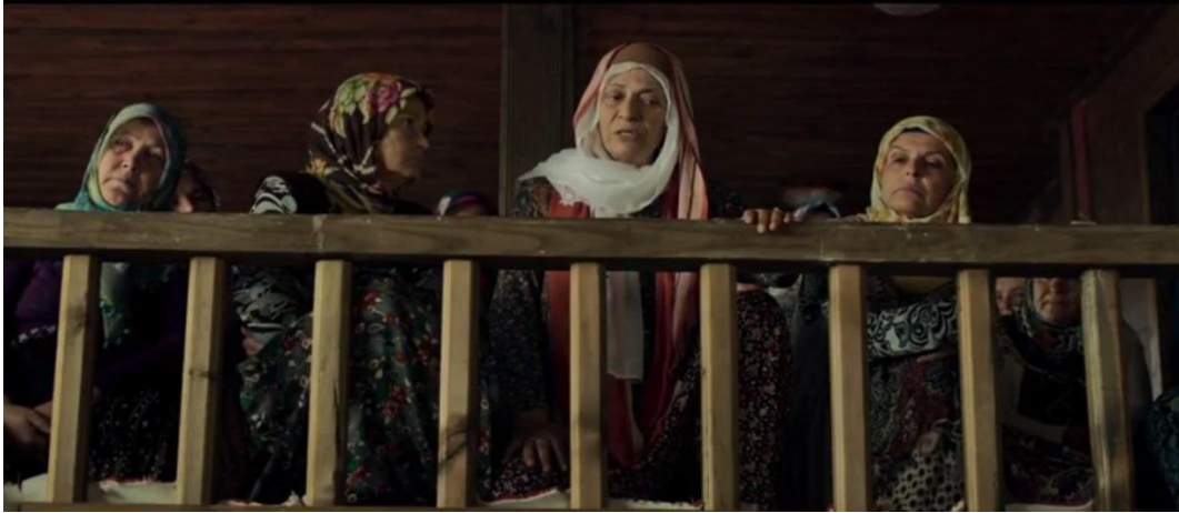
Resim 13. Son Kuşlar, Köy Kadınlarının Giyimi

Filmde, kişinin sosyal statüsü giyim kuşamından rahatlıkla görülebilir. Giyim tarihçesi ile ilişkili bilgilere, Orta Asya'daki kazılardan, çini seramiklerinden, minyatürler, heykeller, madeni eşyalardan, Divanü Lügatit Türk'ten, seyahatnamelerden ve müzelere kadar süregelen giyim ve kuşam örneklerinden öğrenilmektedir (Bulmuş ve Bedük, 2013, s.22). Giyim faktörünün oluşmasında kültür kadar, iklim ve dinsel öğelerinde önemi büyüktür (Salman ve Atmaca, 2009, s.11) Köylülerin kıyafetleri film süresince kültürel bir gösterge olarak kullanılmıştır. Bazı köy büyüklerinin başında takke bulunur. Geleneksel giyim kültüründe kadın hiçbir zaman başı açık dolanmaz (Çelik, 2015, s.9). Kadınların başında ise yazma denilen oyalı başörtüsü ya da Ayşe halanın kullandığı gibi fes vardır. Geleneğe bağlı giyimlerin devam ettiği köylerde yaşça büyük kadınlar başlarına fes takarlar (Kaya, 2008). XII. Yüzyıla değin kadınlar arasında basık sarık ve sivri külâh tarzı başlıkların çoğunlukta olduğu bilinmektedir. Selçuklu devrinde, kadın başlıkları içerisinde fes benzeri başlıkların takıldığı bilinmektedir (Çelik, 2015, s.10). Filmde kıyafet olarak da basma etek, entari denilen elbise, yelek ve çarık giymektedirler. Kara lastik köy ve kasabalarda dar gelimli kesimin tercih ettiği bir ayakkabı türüdür. Kollarında da bilezik bulunur.