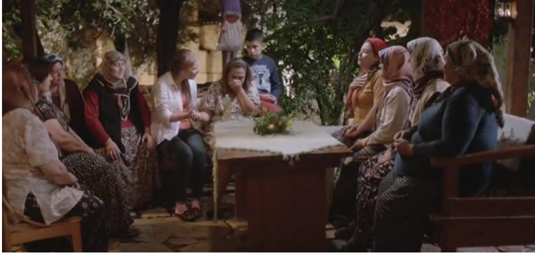
Resim 28. Ekisporter, Komşuların Kıyafetleri