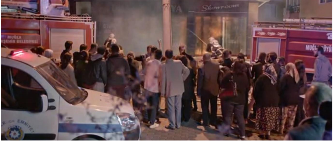
Resim 21. Ekisporter, Dükkanın Yandığı Sahne

sopayla döver. Tayyar, gece içmiştir ve gider Turan Usta'nın dükkanını ateşe verir. Bunu duyan Turan Usta, dayanamaz ve kalp krizi geçirerek hastaneye kaldırılır.