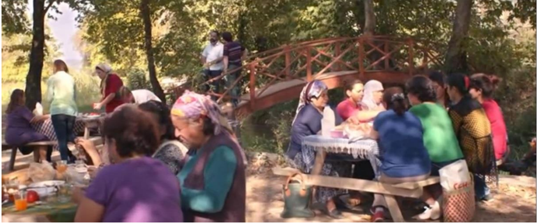
Resim 24. Ekisporter, Pikniğe Geldikleri Sahne

Turan Usta işlerden bunalmıştır ve ailesiyle birlikte Zati'yi de alarak pikniğe gider. Türk kültüründe piknik sevgisinin yeri başkadır. Pikniğe giderken sepet hazırlamak, Türklerin keyif aldığı bir davranıştır. Piknikte, aile ya da eş dost toplanıp, yiyecek alarak açık bir alanda yer, içer, oyunlar oynar, gezer ve eğlenir. Böylece iş yoğunluğunun da stresi atılmış olur.