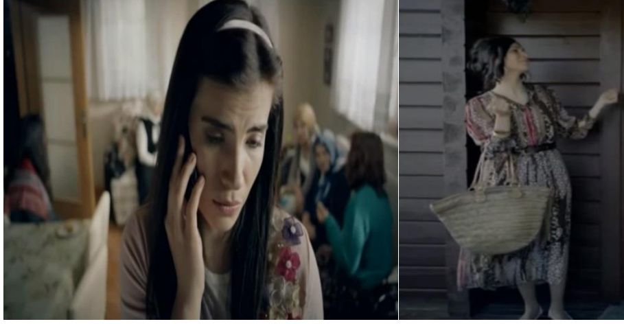
Resim 43. Bir Sevda İşi, Başkan Adaylarının Eşlerinin Giyimi

Başkan adaylarının da sürekli takım elbise giydiği görülmektedir. Statüleri köy halkından daha farklı olması nedeniyle seçime kadar kıyafetlerine özen göstermiş hatta terziye özel dikim sipariş vermişlerdir. Filmde de Mülayim, Yasin'e "yarın terziye gidicez unutma", der. Yasin de "ya terziye ne gerek var hazır giyeriz", diye cevap verir. Mülayim ise "ya başkan hazır elbise mi giyer nerde görülmüş" diyalogundan, kıyafetlerine özenli davranmaları gerektiği anlaşılmaktadır.