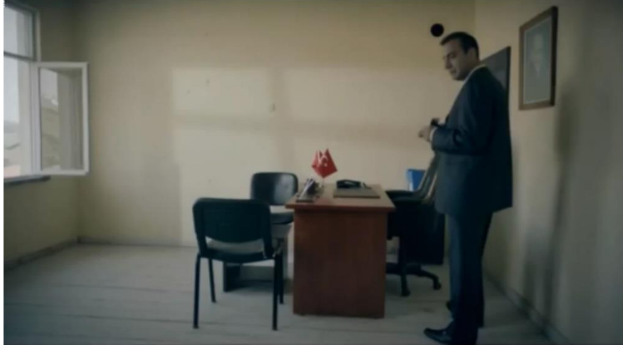
Resim 38. Bir Sevda İşi, Musa'nın Makamına Geldiği Sahne