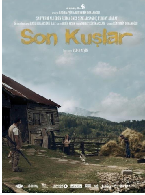
Resim 7. Son Kuşlar Filmi'nin Afişi