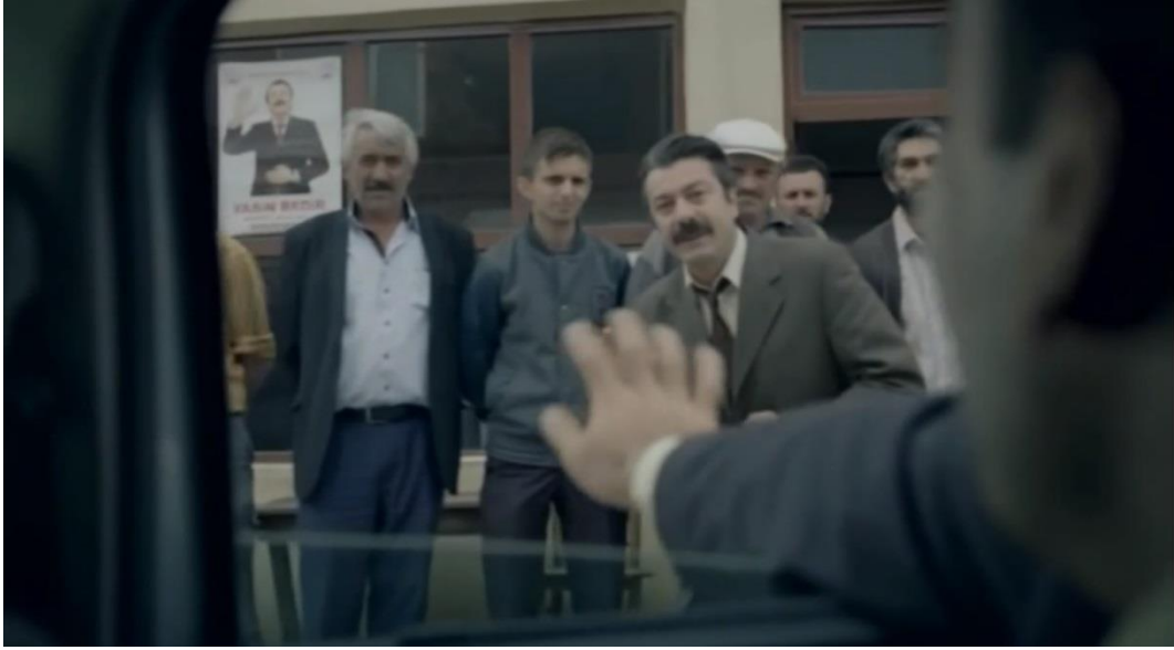
Resim 39. Bir Sevda İşi, Milletvekilinin Meydanda Köy Halkını Selamlaması

faaliyetin de yürütüldüğü yerlerdir. İnsanların, eskiden dış tehditlere karşı kendilerini korumak ve ortak bir alanda toplanarak kontrolü sağlamaları sebebiyle meydanlar ortaya çıkmıştır. Köy meydanı da filmde kamusal bir alan olarak yansıtılmıştır. Son mekân olarak; Kümbet Belediye binasında Musa'nın makam koltuğuna oturduğu sahne görülmektedir. Köyde makam odası gösterişsiz yani daha sade yansıtılmıştır.