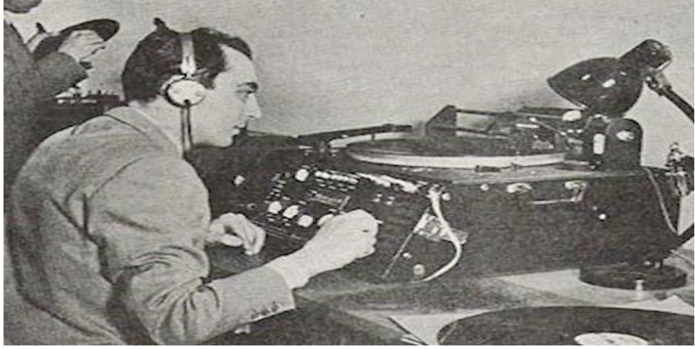
Resim 4. TRT'nin İlk Radyo Anonsu, (TRT Haber, 2018)

"Alo Alo Muhterem Samiin (dinleyiciler), Burası İstanbul Telsiz Telefonu... 1200 metre tulu mevç (dalga boyu), 250 kilosıkl. Şimdi akşam neşriyatımıza başlıyoruz. (Şefik, 1927: ilk radyo anonsu)" 6 Mayıs 1927'de Sirkeci Büyük Postane'sinin bodrum katında 5 kilovat vericiyle yapılan ilk radyo yayını, Eşref Şefik'in yaptığı bu anonsla başlamıştır (Açıklın, 2018, s.10).