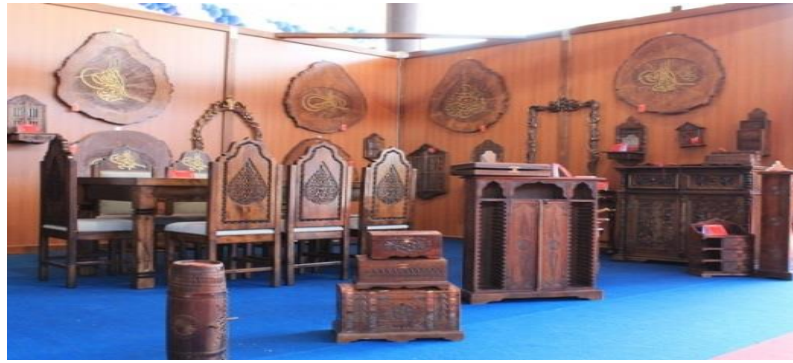
Resim 3. Kastamonu Ahşap Oymacılığı