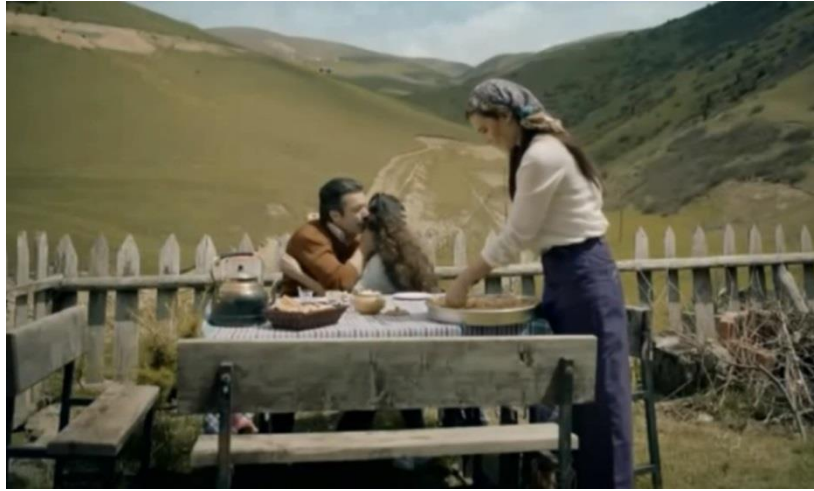
Resim 46. Bir Sevda İşi, Ailenin Sofraya Oturduğu Sahne

Seçim zamanında iki adayda konvoy oluşturmuştur. Toplu bir biçimde hareket etmek ve bir arada bulunmak başkan adaylarının kendilerini daha güçlü hissetmelerini sağlamıştır. Türklerde, kutlama, düğün, seçim gibi zamanlar olduğunda peş peşe arabalar dizilerek korna çalıp tur atılır. Göçebe toplumlardan itibaren insanlar sürekli bir arada yaşamış ve birbirlerine destek olmuşlardır. Bu da günümüze kadar Türk kültüründe alışılmış bir ritüel olmuştur. Filmde geçen diğer bir sahnede ailenin birlikte sofrada oturup yemek yemesidir. Yasin'in eşi, eve kocası gelmeden yemeğe oturmaz. Burada da kadının ailedeki görevi belirtilmiş, evde yemek yapıp çocuğuna bakan bir profil çizilmiştir. Filmde, hep birlikte muhabbet ederek yemek yemeleri, ailenin birlik beraberliği güçlendirici yönünü vurgulamıştır.