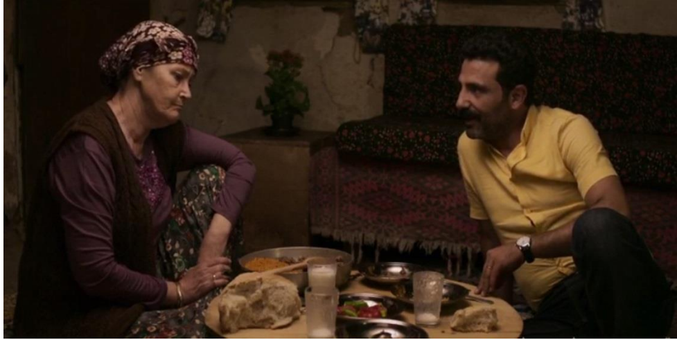
Resim 11. Son Kuşlar, Yer Sofrası

Bekir, annesiyle yer sofrasında yemek yediğinde ise ortaya konulan sinide eski taslar ve alüminyum tencere bulunmaktadır. Yine yer sofrası ve ortadan yeme alışkanlığı da Türk gelenekleri içerisinde yer almaktadır. Köy evlerinde eşyaların sadeliği, taşınabilir olması aynı zamanda çok yönlü kullanılması gerekmektedir. Portatif yer sofrası ve minderler bu durumun sonucunda ortaya çıkmıştır. Zemine çok yakın mesafede bulunan sofranın düzeni ve yer minderleri o dönemin çalışma modeline yakın olan oturma şeklini aldığı için kullanışlıdır. Halk tarlada çalışır, ürününü yerde sürekli işler. İş bittiğinde ise eve gelir ve yorgundur. Ancak bu kişilerin çalışma biçimine yakın yerde uzanarak oturmaları, onların dinlenmesinde yardımcı olur ve rahatlatır. Yemek yerken de minderleri alır ve alçak yerdeki sofranın etrafına oturur (Göker, 2009, s.166-167).