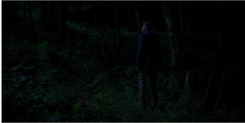
Resim 10. Son Kuşlar, "İşte Sizin Çocuklarınıza Karşı Benim Çocuğum" Babasının Kuşlara Karşı Seslendiği Sahne

Gece olur ve köy halkı, Bekir'in evine gelir. Bekir'e, "her şeyimiz ters yüz oldu ne zamandır, buralı değilsin gideceksin, artık acısını bizden çıkaracaklar" diye söylenmeye başlarlar. Bekir de bağınıza bahçenize sahip çıkamıyorsunuz, çocuğunuzu evlendireceğinize kavga ediyorsunuz, sonrada kapıma gelip benden hesap mı soruyorsunuz, defolun gidin kapımdan" diyerek çıkışır köy halkına. O esnada Ayşe hala Bekir'in babasına, "haydi erkekler kalkıp gereğini yapsın" diyerek Bekir'i cezalandırmanın vakti geldiğini söyler. Bekir, İstanbul'a gitmek için yola çıkmıştır ve köy halkı yolda Bekir'i durdurur. Babası, Bekir'in elini bağlayarak ormana götürür. Bekir'e dönüp; "sana söyledim, anlattım, beni dinlemedin, başımı öne eğdirdin" der. Bekir'i gece ormanda eli kolu bağlı bırakır ve ormandaki kuşlara dönüp: " işte sizin çocuklarınıza karşı benim çocuğum" diyerek ormandan ayrılır. Film, Bekir'in "baba yapma ne olur, baba" inlemeleriyle biter.