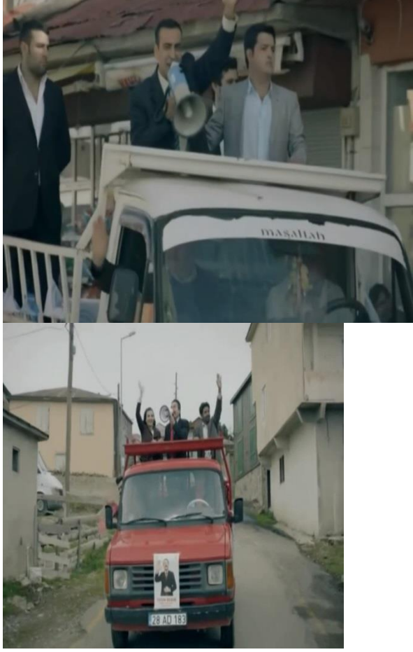
Resim 41. Bir Seveda İşi, Megafonla Seçim Aracında Gezdikleri Sahne

Köy meydanında yapılan düğünde, uzun masalar kurulmuştur. Ampuller asılmış ve balonlarla meydan süslenmiştir. Diğer bir taraftan da davul zurna çalmaya başlamıştır. Türk kültüründe davul zurna ile düğün yapmak gelenek ve görenek içerisinde yer alır. Türk coğrafyasında davul zurna, simgesel değerler taşır. Örneğin; Orta Asya Türklerin’de bazı mezarların içerisinde davul bulunduğu bilinmektedir. Ayrıca yine davul zurna musikisiyle birlikte hastaları tedavi ettikleri için özel bir değer atfedilmiştir. Davul, aynı zamanda Türk devletlerinde bir sembol haline de gelmiş ve güçlü bir yapıyı da vurgulamıştır. Filmin son sahnesinde Musa’nın odasında yansıtılan dekorlar ise duvara asılı Atatürk portresi, koltuk, masa ve üzerinde de Türk bayrağı, telefon, kalemlik bulunmaktadır. Türkiye Cumhuriyeti’nin kurucusu Mustafa Kemal Atatürk’ün portresi her kamu kurumunda bulunmaktadır. Ayrıca Türk bayrağı da Türk milletinin simgesini oluşturması bakımından, bu iki değerli unsurun sade bir biçimde dekore edilen belediye başkanı odasında kullanıldığı görülmüştür.