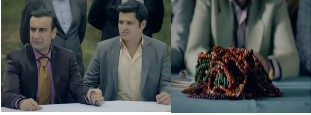
Resim 48. Bir Sevda İş'i, Tespih Çekme ve Tespihle Oy Sayma Sahnesi