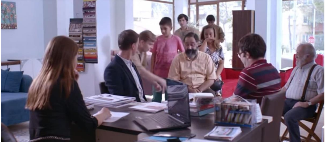
Resim 22. Ekisporter, Dükkanı Kızına Bıraktığı Sahne

Dükkanın yangından doğan tüm zararı, sigorta tarafından karşılanır. Böylece, yeniden dükkâna mal getirilir ve Turan Usta'nın kızı dükkânın başına geçer. Bu sırada yabancı bir müşteri gelir. Kızı, sipariş vermek isteyen müşteriyle konuşurken hastaneden çıkan Turan Usta da o esnada dükkâna gelir ve koltuğunu kızına bırakarak atölyesine Zati'yle beraber döner.