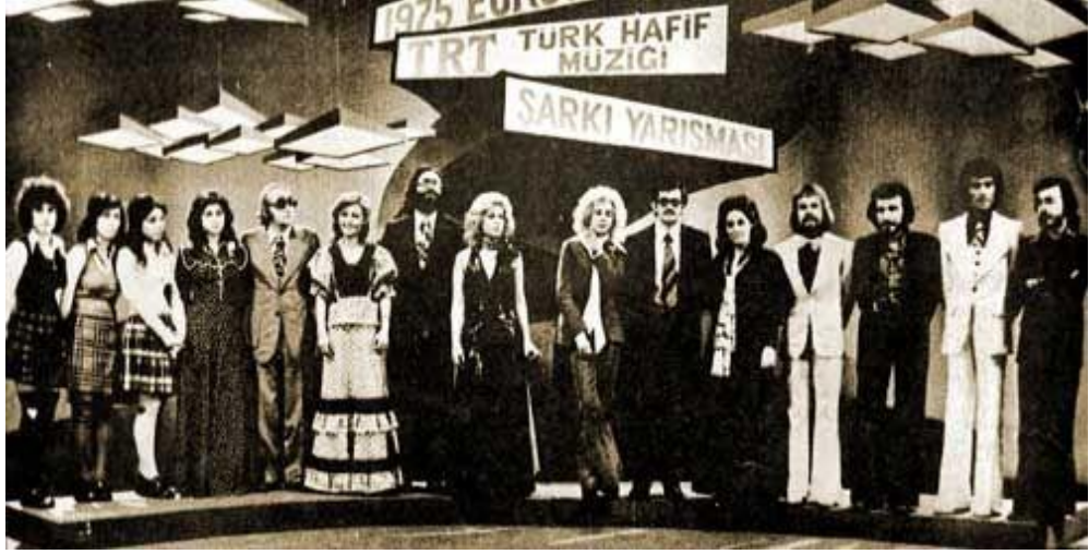
Resim 5. TRT Eurovision Ulusal Elemeleri ( https://eurovision-turkey-love.tr.gg/Eurovision-Ser.ue.venimiz.htm , 2013)

televizyon ekranından yansımıştır. 1973’de ise, Türkiye Cumhuriyeti’nin 2. Cumhurbaşkanı İsmet İnönü’nün cenaze töreni naklen yayınlanmıştır. 20 Temmuz 1974’de başlayan Kıbrıs Barış Harekâtından tüm Türkiye ve Avrupa TRT yayınlarıyla haberdar olmuştur. Eurovision Şarkı ve Beste Yarışması’na Türkiye, ilk kez 1975’de TRT’nin organizasyonu ile girmiştir. 1978’de ilk kez su altı kameraları kullanılarak “Derinlerdeki Geçmiş” adlı belgesel renkli film çekilmiştir ( https://www.trt.net.tr/Kurumsal/tarihce.aspx , E.T. 01.02.2019).