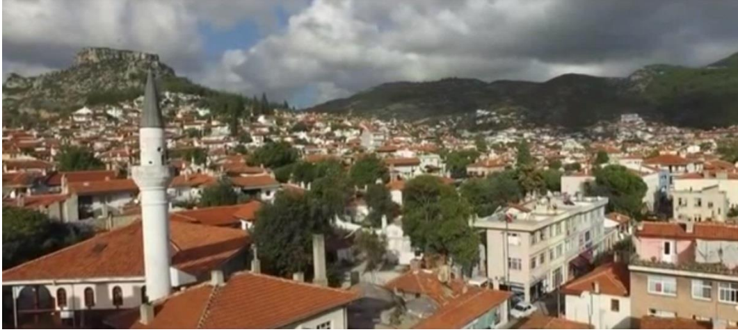
Resim 32. Ekisporter, Geçiř Sahnesinde Minarenin Kullanımı

beraberliğin oluřtuđu, sevginin saygının geliřtiđi, kulların kendini Allah'a daha yakın hissettiđi mekândır.