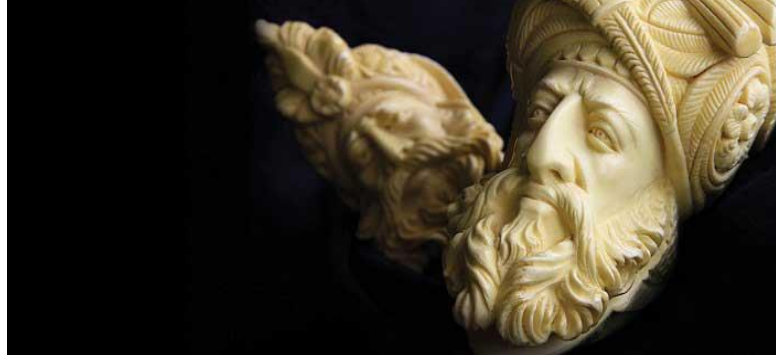
Resim 2. Eskişehir Lületaşı (Saygın, 2017)