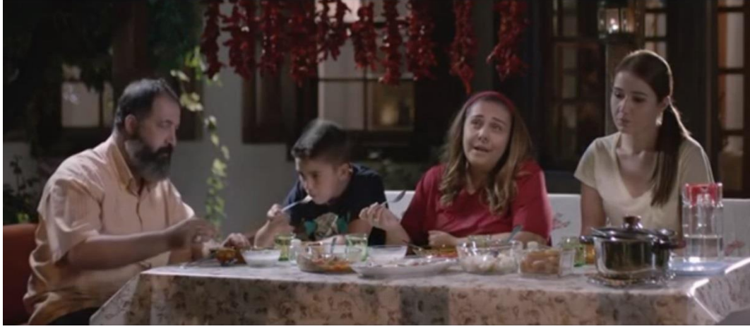
Resim 29. Ekisporter, Ailenin Sofrada Birlikte Yemek Yemesi

Filmde, komşuların yardımlaşması ve esnaf dayanışması da sıkça görülmektedir. Zeliha, bilmediği bir el işi örneğini öğrenmek için komşusuna gider ve ondan yardım ister. Diğer bir sahne ise Turan Usta'nın karakola düştüğünde, komşuların teselli için hemen Zeliha'nın yanına gelmeleridir. Türk toplumunda komşunun yeri, her daim çok önemli sayılmıştır. Bu yüzden "komşu komşunun külüne muhtaçtır, ev alma komşu al" gibi Türk atasözleri de bu değeri desteklemektedir. Aynı şekilde esnaf arkadaşları da Turan Usta'nın hastanede olduğunu öğrenince, ona yardım etmek istemişlerdir. Fuat Usta da hastaneye kaldırılan Turan Usta için alacaklılarla bir bir konuşarak, borçlarının askıya alınmasını rica etmiştir. Ayrıca Türkler de anlaşma anlamında yapılan el sıkışma ritüeli de halen kullanılmaktadır.