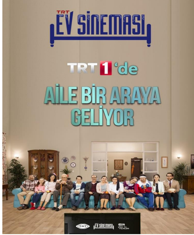
Resim 6. TRT Ev Sineması Kuşağı Afışı

TRT birçok dizi, program ve belgeselin yanı sıra son olarak da televizyon filmi çekmeye başlamıştır. Türk sinemasına yeni eserler ve genç senaristler kazandırmak, projenin diğer hedeflerinden biridir. Böylece proje internet sitesinde söylendiği gibi ‘hikâyesi olan herkese açık’ bir şekilde tasarlanmıştır. Ayrıca sitede, senaryo yazmayı bilmeyen fakat senaryo göndermek isteyenler için “Senaryo Nasıl Yazılır” köşesinde, The Script Lab ile beraber hazırlanan senaryo dersleri bulunmaktadır. Yine bu süreçte, hayata geçirilecek projelere yönelik, alanında uzman senaristler ve senaryo doktorları ile birlikte gerçekleştirilecek “Senaryo Geliştirme Atölyeleri” ve dünyanın en ünlü sinema okullarından “New York Film Akademisi”nin Hollywood deneyimli uzman eğitmenleri eşliğinde gerçekleşecek “Yapım Geliştirme Atölyeleri” ile filmlerin sanatsal ve yapım niteliklerinin artırılması amaçlanmaktadır ( http://www.trttvfilmleri.com/tr/proje-hakkinda , E.T._03.02.2019). Bu atölyelerde 12 gün süre ile 6-10 kişilik ekipler şeklinde çalışmalar yürütülür ve eğitmenler tarafından dramın evrensel ilkeleri ile senaryo değerlendirilerek çekilecek filmler bu süreçlerden sonra belirlenmiş olur.