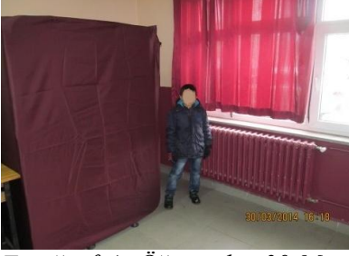
Fotoğraf 4: Öğrenciler 30 Mart 2014 Yerel Seçimlerini Yerinde İzlerken

Fotoğraf 3 ve 4'te görüldüğü gibi, öğrenciler seçim mahalini gezerek, seçimle ilgili somut yaşantılar kazanmaktadır. Henüz 4. sınıfta bulunan ve gelişimsel dönem olarak somut işlemler döneminde bulunan öğrenciler açısından bu gezinin öğrencilerin yerel seçim ve demokrasi kavramlarını somut bir şekilde öğrenmeleri açısından önemli olduğu düşünülmektedir.