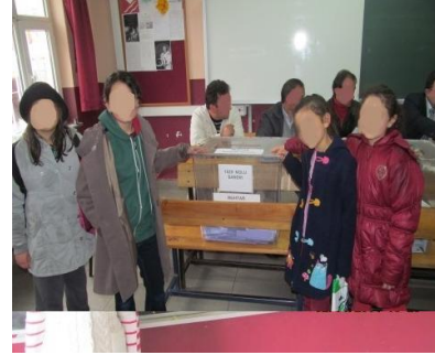
Fotoğraf 3: Öğrenciler 30 Mart 2014 Yerel Seçimlerini Yerinde İzlerken

Etkinliğin ikinci aşamasında 30 Mart 2014 tarihinde yerel yöneticilerin seçileceği seçimi yerinde izlemek için öğrencilerle seçim sandığının kurulduğu okula ve sınıfa gidilmiştir. Öğretmen tarafından seçim görevlilerine etkinlikle ilgili bir açıklama yapılmış, izinleri alınmış ve seçim alanı izlenerek fotoğraflanmıştır.