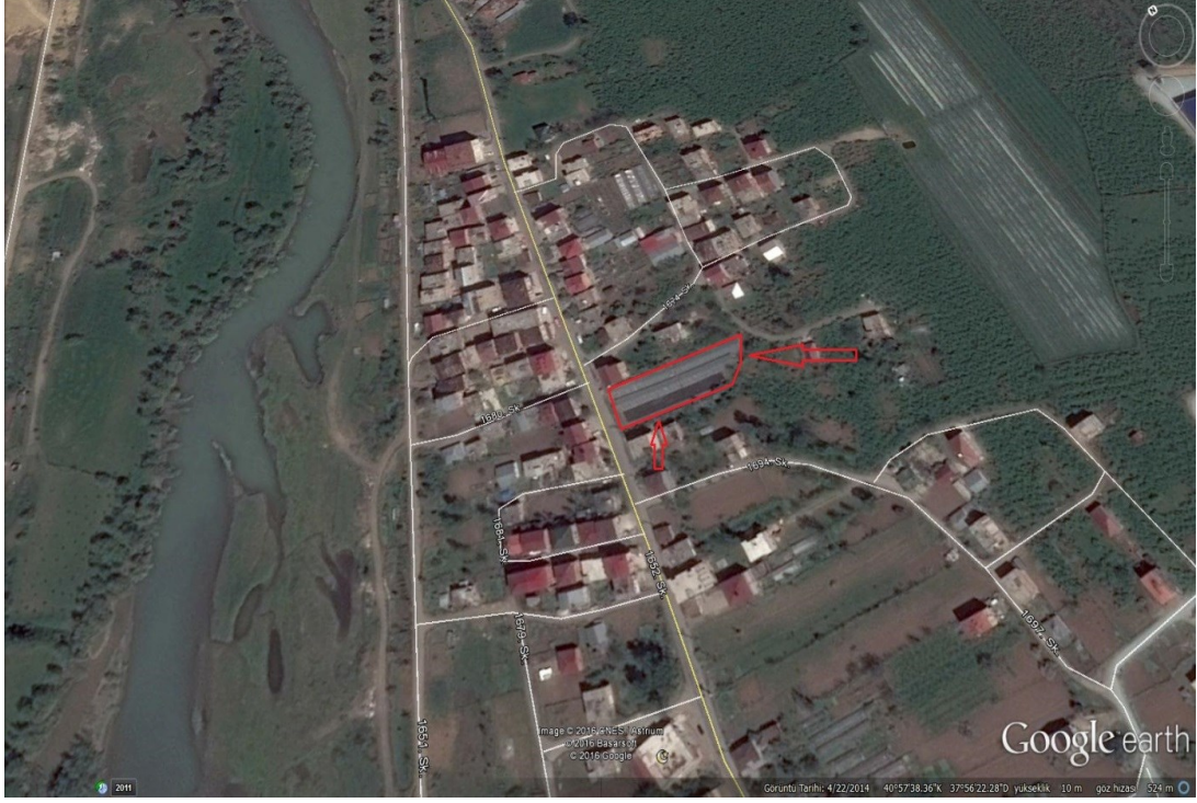
Şekil 3.1. Deneme Alanın Uydu Görüntüsü

düzlükler bulunmaktadır. Deneme alanı 9 metre yükseklikte kuzeyde 40^{\circ} 57' 37.96'' enlemleri ve doğuda 37^{\circ} 56' 23.64'' boylamları arasında yer almaktadır. Deneme alanına ait uydu görüntüsü Şekil 3.1’de verilmiştir.