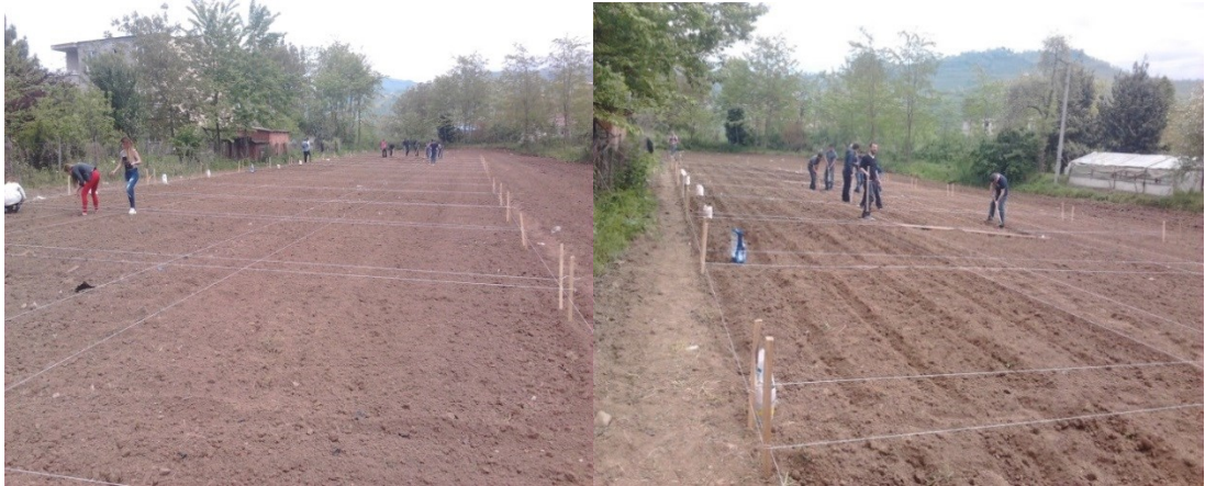
Şekil 3.3. Ekim işlemine ait görüntüler

Ekim işlemi 13.05.2015 tarihinde 14 \text{ m}^2 'lik parsellere sıra arası 70 cm ve sıra üzeri 20 cm olacak şekilde, 5-6 cm ekim derinliğine elle yapılmıştır. Ekim işlemine ait görüntüler Şekil 3.3'de verilmiştir.