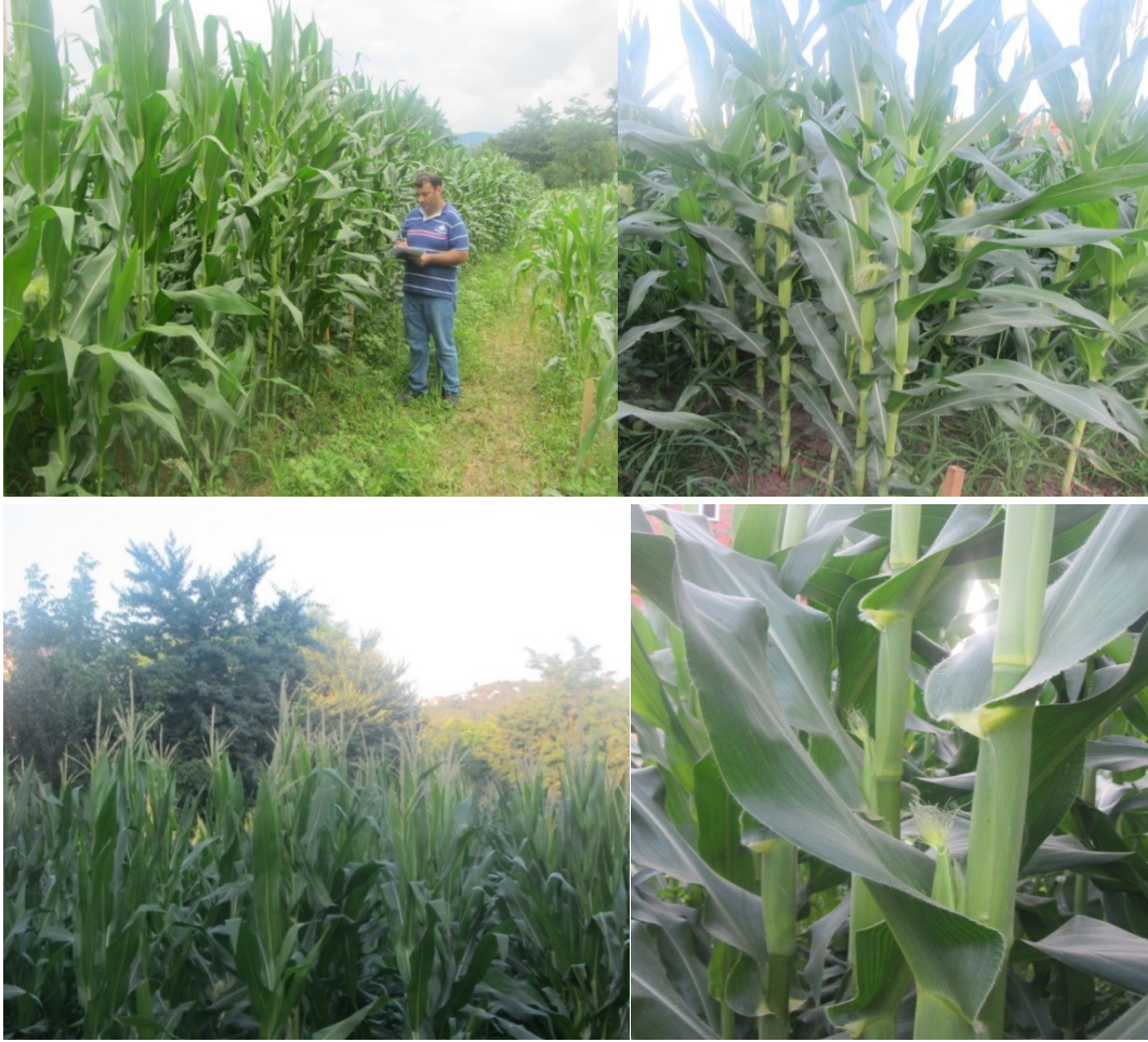
Şekil 3.7. Tepe ve Koçan Püskülü Çıkışlarının Kontrolüne Ait Görüntüler

Pearson yöntemine göre analiz edilmiş korelasyon kat sayıları ve incelenen özelliklerin önemlilikleri belirlenmiştir.