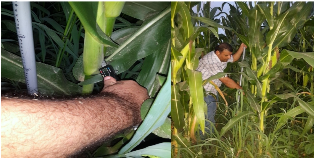
Şekil 3.8. Bitki Boyu, İlk koçan Yüksekliği ve Sap Çapı Ölçümlerine Ait Görüntüler