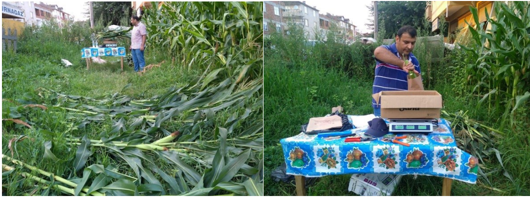
Şekil 3.6. Hasat İşlemine Ait Görüntüler

Hasat işlemi mısır çeşitleri \frac{1}{2} süt olum çizgisine geldiği 15.08.2015 tarihinde yapılmıştır. Parsel kenarlarında birer sıra ve parsel başlarında 30 cm kenar tesiri bırakılarak hasat yapılmıştır (Anonim, 2010). Hasat işlemine ait görüntüler Şekil 3.6'da verilmiştir.