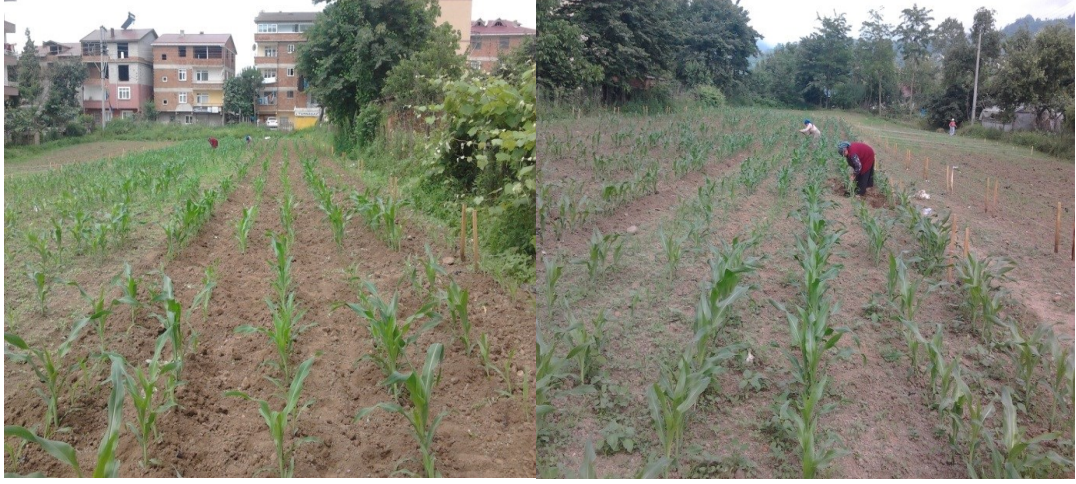
Şekil 3.5. Çapalama İşlemine Ait Görüntüler

Deneme alanına damla sulama sistemi kurulması planlanmış fakat yıl içerisinde yağışların yeterli olması sebebiyle sadece 30.07.2015 tarihinde bir defa sulama yapılmıştır.