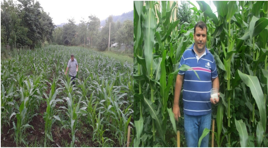
Şekil 3.4. Gübreleme İşlemine Ait Görüntüler

Deneme alanına toplamda 20 kg/da azot, 10 kg/da potasyum ve 10 kg/da fosfor verilmesi planlanmıştır. Ekimle birlikte 67 kg/da NPK (15.15.15) kompoze gübre uygulanarak 10 kg/da azot, 10 kg/da fosfor ve 10kg/da potasyum verilmiştir. Bitkilerin V6-V8 yapraklı olduğu dönemde AS(% 21 N) gübresi 23.8 kg/da verilerek 5 kg/da N verilmesi sağlanmıştır. Geriye kalan 5 kg/da azot tepe püskülü göstermeden önceki dönemde AS(% 21 N) gübresi ile 23.8 kg/da olacak şekilde verilmiştir (Güçdemir, 2006; Anonim, 2010).