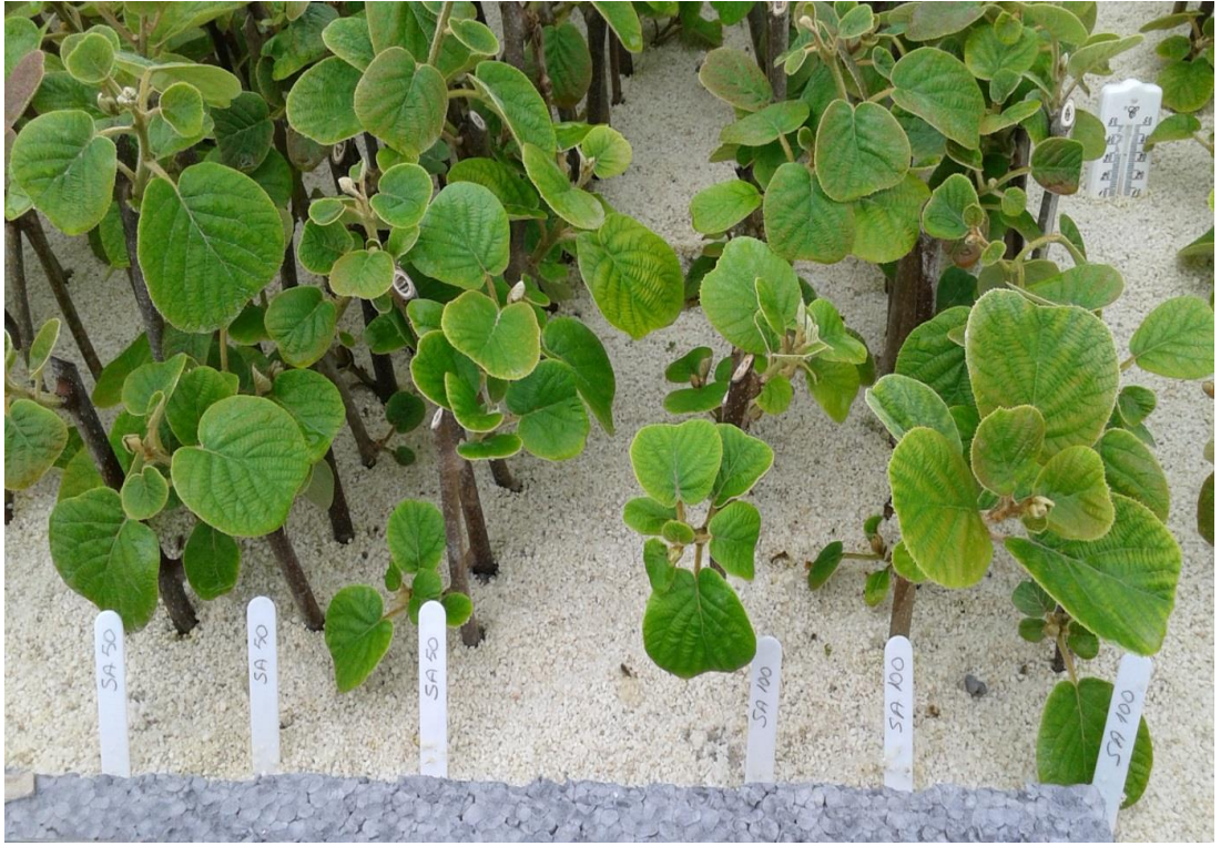
Ek 16. 26 °C köklendirme ortamında SA 50 ppm ve SA 100 ppm uygulamalarının görünümü (11.05.2016)