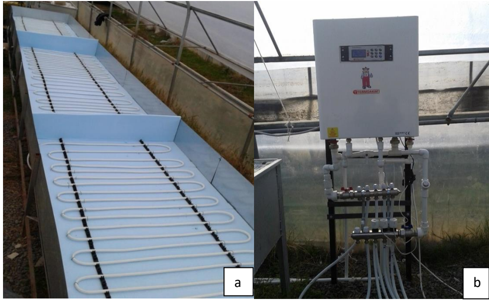
Şekil 3.1. Çoğaltma tavaları ve alttan ısıtma ünitesinin görüntüsü a. Çoğaltma tavası ve alttan ısıtma ünitesi b. Elektrikli kombi ve kolektörler

Çalışma 2016 yılında, Ordu Üniversitesi Ziraat Fakültesi uygulama sahasında bulunan yüksek plastik tünel içerisinde, alttan ısıtılmalı, termostat kontrollü tavalar içerisinde perlit ortamında yürütülmüştür (Şekil 3.1 ve Şekil 3.2). Araştırmada, Hayward kivi çeşidinin odun çelikleri kullanılmıştır. Araştırmada kullanılan çelikler 2000 yılında Ordu Gıda, Tarım ve Hayvancılık İl Müdürlüğü'nden temin edilen Hayward kivi fidanları ile kurulan bahçeden alınmıştır.