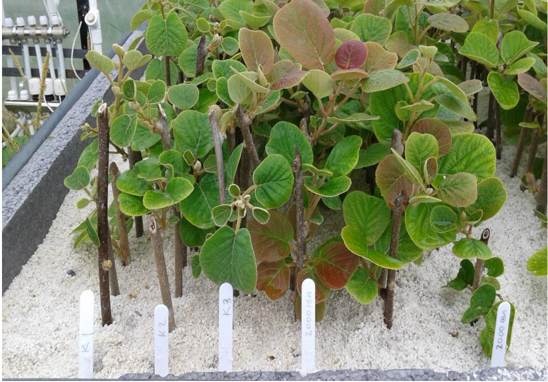
Ek 9. 21 °C köklendirme ortamında kontrol uygulaması ve IBA 2000 ppm uygulaması (11.05.2016)