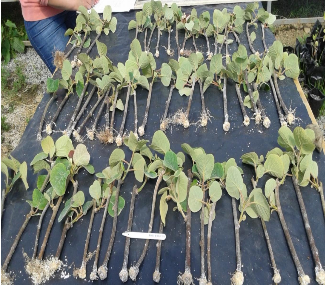
Ek 23. 14.06.2016 tarihinde 4000+200 ppm (IBA+SA) uygulaması, 21 °C köklendirme ortamından sökülen kivi çelikleri