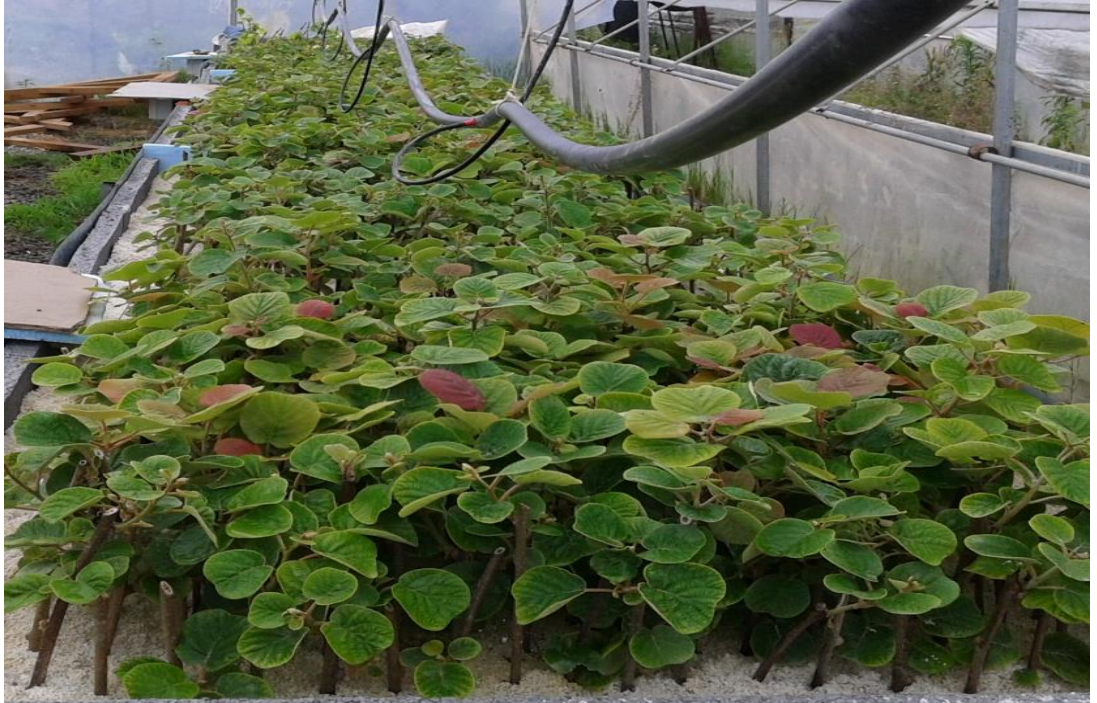
Ek 8. Dikimden 75 gün sonra uygulamaların genel görünüşü (30.05.2016)