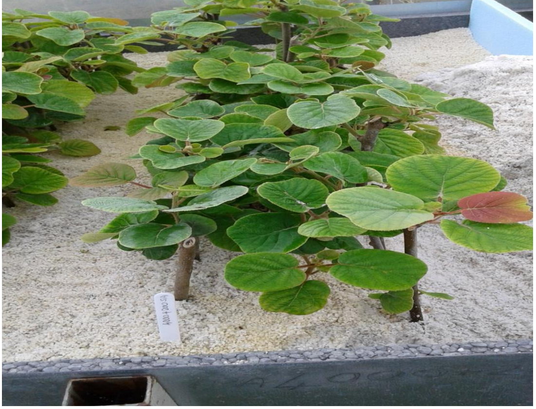
Ek 19. 30.05.2016 tarihinde 4000+200 ppm (IBA+SA) uygulamasının görünümü