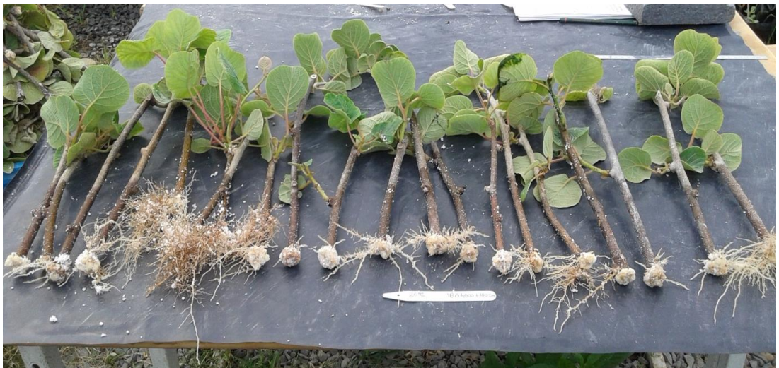
Ek 33. 26 °C köklendirme ortamı 4000+200 ppm (IBA+SA) (16.06.2016)