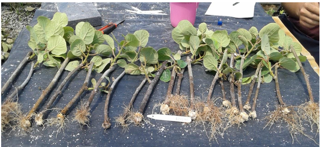
Ek 39. 26 °C IBA 6000 ppm (16.06.2016)