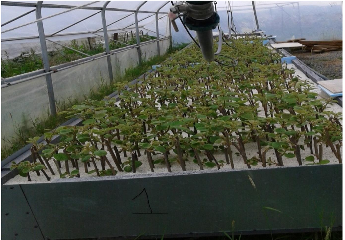
Ek 6. Dikimden 40 gün sonraki genel görünüş (25.04.2016)