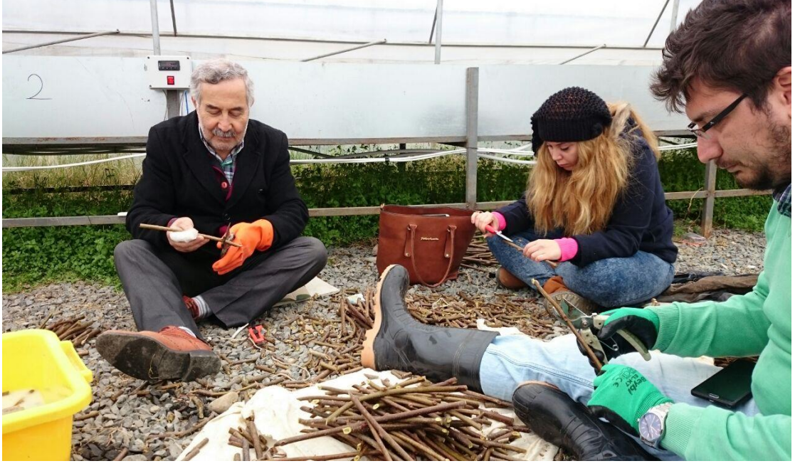
Ek 1. Çeliklerin dikime hazırlanması