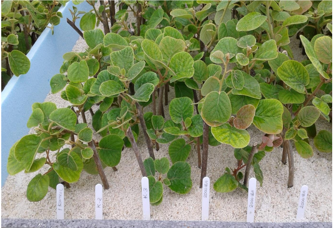
Ek 14. 26 °C köklendirme ortamında kontrol uygulaması ve IBA 2000 ppm uygulaması (11.05.2016)