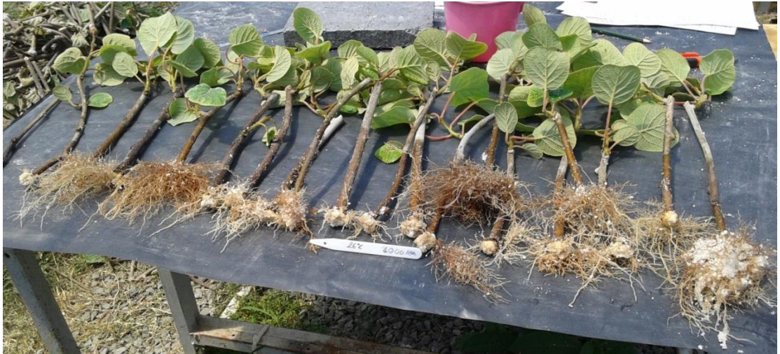
Ek 40. 26 °C IBA 4000 ppm (16.06.2016)