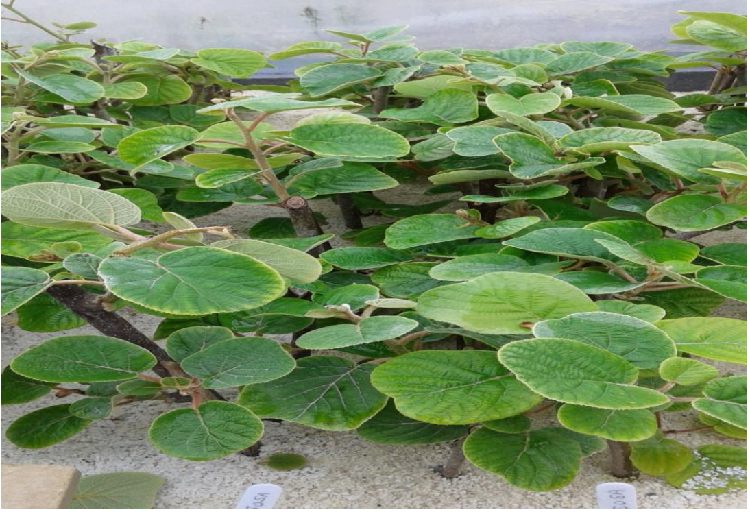
Ek 21. 30.05.2016 tarihinde SA 50 ppm uygulamasının görünümü