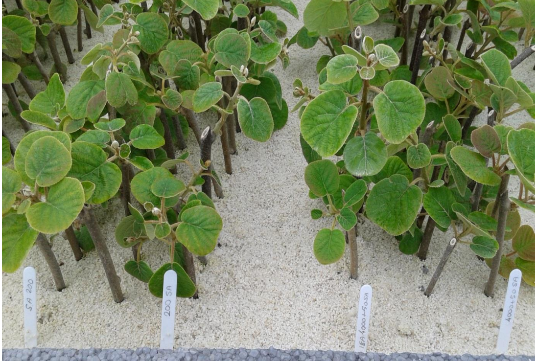
Ek 17. 26 °C köklendirme ortamında SA 200 ppm ve 4000 + 50 ppm (IBA+SA) uygulamalarının görünümü (11.05.2016 )