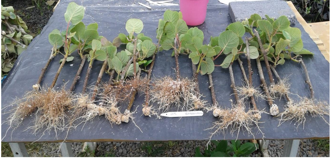
Ek 34. 26 °C köklendirme ortamı 4000+100 ppm (IBA + SA) (16.06.2016)