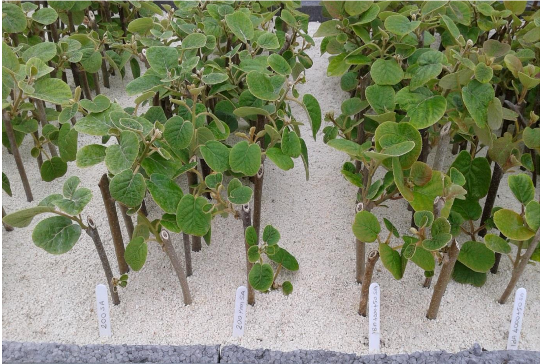
Ek 12. 21 °C köklendirme ortamında 200 ppm SA ve IBA 4000 ppm +50 ppm SA uygulamaları arasındaki renk farkı (11.05.2016)