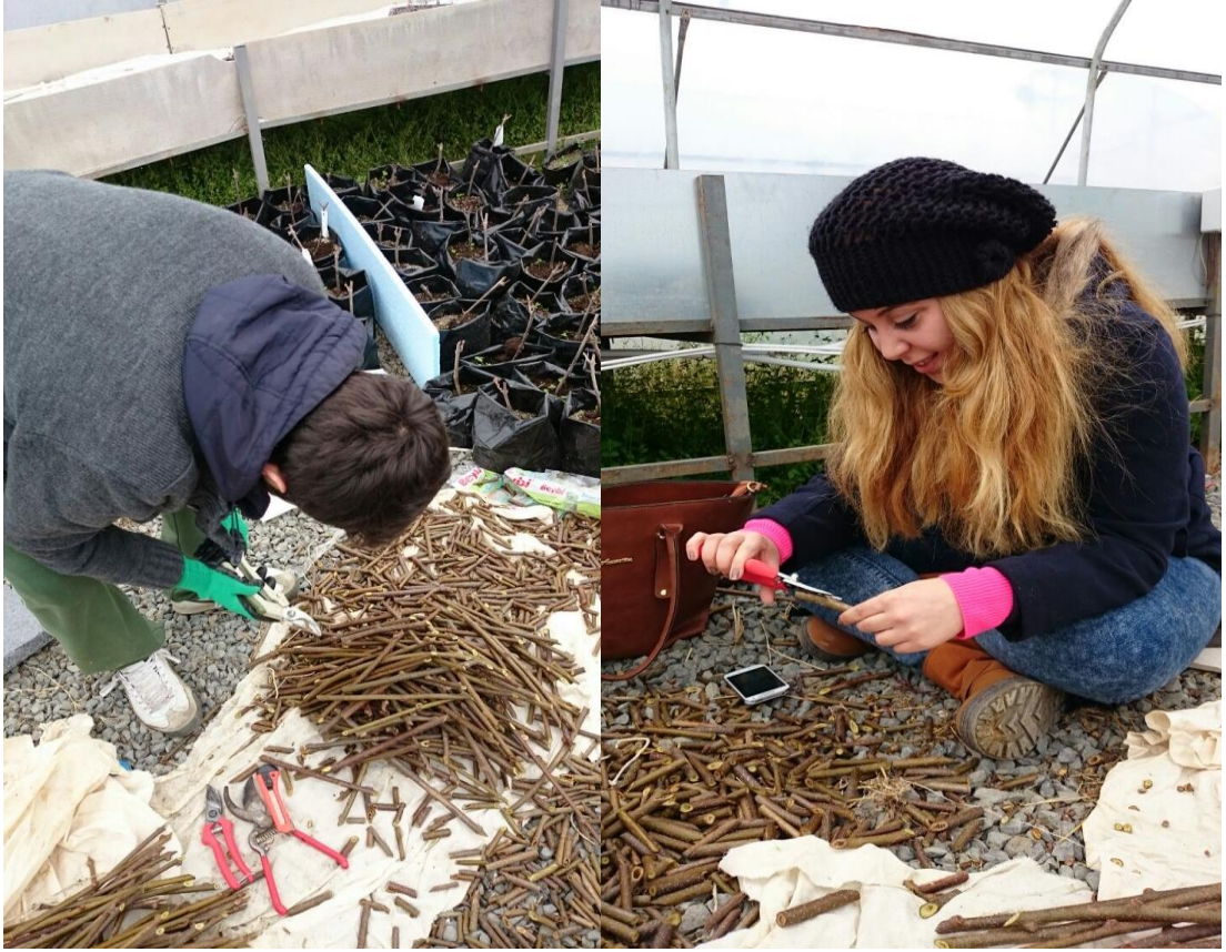
Ek 2. Çeliklerin hazırlanması çalışmaları