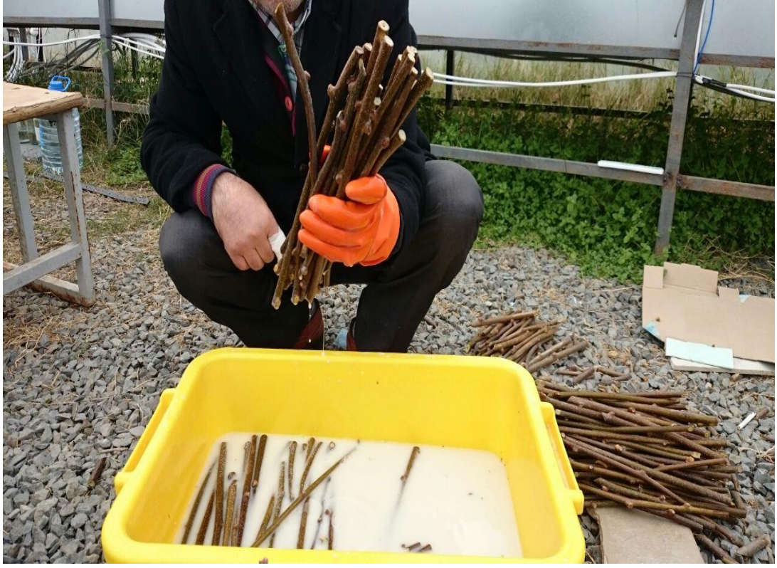
Ek 3. eliklerin fungusle muamelesi