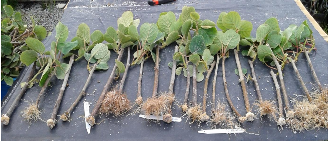
Ek 29. 21 °C köklendirme ortamı IBA 6000 ppm (15.06.2016)