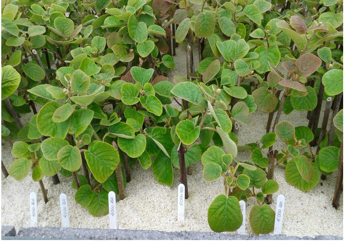
Ek 15. 26 °C köklendirme ortamında IBA 4000 ppm ve 6000ppm uygulamalarının görünümü (11.05.2016)