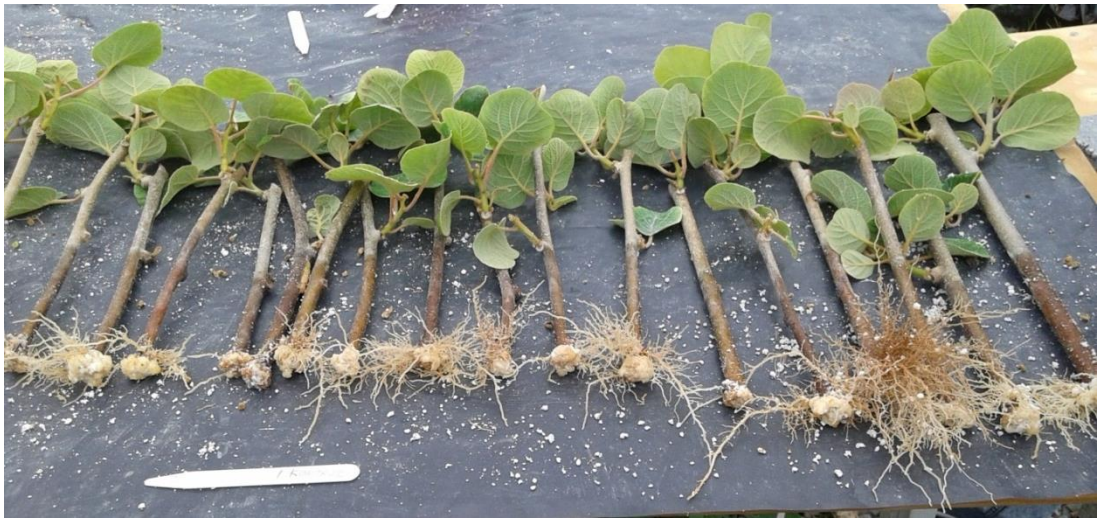
Ek 32. 21 °C köklendirme ortamı kontrol (15.06.2016)