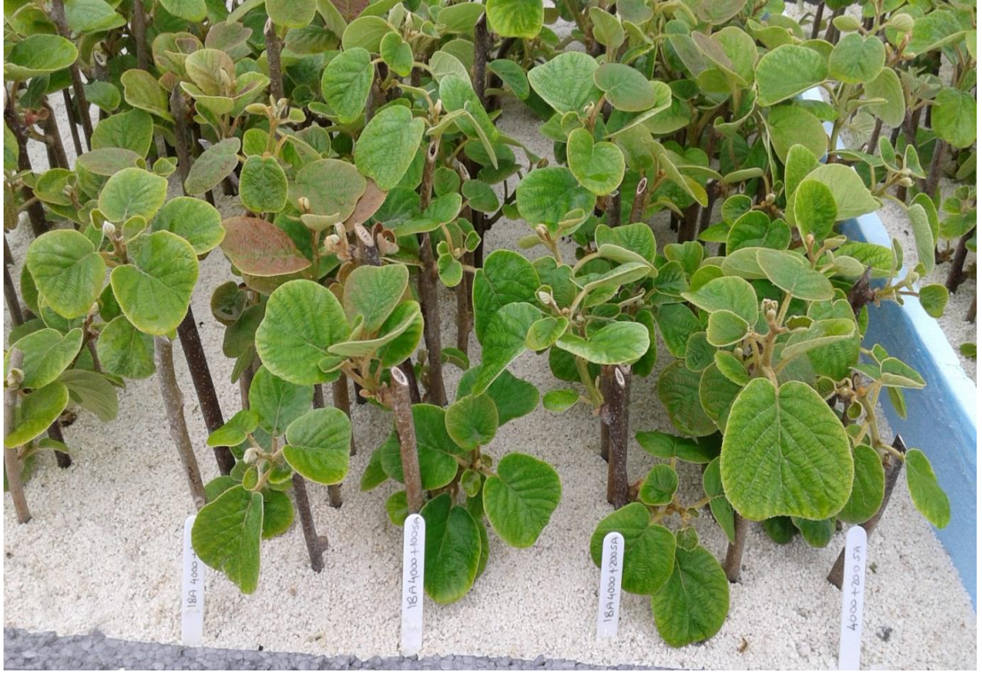
Ek 13. 21 °C köklendirme ortamında 4000+100 ppm (IBA+SA) ve 4000+200 ppm (IBA+SA) uygulamaları (11.05.2016)