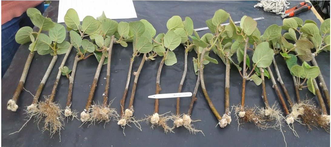
Ek 24. 21 °C köklendirme ortamı 4000+100 ppm (IBA+SA) (14.06.2016)