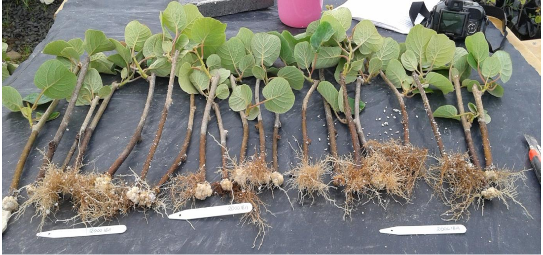
Ek 31. 21 °C köklendirme ortamı IBA 2000 ppm (15.06.2016)