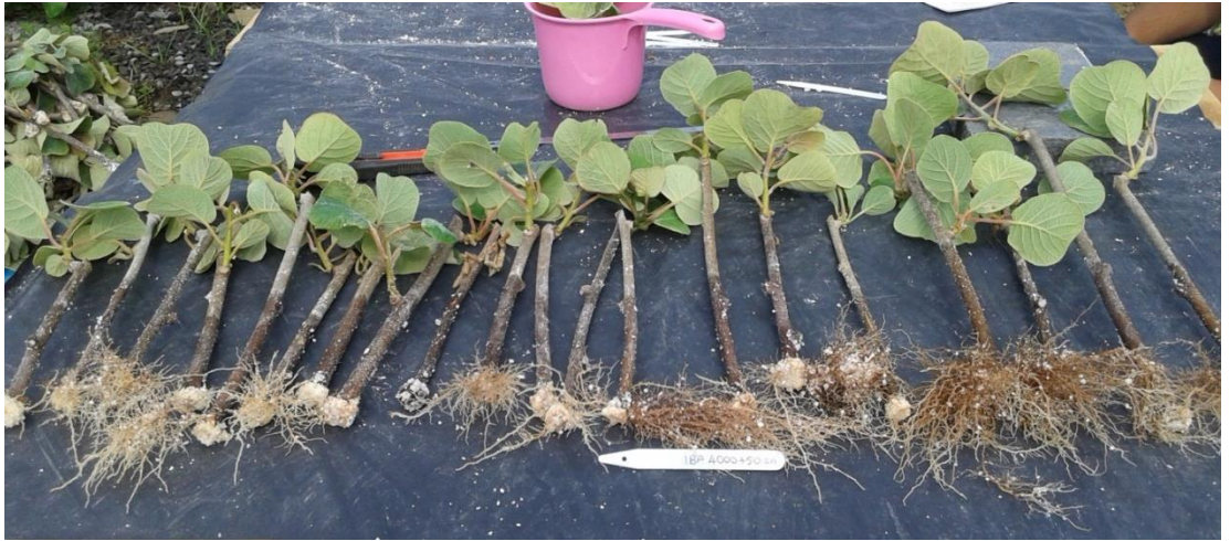
Ek 35. 26 °C köklendirme ortamı 4000+50 ppm (IBA + SA) (16.06.2016)