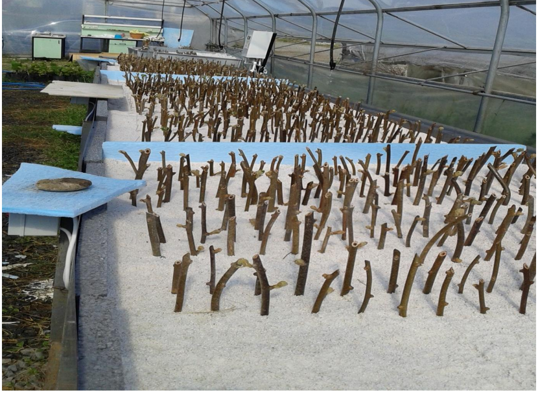
Ek 5. Dikimden 20 gün sonra çeliklerin genel görünüşü (04.04.2016)