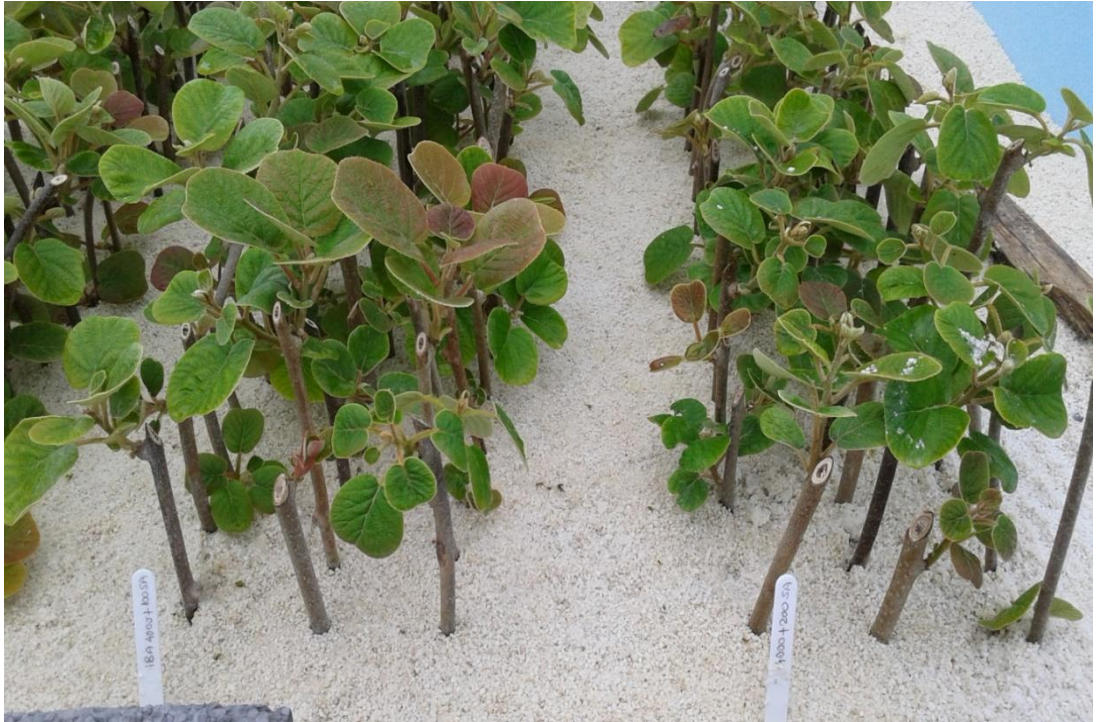
Ek 18. 26 °C köklendirme ortamında 4000 + 100 ppm (IBA+SA) ve 4000 + 200 ppm (IBA+SA) uygulamalarının görünümü (11.05.2016)