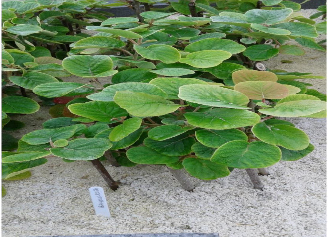
Ek 20. 30.05.2016 tarihinde 4000+100 ppm (IBA+SA) uygulamasının görünümü