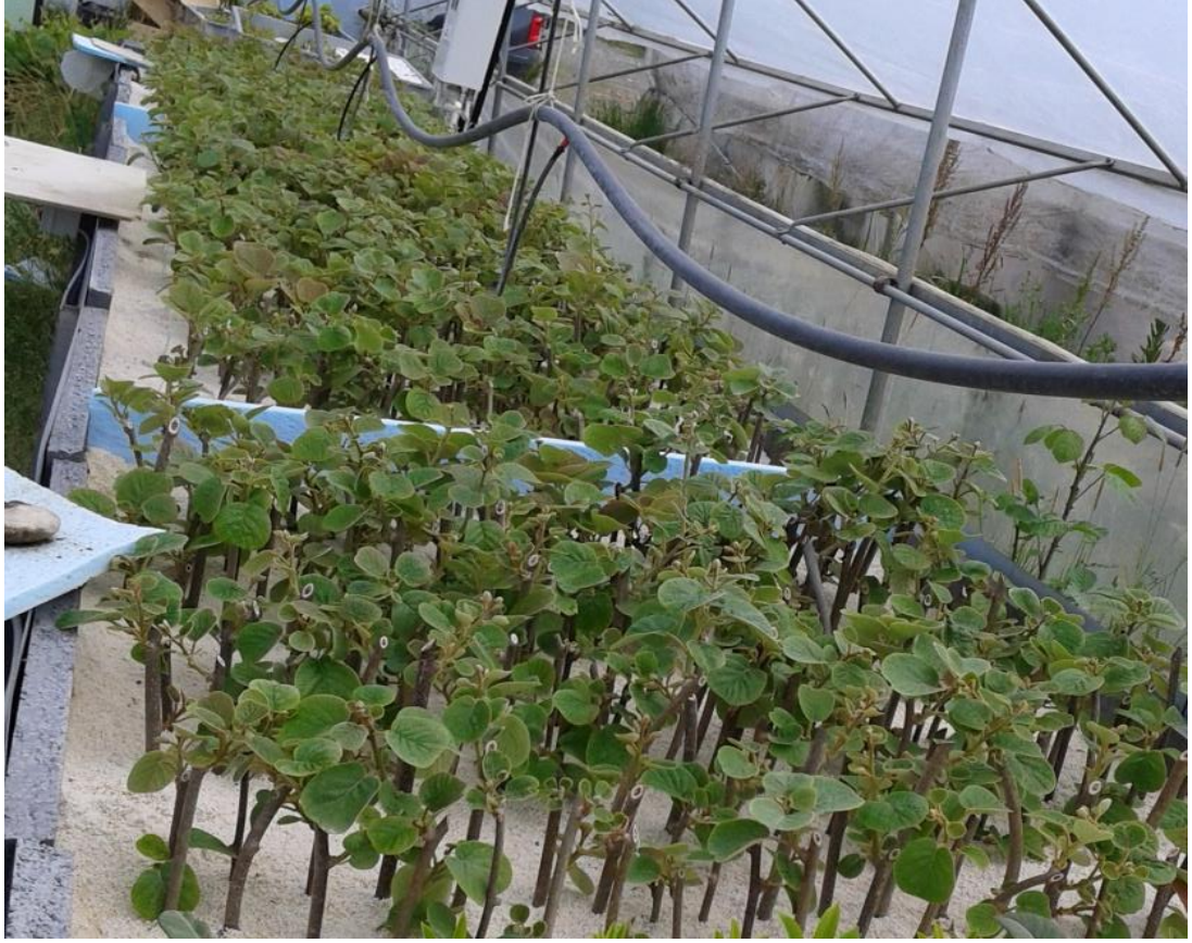
Ek 7. Dikimden 55 gün sonraki genel görünüş (10.05.2016)