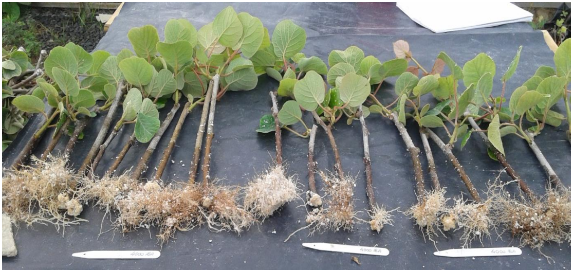
Ek 30. 21 °C köklendirme ortamı IBA 4000 ppm (15.06.2016 )