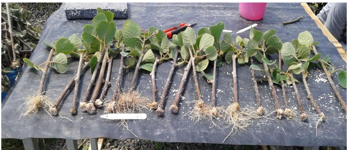
Ek 42. 26 °C kontrol (16.06.2016)