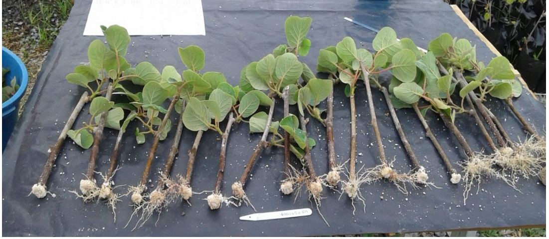
Ek 25. 21 °C köklendirme ortamı 4000+50 ppm (IBA+SA) (14.06.2016)