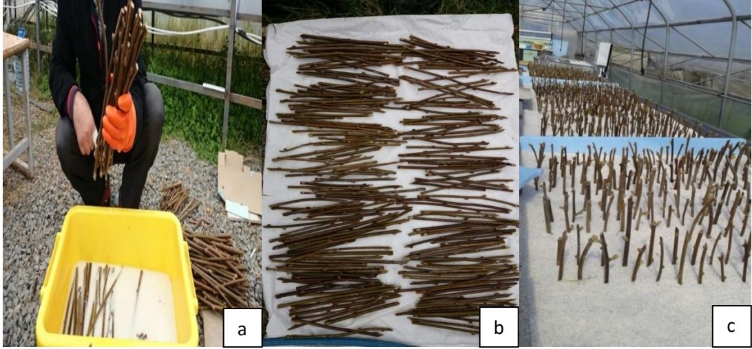
Şekil 3.3. Çeliklerin hazırlanışı, fungusit uygulaması ve dikilmesi