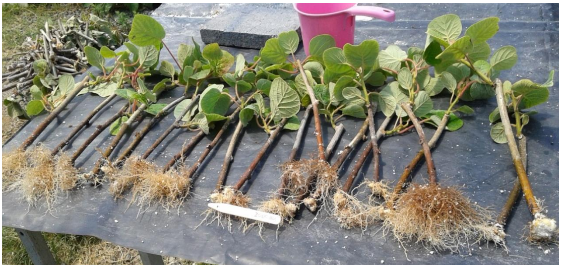
Ek 41. 26 °C IBA 2000 ppm (16.06.2016)