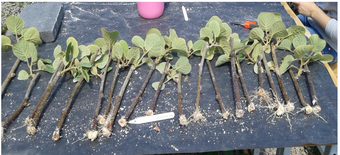
Ek 36. 26 °C 200 ppm SA (16.06.2016)