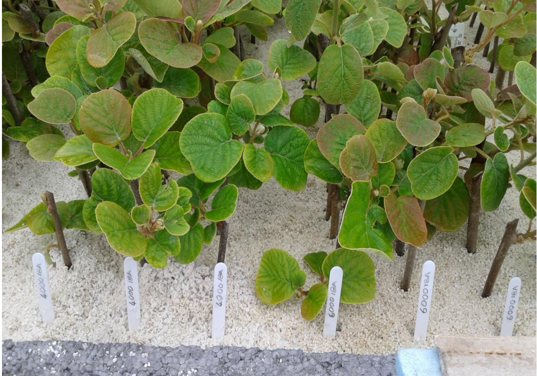
Ek 10. 21 °C köklendirme ortamında IBA 4000 ppm ve 6000 ppm uygulaması (11.05.2016)