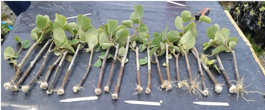
Ek 27. 21 °C köklendirme ortamı 100 ppm SA (14.06.2016)