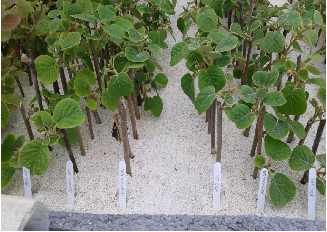
Ek 11. 21 °C köklendirme ortamında 50 SA ve 100 ppm SA uygulamaları (11.05.2016)