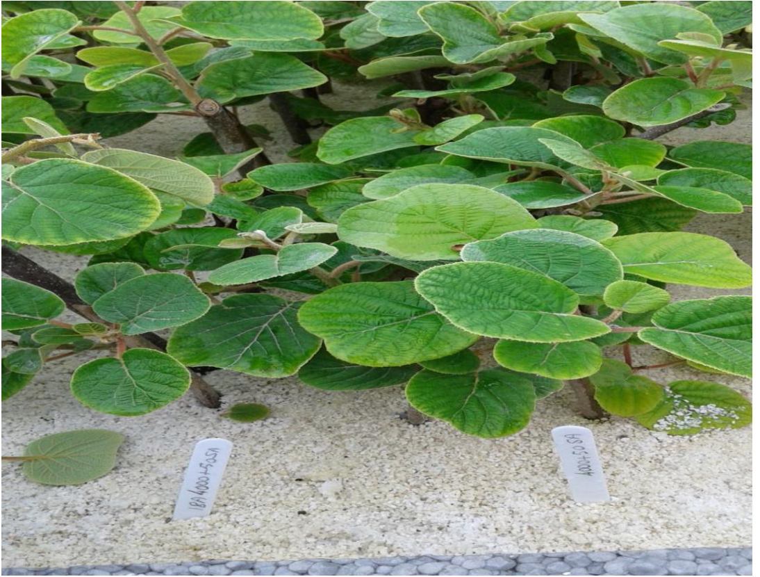
Ek 22. 30.05.2016 tarihinde 4000+ 50 ppm (IBA+SA) uygulamasının görünümü