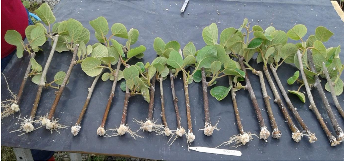
Ek 26. 21 °C köklendirme ortamı 200 ppm SA (14.06.2016 )