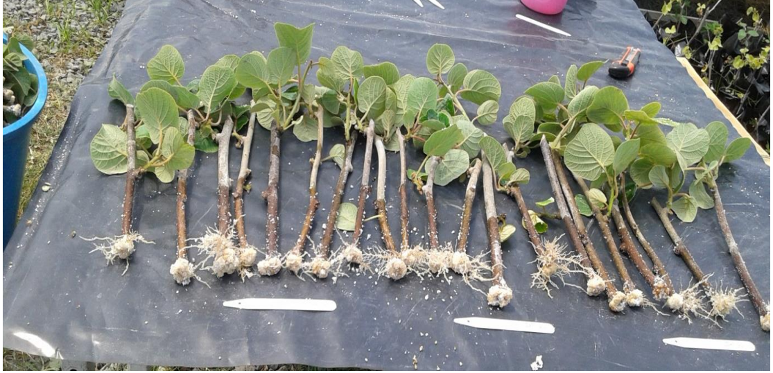
Ek 28. 21 °C köklendirme ortamı 50 ppm SA (14.06.2016 )