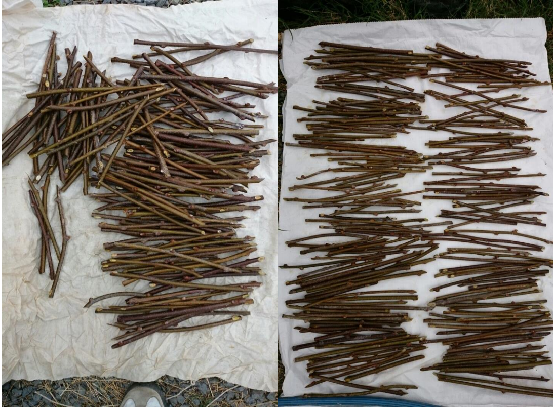
Ek 4. eliklerin fungusle muamele sonrası