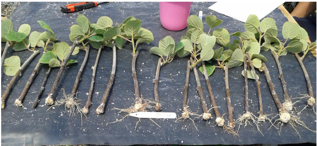
Ek 38. 26 °C 50 ppm SA (16.06.2016)