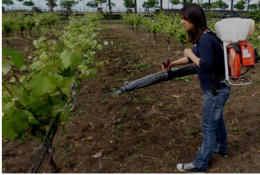
Şekil 3.2. Omcalara bor uygulamasına ait görünüm