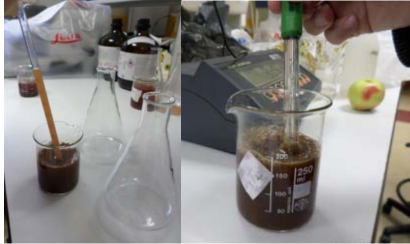
Şekil 3.5. Şıra ölçümlerinden görünüm

Olgunluk İndisi: Olgunluk indisi, SÇKM/Asitlik değerlerinden yararlanılarak belirlenmiştir.