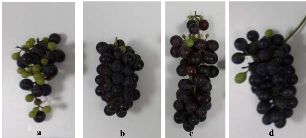
řekil 4.1. Isabella üzüm çeřidine deđişik ( a) Kontrol, b) % 0.1 H_3BO_3 , c) % 0.2 H_3BO_3 , d) % 0.3 H_3BO_3 ) dozlarda uygulanan borik asidin salkım üzerine etkisi

Kumar ve ark., (2004), Muscat üzüm çeřidini kullanarak yaptıkları mikro element gübrelemesinde borun yalnız veya çinko ile kombine edilmiř uygulamalarında da salkım ađırlığında artış elde edilmiřtir. Mostafa ve ark., (2006), Akl ve ark., (2014) Fawzi ve ark., (2014) ile Güneř ve ark., (2015), tarafından gerçekteřtirilen deneme sonuçlarının da salkım ađırlığı açasından bu arařtırma sonuçlarıyla benzerlik gösterdiđi belirlenmiřtir.