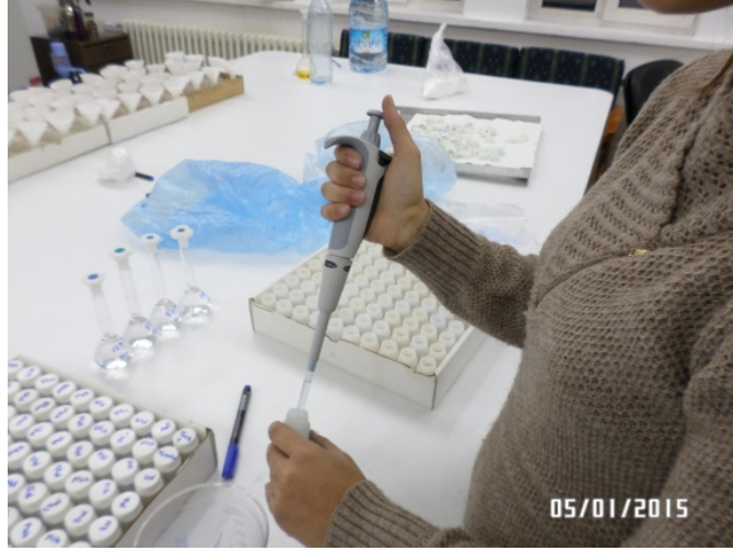
Şekil 3.4. Mikro element analizinden bir görünüm