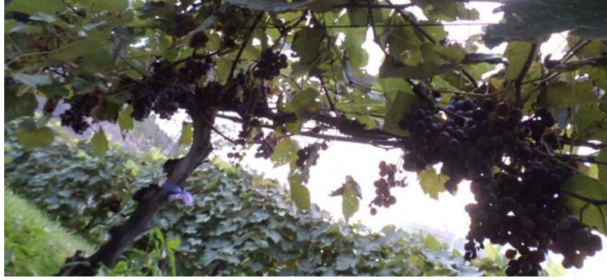
Şekil 3.1. Isabella üzüm çeşidi salkımlarının omca üzerindeki görünümü