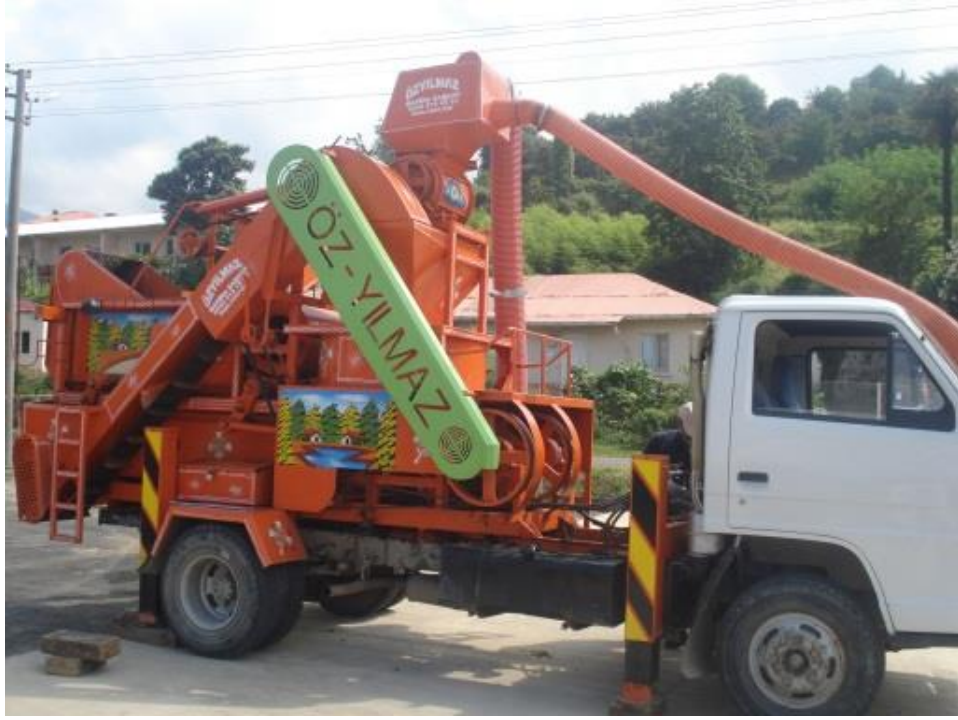
Şekil 3.1.2. Patoz Makinesinin Genel Görünümü