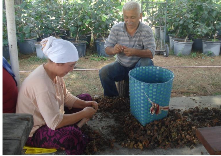
Şekil 3.2.1.2. Kuruyan zuruflu fındıkların elle ayıklanması

Ayıklama işleminden sonra her iki gruptan 60'ar kg kabuklu fındık elde edilmiştir. Elde edilen kabuklu fındıklardan ayıklama sonrası kurutma sürecine başlamadan, kurutmadan önce yapılacak analizler için 6'şar kg örnek alınmıştır. Çalışma 2 tekerrürlü (paralel) yürütüldüğü için her bir çeşitten 6'şar kg olmak üzere 2 örnek grubu oluşturulmuştur. Böylece her bir çeşitte patozla ayıklanan ve elle ayıklanan gruplarda kalan 48'er kg'lık fındık örnekleri harman yerine getirilerek ayrı ayrı serilerek kurutmaya tabi tutulmuştur. 2 gün boyunca zaman zaman alt üst edilerek kurutulan fındıklar, daha sonra çeşit ve ayıklama şekli göz önünde bulundurularak 6'şar kg olmak üzere jüt çuvallara konulmuştur. Jüt çuvallara konulan fındık örnekleri kurutmadan sonra, 3., 6. ve 9. aylarda analizleri yapılmak üzere oda