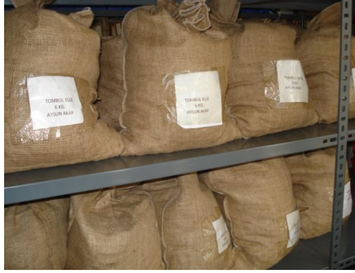
Şekil 3.2.1.3. Jüt çuvallar içerisinde oda şartlarında depolanan fındıklar

şartlarında depolanmıştır (Şekil 3.2.1.3). Oda şartlarının sıcaklığı 20 °C ile 24 °C aralığında tutulmuştur.