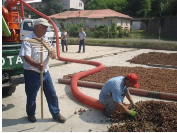
Şekil 3.2.1.1. Kuruyan zuruflu fındıkların patozla ayıklanması