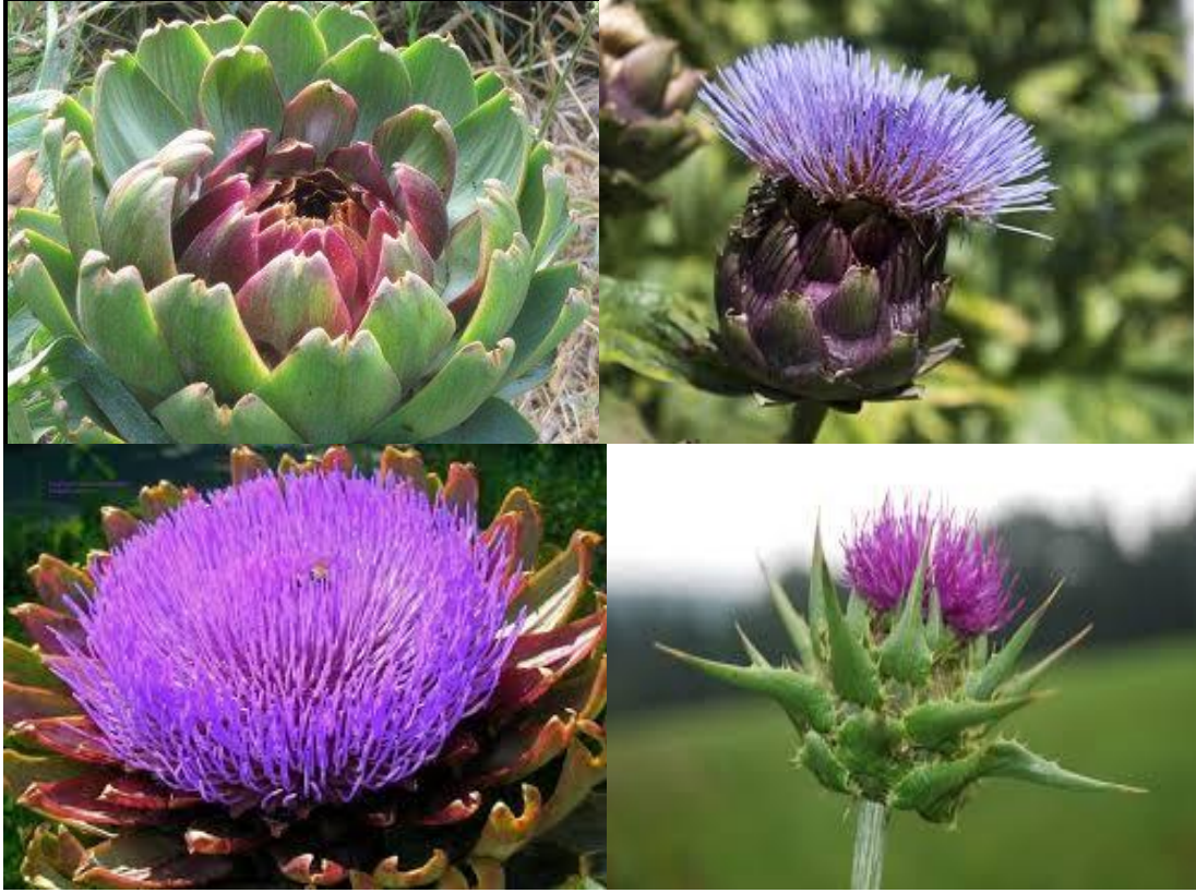
Şekil 2.2. Farklı türdeki enginar meyvelerinin görünümü

içerisindeki cynarin maddesi nedeniyle karaciğer dostu olarak bilinmektedir (Ekinci, 1972).