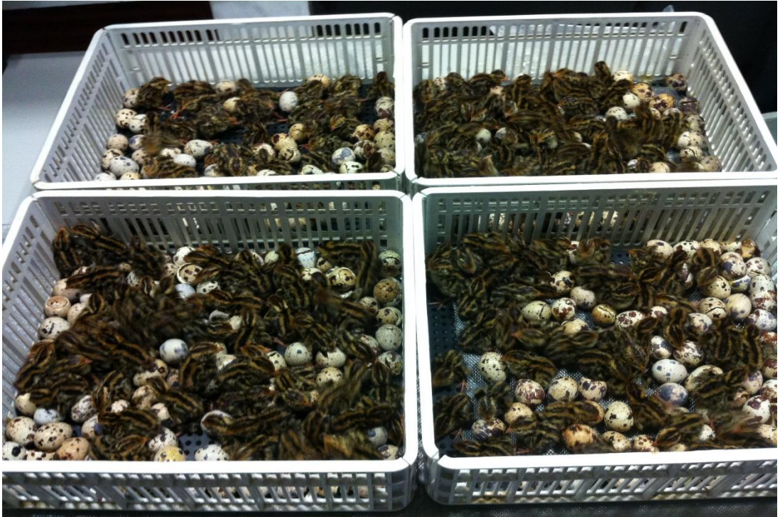
Şekil 3.1. Kuluçka çıkışı yapılan bıldırcın civcivleri

Bu arařtırma, Ordu Üniversitesi Hayvan Deneyleri Yerel Etik Kurulu tarafından 17.03.2015 tarih ve 82678388/22 sayılı karar ve yerel etik kurul belgesi ile onaylanmıştır.