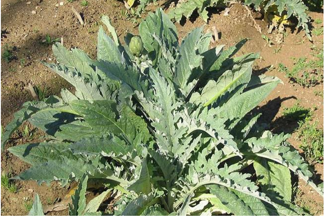
Şekil 2.2. Enginarın( Cynara Scolymus L. ) görünümü

Gelişmiş bir enginar bitkisi 1 m kadar yüksekliğe sahip olmakta ve toprak yüzeyinde 1.20 m 2 kadar bir alan kaplamaktadır. Yapraklar toprak üzerinde rozet şeklinde dizilmektedir. Bitkiler, çeşide ve yetiştirme mevsimlerine göre değişmekle birlikte 30-40 kadar yaprak oluşturmaktadır (Choux ve Foury, 1994).