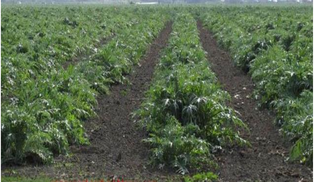
Şekil 2.1. Enginar ( Cynara Scolymus L.) tarlasından bir görüntü

2011 yılında Türkiye'nin dünya enginar üretim miktarı içindeki payı %2.16 olarak gerçekleşmiştir. Türkiye'de 2011 yılında 2444 hektar alanda toplam 33460 ton geleneksel enginar üretimi gerçekleştirilmiştir (Bektaş ve Saner, 2013). Türkiye'nin geleneksel enginar üretim alanı 2000-2011 döneminde %11.60 oranında, geleneksel enginar üretim miktarı %36.57 oranında artmıştır. Türkiye'de organik enginar üretim miktarı 2011 yılında 9138 tondur (Bektaş ve Saner, 2013).