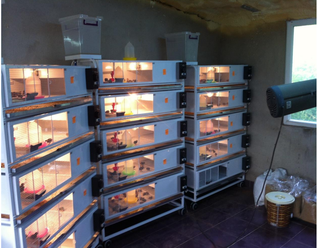
Şekil 3.3. Araştırma ünitesinin görünümü

Araştırma herhangi bir ilave içermeyen mısır-soya küspesi esaslı kontrol grubu, kontrol rasyonuna %1, %3 ve %5 düzeylerinde kurutulmuş enginar yapraklarının ilave edildiği grup olmak üzere 4 grup, 3 tekerrür ve her tekerrürde de 14 bildircının bulunduğu 168 adet karışık cinsiyette bildircın ile yapılmıştır. Bildircın civcivleri deneme başı canlı ağırlık ortalamaları benzer olacak şekilde tesadüf parselleri deneme planına göre otomatik ısıtma sistemli bildircın büyütme kafesine yerleştirilmişlerdir. Araştırma 35 günlük yaşa kadar sürdürülmüştür.