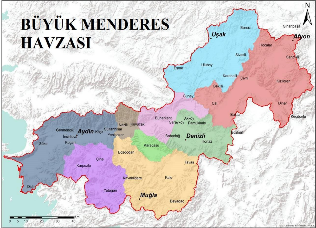
Harita1: Büyük Menderes Havzası Sınırlarına Dahil Olan Sahalar