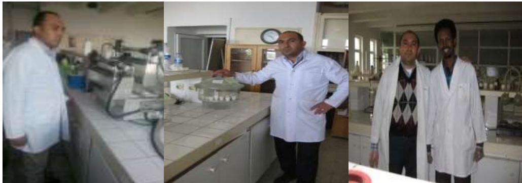
Şekil 3.2. Denemede kullanılan toz ve pelet yemlerde rutin analizlerin yapılması

Denemede kullanılan yemlerin her biri 1 mm'lik elekten geçecek şekilde öğütüldükten sonra; kuru madde (KM), ham protein (HP) ve ham kül (HK) analizleri AOAC, (1998)'nin bildirdiği şekilde, ham yağ (HY) analizi ANKOM XT15 extraction system (Ankom Technology Corp.) cihazı kullanılarak Kutlu (2008)'nun bildirdiği şekilde yapılmıştır (Şekil 3.2.). Asit çözücülerde çözünmeyen lifli maddeler (ADF), asit çözücülerde çözünmeyen lignin (ADL) ve nötr çözücülerde çözünmeyen lifli maddeler (NDF) ve ham selüloz (HS) analizleri Ankom Technology (2003) metodu kullanılarak ANKOM 2000 Fiber Analyzer (Ankom Technology, Macedon NY) cihazı ile belirlenmiştir. Organik maddeler (OM), nitrojensiz öz maddeler (NÖM), selüloz ve hemiselüloz değerleri ise hesaplama yoluyla bulunmuştur.