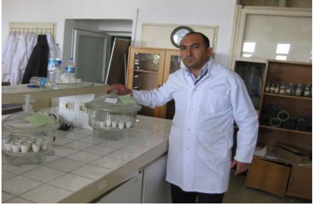
EK 9. Extracte edilmiş yem örneklerinin desikatörde muhafazası