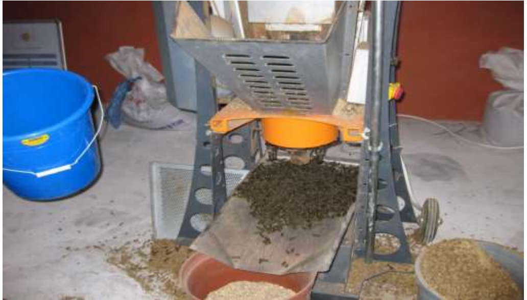
EK 6. Pelet yapım makinesinden çıkmış peletler