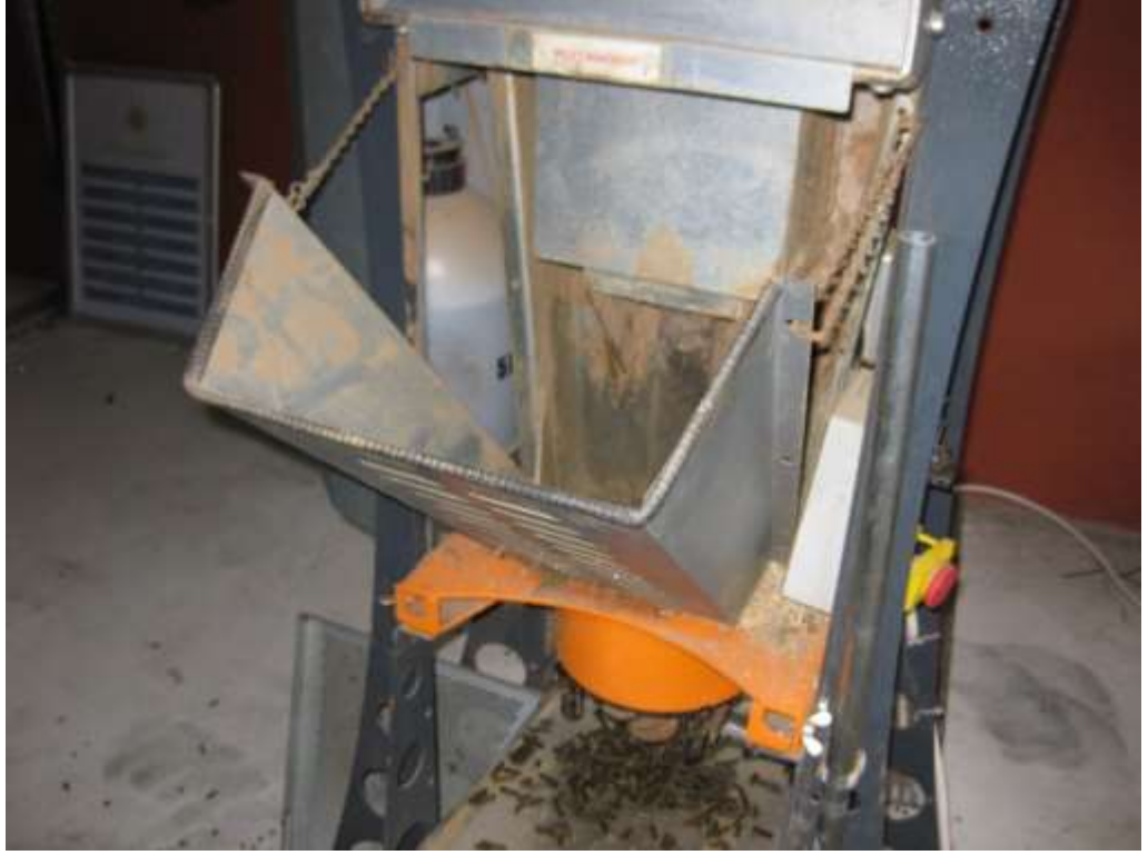
EK 5. Pelet yapım makinesi