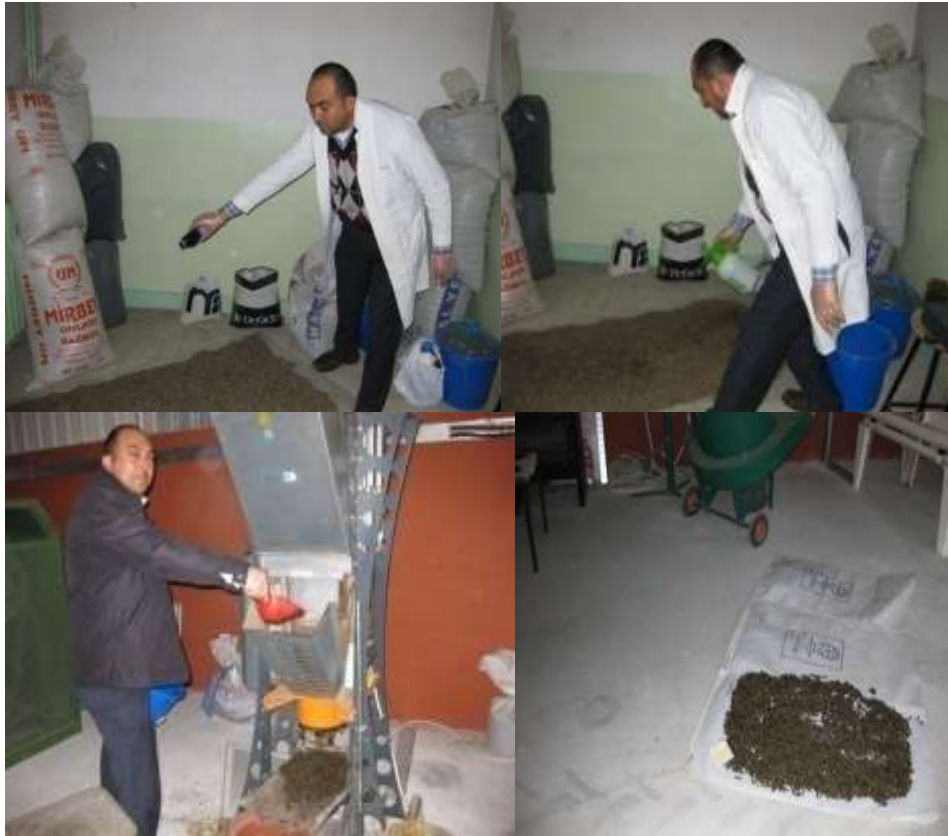
Şekil.3.1. Denemede kullanılan materyallerin hazırlanması

Üre ve melas ŞPBY'na püskürtücü yardımıyla homojen olarak katılmıştır (Şekil 3.1). Peletleme işlemi 19/03/2015 tarihinde Samsun, Karadeniz Tarımsal Araştırma Enstitüsü, Enerji Birimi'nde bulunan; pelet çapı: 6 mm, motor gücü: 3 Kw, peletleme kapasitesi: 50-100 Kg/h kapasitede (materyale göre değişir), elektrikle (400 V) çalışır, peletleme ünitesi dikey pozisyonda ve taşınabilir tip pelet makinesi ile yapılmıştır (Şekil 3.1). Yemler katkı maddeleriyle iyice karıştırıldıktan sonra peletleme makinasında peletlenmiş ve bu işlem esnasında oluşan ısı dolayısıyla sıcak olan peletler oda ısısında soğutulmuştur (Şekil 3.1.).