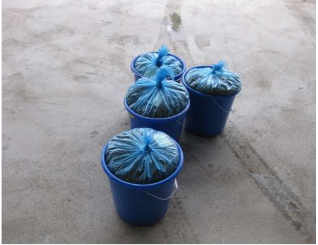
EK 4. Peletlenmiş ve soğutulmuş yemler