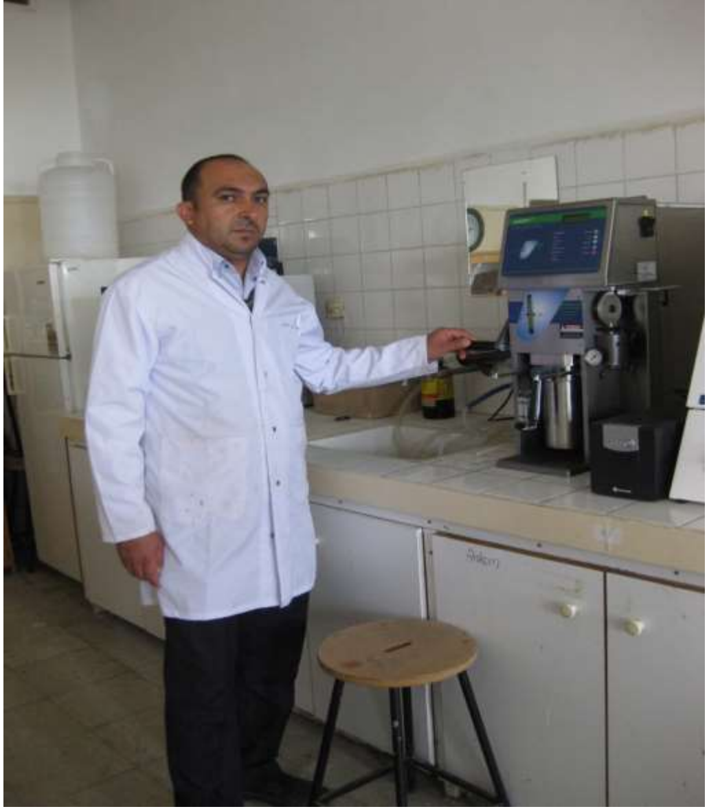
EK 8. Ekstraktların Hazırlandığı Ancom Extractor