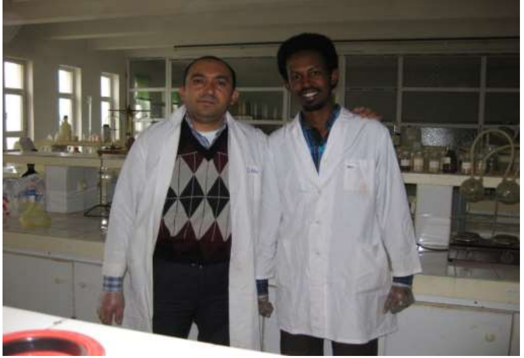
EK 3. Ondokuz Mayıs Üniversitesi Ziraat Fakültesi Zootečni Bölümü Hayvan Yemler ve Hayvan Besleme Laboratuvarı