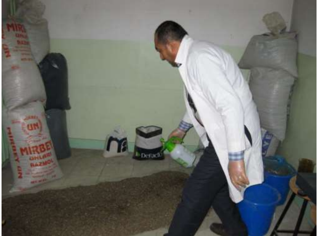
EK 2. Peletleme öncesi toz materyale üre (%2.5) ilavesi