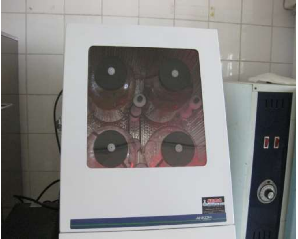
EK 10. Ancom Daisy İncubator