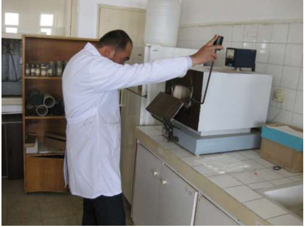
EK 7. Etüv ve etüvleme işlemi