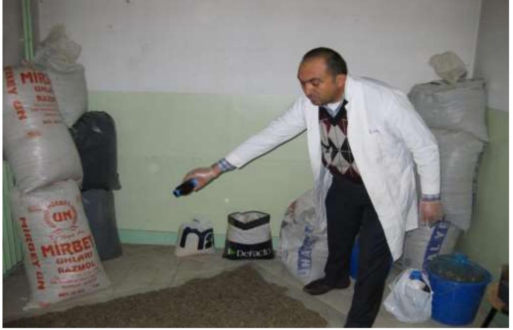
EK 1. Peletleme öncesi toz materyale melas (%7) ilavesi