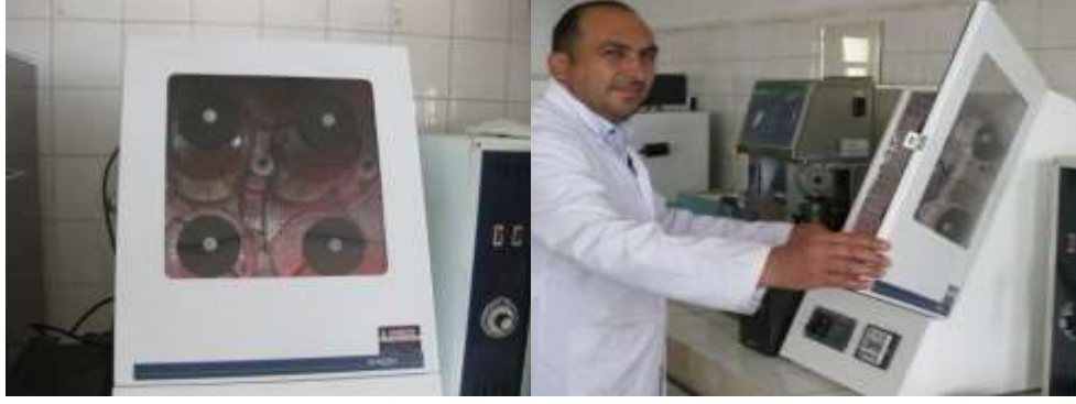
Şekil 3.3. Daisy inkübatörde in vitro sindirilebilirliğin belirlenmesi

-Buffer Solüsyonu A: 1 litrelik balon içerisinde 10 gram \text{KH}_2\text{PO}_4 , 0.5 gram \text{MgSO}_4 \cdot 7\text{H}_2\text{O} 0.5 gram NaCl, 0.1 gram \text{CaCl}_2 \cdot 2\text{H}_2\text{O} ve 0.5 gram üre saf su ile çözündürülmüştür.