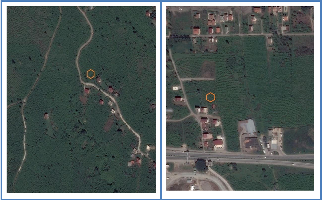
Şekil 3.1. Akçatepe (solda) ve Cumhuriyet (sağda) mahallerinin gösterimi

Tez çalışması, Ordu ili Merkez ilçesinde Cumhuriyet ve Akçatepe mahallelerinde tekstürleri farklı toprağa sahip fındık bahçelerinde yürütülmüştür. Denemede, yörede yaygın çeşitler olan Palaz çeşit fındık bitkisi kullanılmıştır.