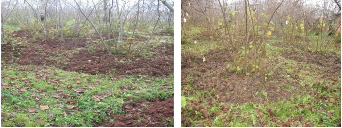
Şekil 3.3. Akçatepe (solda) ve Cumhuriyet (sağda) mahallesindeki deneme arazileri

Kompostlanmış fındık zurufu uygulamalarının fındık bitkisi yapraklarının bazı bitki besin maddesi içerikleri üzerine etkisini belirlemek üzere 30 Haziran ve 1 Ekim’de toprak örnekleme zamanında yaprak örnekleri de alınmıştır. Fındıkta yaprak örnekleme, ocaklardan bir insan boyu yükseklikteki meyveli dalların o yıl ki orta kuvvetteki sürgünlerinden, güneş gören, hastaliksız olan sürgün uçlarından itibaren 3. ve 4. yapraklar alınarak yapılmıştır. İki dönem alınan yaprak örneklerinde toplam N, P, K, Ca, Mg, Fe, Zn, Mn ve Cu içerikleri belirlenmiştir.