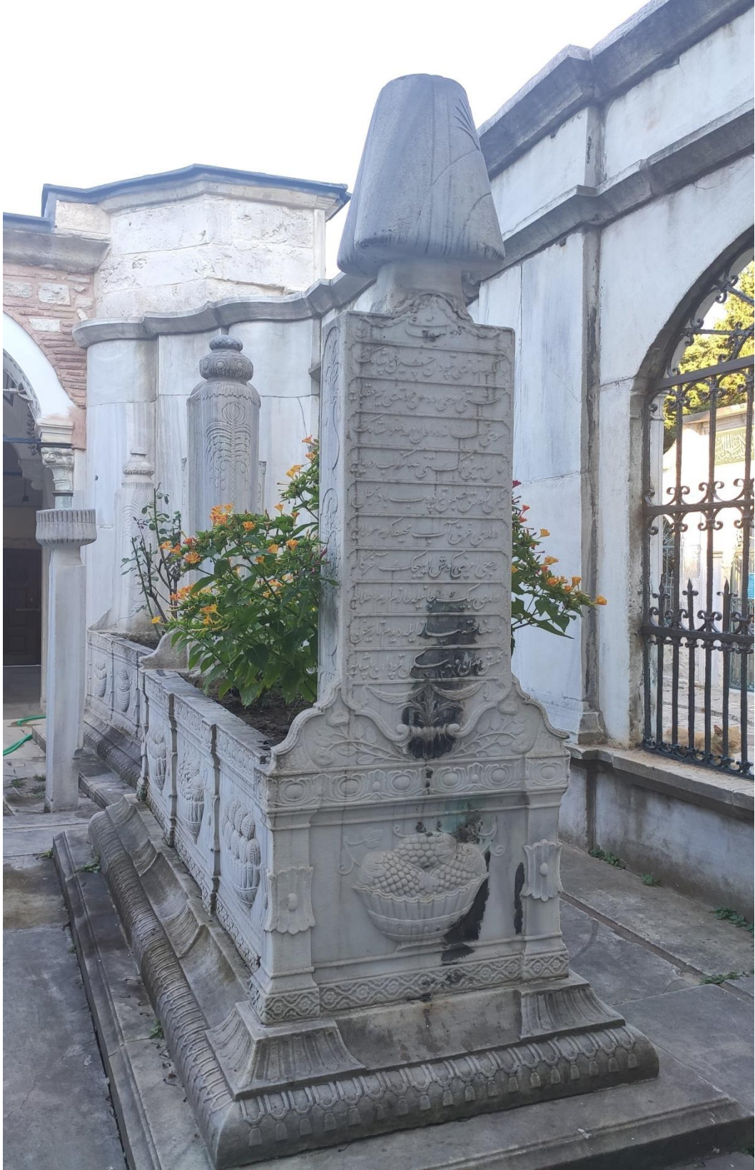
EK-10. Küçük Hüseyin Paşa'nın Eyüp Mihrişah Valide Sultan Türbesi'ndeki Kabri