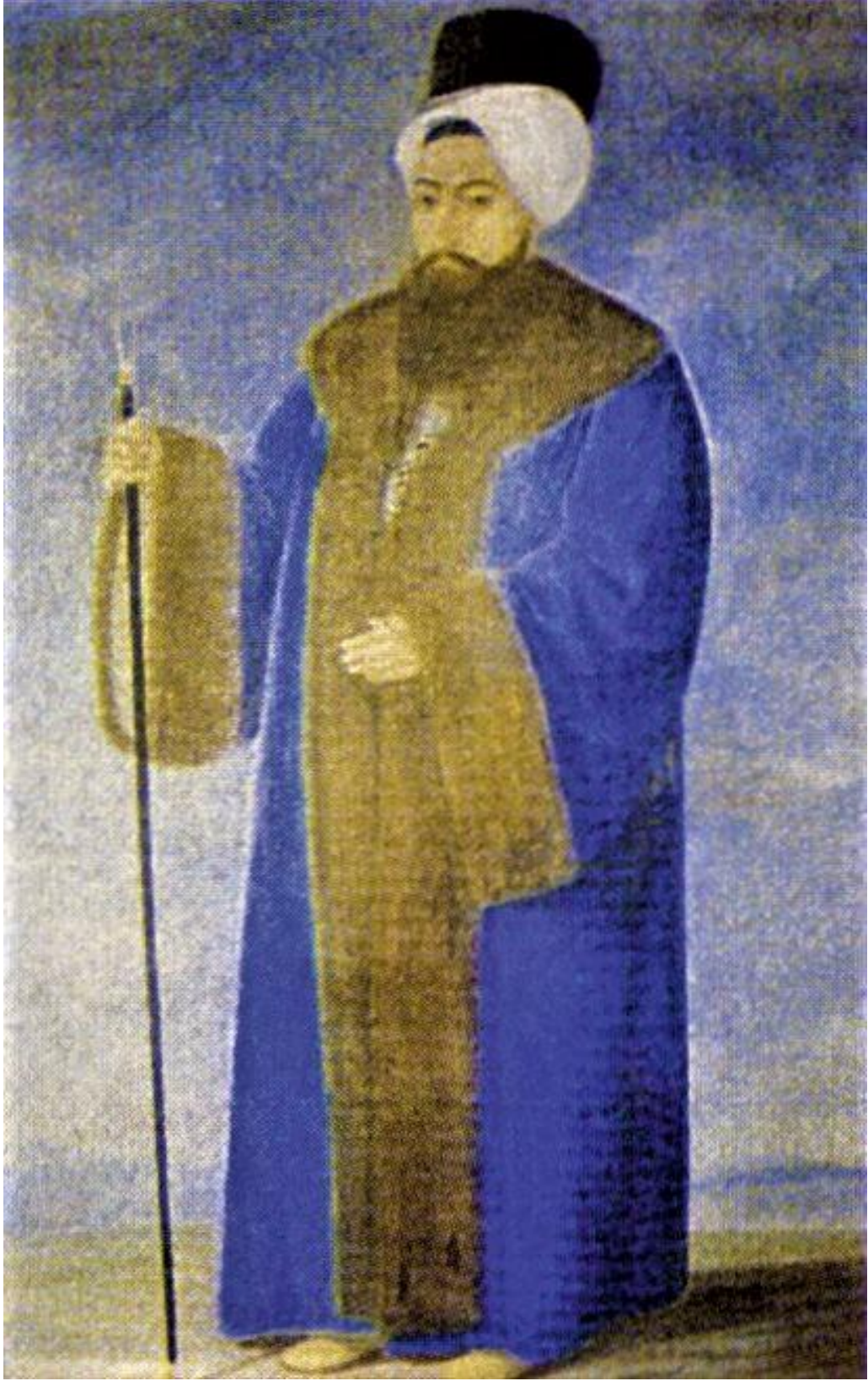
EK-7. K H Paa'yı Tasvir Eden Tablo