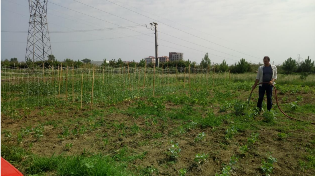
EK 2 Arazi Koşullarında Sulama Yapılırken Çekilmiş Bir Fotoğraf