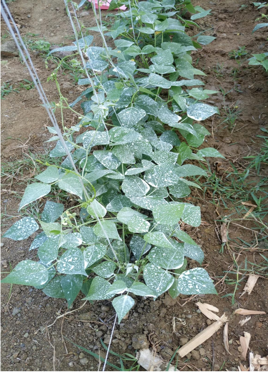
EK 3 Kaolin Kili Uygulaması Yapılmış Fasulye Bitkisinden Bir Görünüm