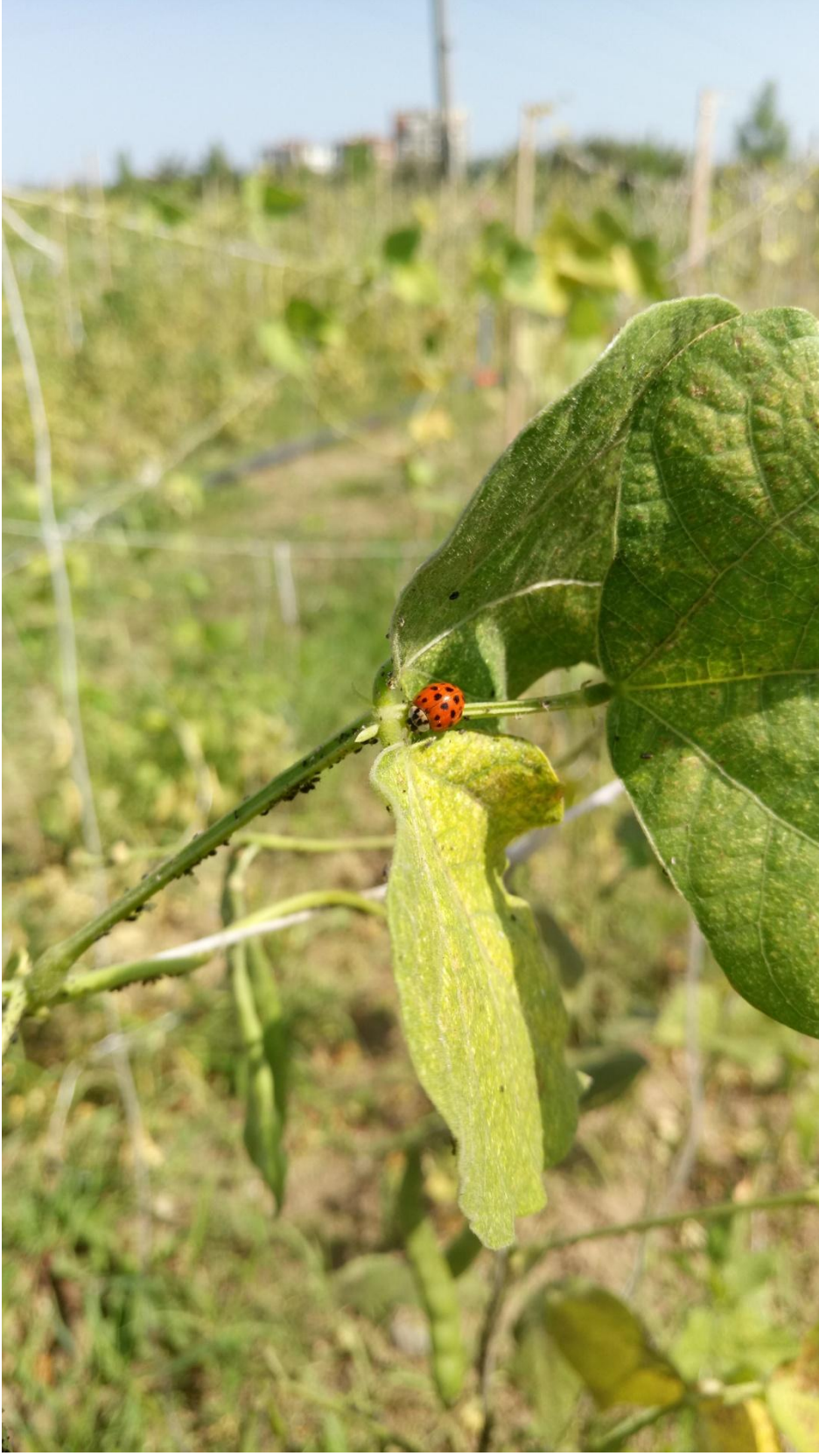
EK 4 Yaprak Bitleri İle Uğur Böceği