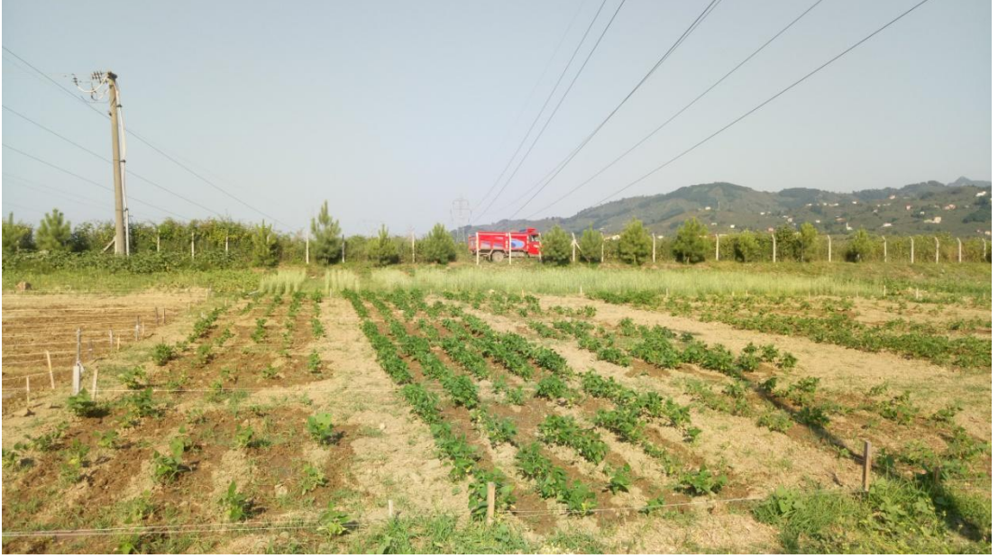
EK 1 Fasulye Tarlasının Genel Görünümü