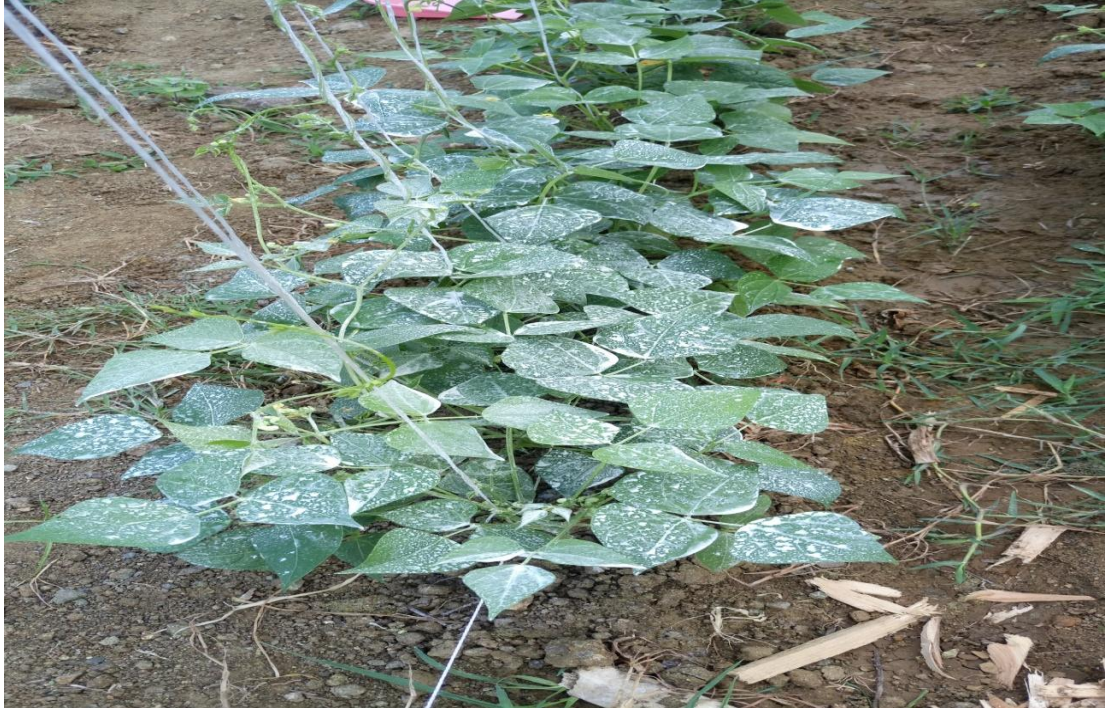
Şekil 3.1 Uygulamadan Sonra Bitkilerin Üst Aksamının Kaolin Kili ile Kaplı Hali

parsele ekimle birlikte 3.6 kg N/da, 8-10 kg P 2 O 5 /da hesabıyla gübre verilmiştir. Ekim 7 Haziran 2017 tarihinde yapılmıştır. Kaolin dozları çiçeklenme dönemi başlangıcında solüsyon olarak hazırlanıp bitkinin bütün aksamına uygulanmıştır. Hasat 18 Eylül-24 Eylül 2017 tarihleri arasında yapılmıştır.