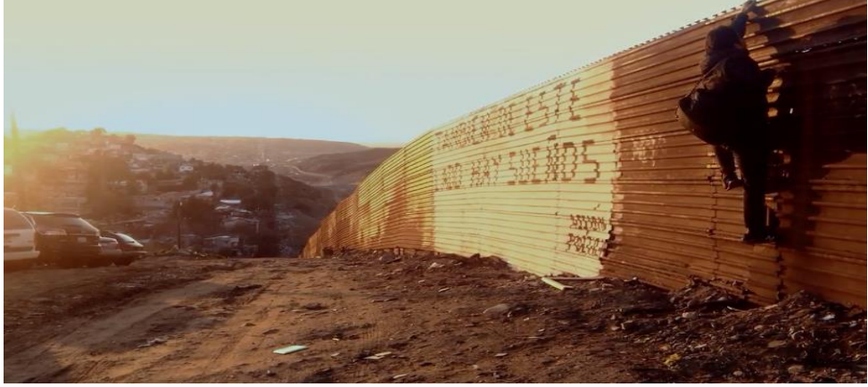
Resim 16. Hopefully, genel çekimde karakterin duvara tırmanış sahnesi.

Bu kısa filmdeki kompozisyonlara bakıldığında, kapalı kompozisyon kullanıldığı görülmektedir. Filmin kahramanı tıraş olmuş, yemeğini yemiş, duşunu almış, giyinmiş ve asıl gerçekleştirmek istediği amaca ulaşmak için duvara tırmanmıştır. Filmdeki sahneler incelendiğinde kapalı kompozisyon içerisinde gelişen olayların aynı çerçeve içerisinde başlayıp ve sonuçlanmış olduğu görülmektedir. Böylelikle, bu kısa filmdeki sanatsal ve teknik düzenlemeler öykünün atmosferine katkı sağlayarak seyircinin algılamasını kolaylaştırmıştır (Mükerrem, 2012, s. 32).