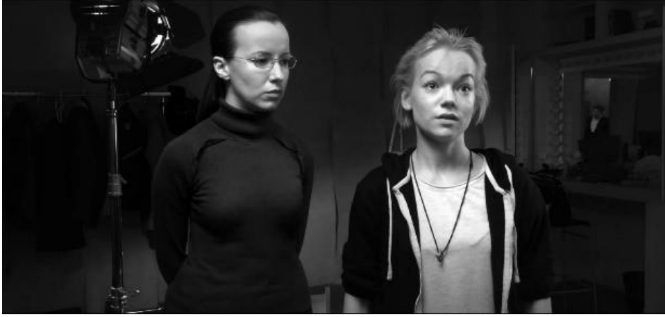
Resim 19. Confession kısa filminden bir sahne

Resim 19'da amors çekim esnasında oyuncular ayakta diyalog halindeyken çerçeveye alınmışlardır.