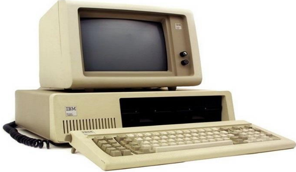
Resim 2. IBM PC 5150 ( computerhistory.org/timeline/1981 , 20.01.2018)