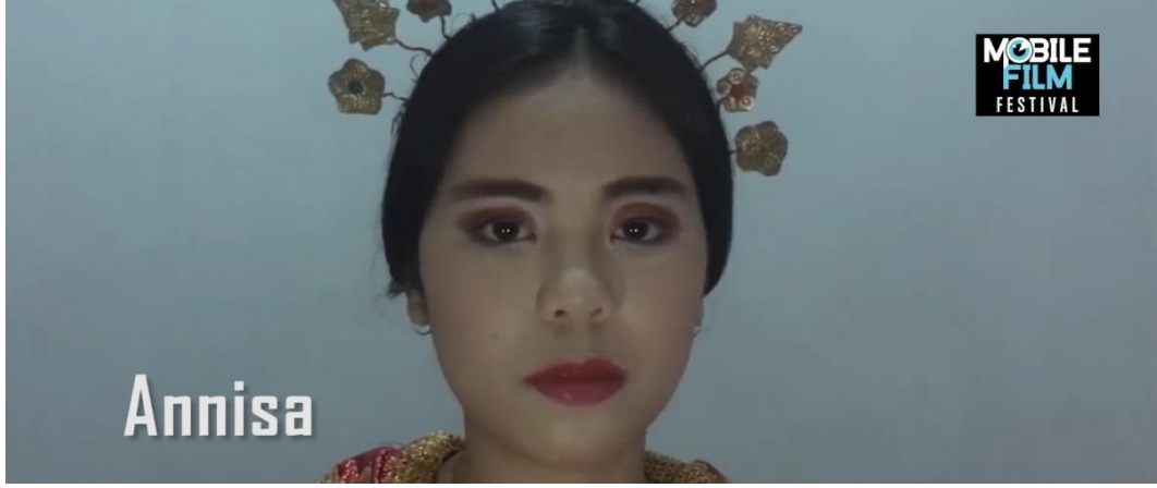
Resim 5. Annisa Film Afişı