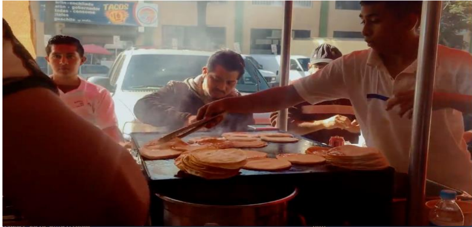
Resim 15. Hopefully, fast food dükkânı orta çekim.

Filmin ilk planında karakter berber koltuğunda tıraş olmaktadır. İç mekânda profesyonel olarak yapay ışık kaynaklarıyla aydınlatma yerine doğal ışık kaynaklarının etkisiyle ortamda var olan ışık kaynaklarından yararlanılmıştır. Çekim mekânı olarak tercih edilen dükkânda oyuncu ve berberi aydınlatan ışık pencerelerden içeri giren ortam ışığı, gökyüzünden ve çevreden yansıyan doğal ışık kaynağıdır (Brown, 2010, s. 47). Buna bağlı olarak oyuncunun yüzünde ensesinde ve vücudunun diğer kısımlarında gölgelerin oluşmasına neden olmuştur.