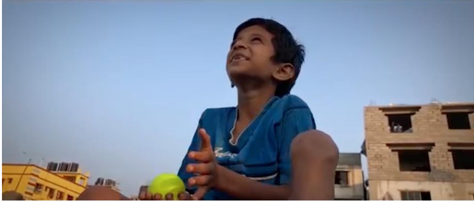
Resim 12. Unsung Hero, çocuğun bel çekimde topuna kavuştuğu sahne

Orta çekimde çocuğun bulunduğu mekân öznel bakış açısıyla çerçevenin sağından Süperman'ın tıpkı filmlerinde olduğu gibi ekranı doldurarak uçmakta ve suya doğru yöneldiği görülmektedir. Genel çekimde Süperman oyuncağının suyun üzerinde doğru süzülerek tenis topunu almak için hamle yaptığını (sopanın ucundaki Süperman kanatlanmış tenis topunu bulunduğu yerden kurtarmak görevini üstlenmiştir) devamındaki planda yakın çekimle Süperman'ın topu kollarının arasına alıp kurtardığı gösterilmiştir. Filmde beklenen sahne bel çekim ölçeğinde, çocuk oturmuş sopanın ucundaki Süperman'ın sudan çıkardığı topuna kavuşmuştur. Topunu eline aldıktan sonra yakın çekimle Süperman oyuncağını suya bıraktığı planda slow motion (yavaş hareket) tekniğini kullanarak dramatik etkinin artmasını amaçlanmıştır.