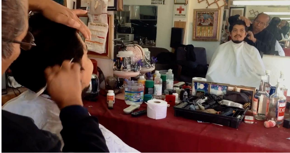
Resim 14. Hopefully, karakterin amorsu çekimde tıraş olduğu sahne

Çekim ölçekleri açısından Hopefully orijinal adı Ojalá olan kısa filmde omuz çekim ölçeğinde berberde traş olan karaktere kamera yukarıdan aşağıya hareketiyle yakın çekimde yüzünü gösterir. Omuz çekimde berber, karakterin ensesindeki ustura ile fazlalıklarını almaktadır. Film oyuncusunun bıyıklarına makasla şekil verilmesi omuz çekimle çerçeveselmiştir. Berber koltuğunda oturan oyuncu ve berberin amorsundan aynadaki yansımalarını göstermek için omuz çekimle kompozisyon oluşturulmuştur.