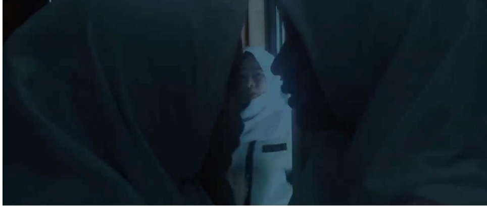
Resim 6. Annisa filmindeki yüz yakın çekimi

Yüz çekimde, açı değişmiş ekranı dolduran iki kız öpüşmek için hamle yapacakken odanın açık kapısından içeriye birdenbire giren diğer arkadaşları ikiliyi görmüş ve bir şeyler (-estağfurullah) söyleyerek şaşırılmış halde eliyle ağzını kapatarak vücudunu kapıya doğru bırakmıştır. Bu sahnede gördükleri karşısında şaşkına dönmüş oyuncunun ifadesi gösterilmek istenmiştir.