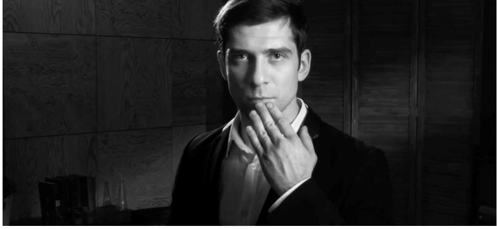
Resim 20. Göğüs çekimde karakterin son sahneyi canlandırması

Dolayısıyla oyuncunun bu çekim ölçeğinde yani göğüs planda jest ve mimikleri, duyguları oyunculara ya da olaylara karşı gösterdiği tepki izleyiciye net bir şekilde yansıtılmıştır (Ankaralıgil, 2015, s. 144).