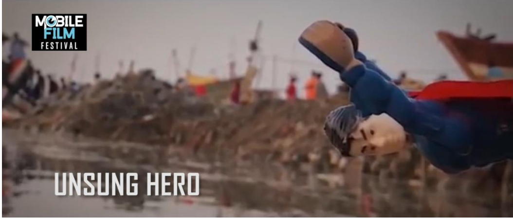
Resim 9. Unsung Hero Film Afışı