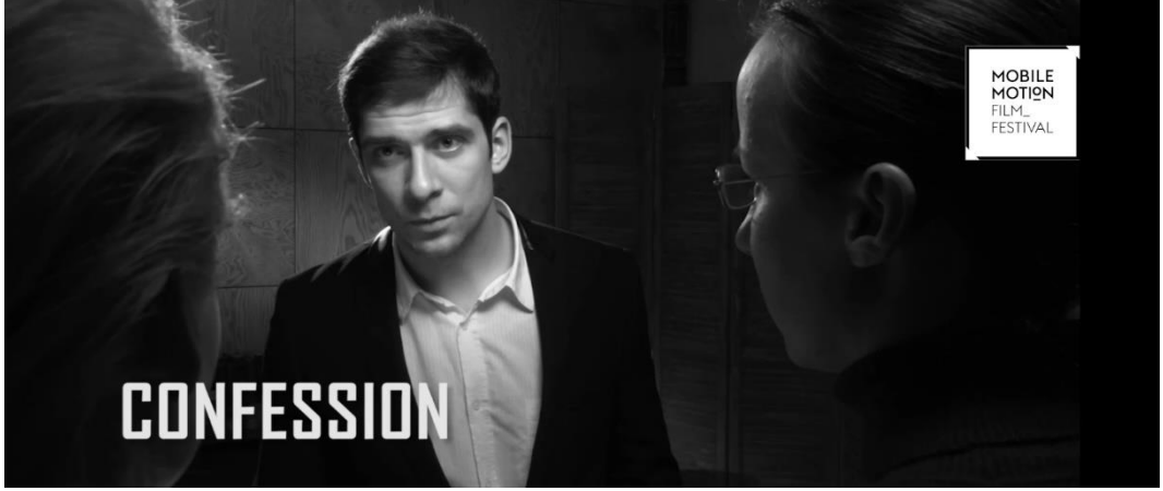
Resim 17. Confession Film Afiş