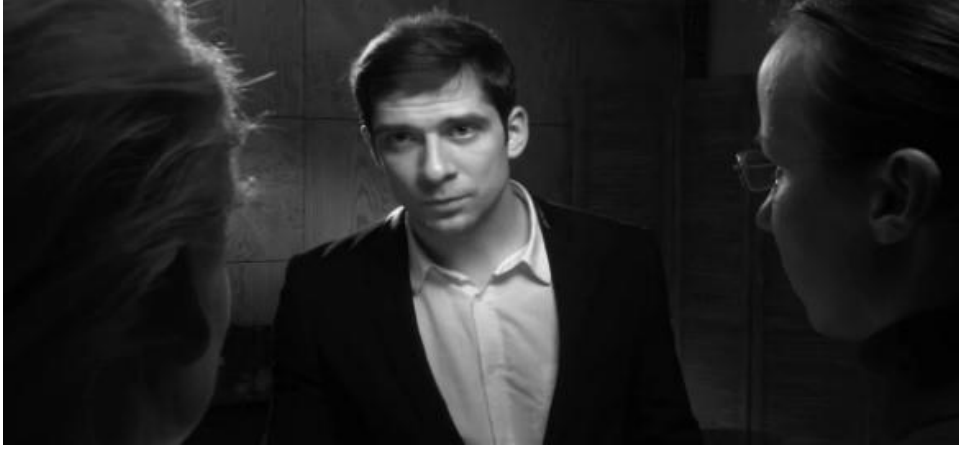
Resim 18. Confession kısa filminden bir sahne

Filmde kullanılan ikili ya da bel çekim olarak isimlendirilen çekim ölçeğinde iki kadın çerçeve içerisinde konumlandırılmıştır. Önceki genel çekim ölçeğine bağlı olarak oyuncuların sahneye dizilişi üçgen şeklindedir. Bu bağlamda iki aksiyon çizgisi güçlü olan erkek oyuncuda birleşmiş ve sahnede etkinliği artmıştır. İzleyici, bu biçimde uygulanan sahnelerin çekiminde ilgi merkezinin sürekli olarak iki oyuncu arasında değişmesini gözlemler. Dolayısıyla üçüncü oyuncu pasif durumda kalmıştır (Arijon, 1995, s. 94-95). Bu kısa filmdeki dikkatin odak noktası üçgen şeklinde yerleştirilmiş oyuncuların etrafında gelişmektedir. Buna bağlı olarak da oyuncular sırayla odak noktası haline gelmektedirler.