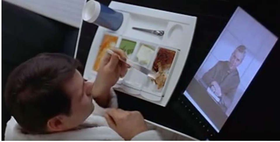
Resim 3. 2001: A Space to Odyssey (Kubrick, 1968)

21. yüzyılda teknolojinin gelişmesiyle birlikte ABD’de Bill Gates Windows işletim sisteminin elektronik bir ekran üzerinden özel bir kalemle çalışan sürümünü geliştirmiştir. 2005 yılında Nokia firması Nokia 770 model tableti ve Maemo adlı markaya özel işletim sistemine sahip ürününü piyasa sürmüştür (Fitzek & Reichert, 2007, s. 187). Bu modelde olduğu gibi bugün internete kablosuz bir şekilde bağlanılabilmektedir. Elektronik posta kutusu kontrol edilip fotoğraf, film, metin, ses ve çizimlere erişim imkânı sağlanabilmekte hatta depolanabilmektedir. Günümüzde yaygın olarak kullanılmakta olan tabletler farklı şekil ve teknik donanımlarıyla kullanılmaktadır.