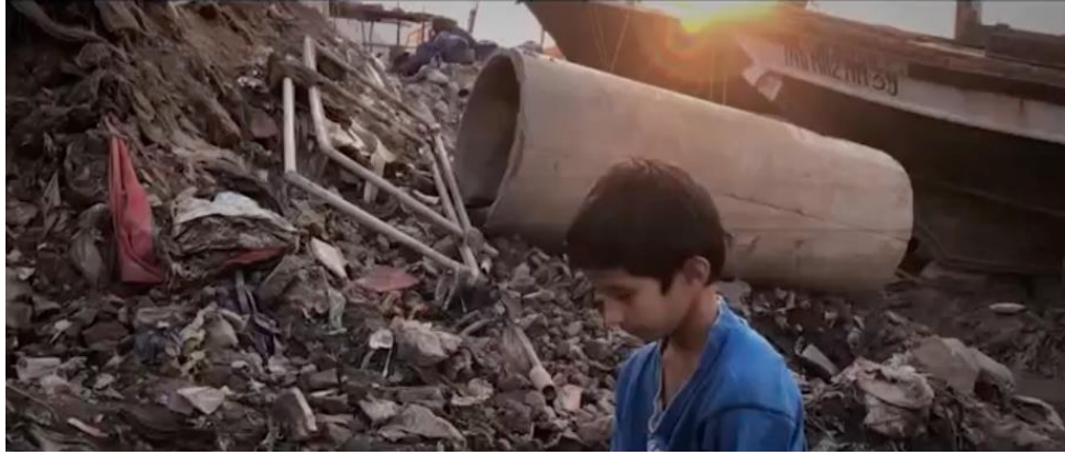
Resim 10. Unsung Hero, çocuğun nehir kıyısından ayrıldığı sahne

Yakın çekimle çocuğun amorsundan topu almaktan vazgeçtiği oradan uzaklaşmak için harekete geçtiği çerçevedir. Çocuk çerçeveden çıktığında suyun üzerinde sarı renkli top orta çekimle çerçevenin merkezinde bulunmaktadır. Omuz çekimle çocuğun su kıyısından topunu almaktan vazgeçtiği umutsuzca oradan ayrılmaya karar verdiği çekim ölçeğidir. Göğüs çekimle çocuğun topundan ayrılmasının üzüntüsüyle başını öne eğmiş halde yürürken çerçevelendiği sahnedir. Bu sahnede çocuğun anlık refleksi başını sağa çevirip yere bakmasına neden olmuştur.