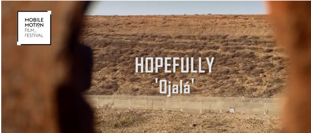
Resim 13. Hopefully (Ojalá) Film Afişı