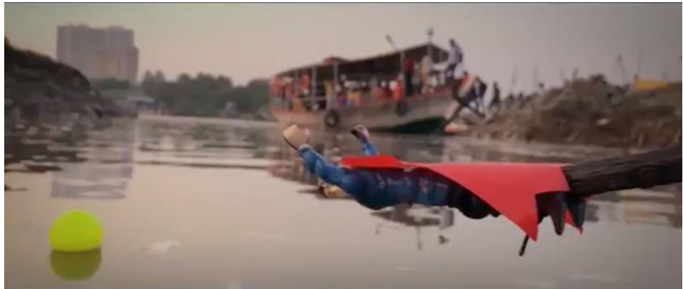
Resim 11. Unsung Hero, Süperman'in genel çekimden uçuşu

Yakın çekimde çocuğun elleriyle çöplerin arasına uzanmasını devamındaki planda sağ eliyle mavi ve kırmızı renkli Hollywood filmlerinden aşına olduğumuz film karakteri Süperman'ın oyuncasını eline alarak bir eliyle de tozlarını silerken gösterilmiştir. Yüz yakın çekimde çocuğun Süperman'e dikkatle baktığı görülmektedir.