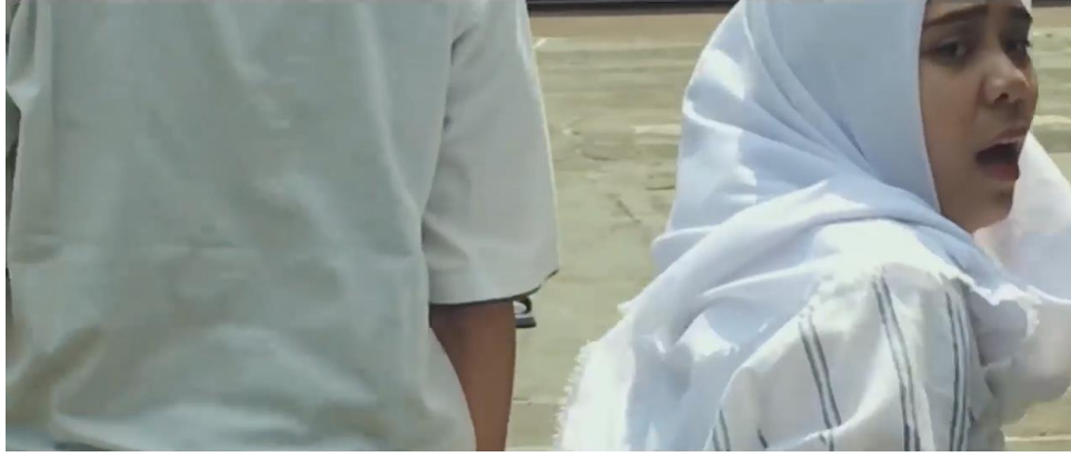
Resim 8. Annisa filminden bir sahne

kolundan tutularak götürülmeye çalışılmaktadır. Devamında filmin kadın kahramanını sürükleyerek götürmekte olan adamın, kadını yere bıraktığı karşı açıdır.