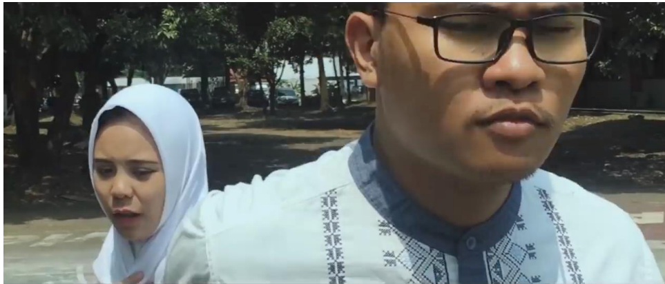
Resim 7. Annisa filminden bir sahne

Amorstan karşı açıdan çekimde iki kız birbirlerine bakarken çerçevelenmiştir. Devamında aks atlatma tekniği kullanımının olduğu karşı açıdan ikinci kez amors çekime başvurulmuştur. Bu planın devamında karşı açı (göz seviyesi) aksın kırıldığı yüz çekimde iki kızın birbirlerine doğru yaklaşırken kapıdan üçüncü bir kızın onları gördükleri çerçevedir.