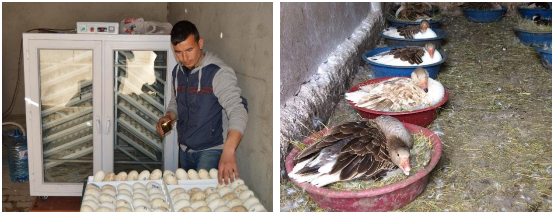
Şekil 4.1 Kuluçka Makinesi Kullanımı ve Doğal Kuluçka

Yetiştiricilerin %52.98'i işletme büyüklüğüne göre değişmekle birlikte ortalama 4-6 adet damızlık kaz elde tutmaktadırlar. Yetiştiricilerin %98.68'i işletmedeki palazları doğal kuluçka yöntemiyle elde ederken %1.32'si kuluçka makinesi kullanmaktadır (Şekil 4.1).