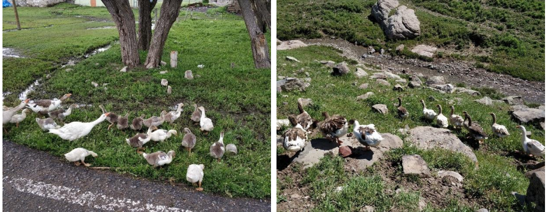
Şekil 4.2 Kazların Mera, Otlak, Köy Alanı Ve Su Kenarlarında Otlatılması

Yörede kazlar kapalı alanda barındırılmakta ve kazların tamamı gündüzleri merada otlatılmaktadır. Bu otlatma kazların çobansız olarak mera, otlak, köy alanı ve su kenarlarında otlatılması şeklinde yapılmaktadır (Şekil 4.2).