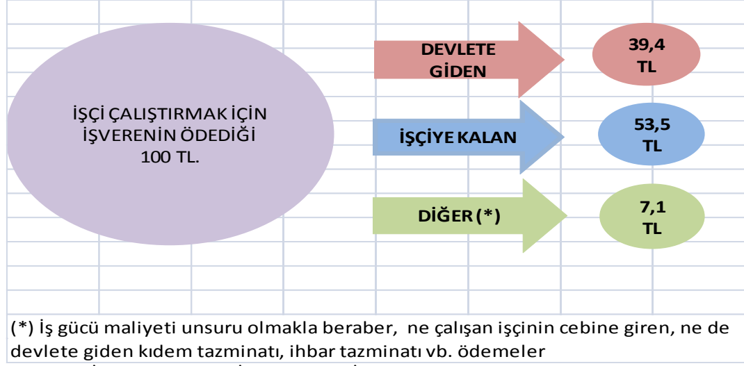
Şekil 1: 2015 Yılında İşçi Geliri Açısından Devletin Aldığı Vergi Oranı (100 TL Üzerinden)