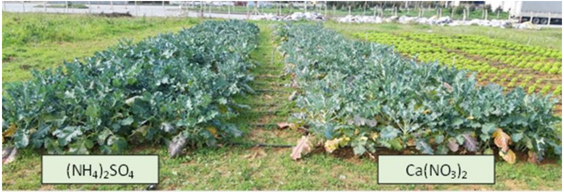
Şekil 4.1 Amonyum sülfat ve Kalsiyum Nitrat Gübre Uygulamalarının Brokkolide Vejetatif Gelişim Üzerine Etkileri

Brokkoli kükürttü seven bitki olması, kükürt elementinin bitkisinin vejetatif aksamının daha iyi gelişmesinde ve yaprakların daha yeşil görünmesine etkili olmasından dolayı uygulanan amonyum sülfat gübresinden kükürt elementini daha fazla almasından kaynaklı olduğu değerlerin daha iyi sonuç vermesine neden olmuş olabilir.