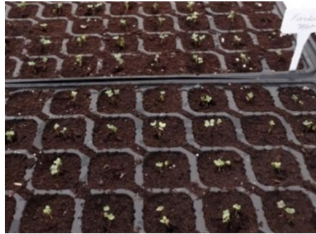
Şekil 3.3 Fidelerin İlk Çıkışı

Ekim işleminden sonra viyoller Ordu Üniversitesi Ziraat Fakültesi Bahçe Bitkileri Bölümüne ait ısıtmasız sera koşullarına yerleştirilmiştir. Çıkışlar başladıktan (Şekil 3.3) sonra her viyol hücresinde tek bitki kalacak şekilde seyreltme yapılmış ve fideler dikime hazır hale gelinceye kadar tüm bakım işlemleri muntazam şekilde yapılmıştır. Fide döneminde herhangi bir hastalık ya da zararlı ile karşılaşmamıştır.