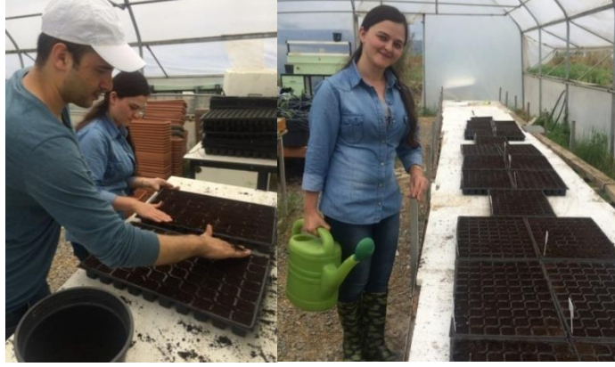
Şekil 3.2 Tohumların Ekimi ve Can Suyu Verme İşlemi

Ekim işleminden sonra viyoller Ordu Üniversitesi Ziraat Fakültesi Bahçe Bitkileri Bölümüne ait ısıtmasız sera koşullarına yerleştirilmiştir. Çıkışlar başladıktan (Şekil 3.3) sonra her viyol hücresinde tek bitki kalacak şekilde seyreltme yapılmış ve fideler dikime hazır hale gelinceye kadar tüm bakım işlemleri muntazam şekilde yapılmıştır. Fide döneminde herhangi bir hastalık ya da zararlı ile karşılaşmamıştır.