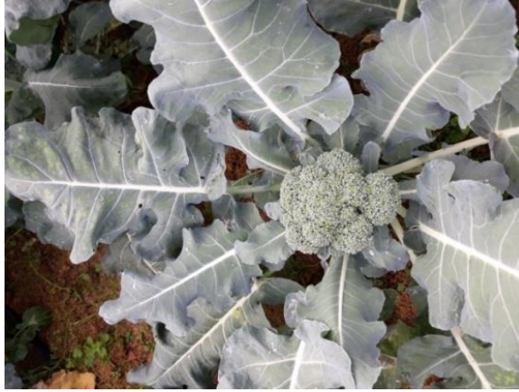
Şekil 3.6 Hasat Olgunluğuna Ulaşmış Ana Taç Görüntüsü

Brokkolide hasat zamanı taçların pazarlanabilir iriliğe gelmesi ve piliçlerin patlayıp çiçek açmadığı, sıkı olduğu 31.10.2018-10.12.2018 tarihleri aralığında yapılmıştır (Şekil 3.6). Hasat olgunluğuna gelen ana taçlar gövde üzerinden bıçak yardımıyla kesilerek Bahçe Bitkileri Bölümü pomoloji laboratuvarına getirilmiştir. Hasat edilen taçlarda; taç ağırlığı, taç yüksekliği ve dikimden itibaren hasada kadar geçen gün sayısı belirlenmiştir. Ayrıca vejetasyon süresi içerisinde yan dallardan oluşan taçlarda da hasat işlemi devam etmiştir.