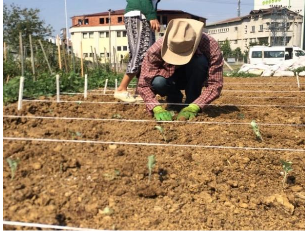
Şekil 3.5 Fidelerin Araziye Şaşırtma İşleminin Yapılması