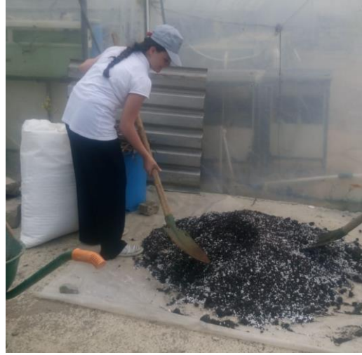
Şekil 3.1 Tohum Ekimi İçin Ortam Hazırlama

Yapılan bu çalışmada tohumların ekimi için 2:1 oranında torf ve perlit karışımı içeren ortam hazırlanmıştır. Hazırlanan torf perlit karışımı 70 hücreli (7x10) viyollere doldurulmuştur (Şekil 3.1).