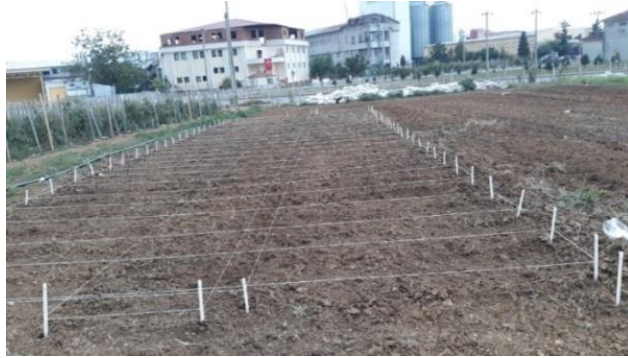
Şekil 3.4 Dikim Öncesi Arazi Parselleme İşlemi

ticari gübreleri kullanılmıştır. Deneme konusu olan azot kaynakları olarak ise amonyum sülfat ve kalsiyum nitrat gübreleri kullanılmıştır. Gübreleme işlemi el ile bitki sıralarına uygulanmış olup toprağa karışması için çapa işlemi yapılmıştır. Bitkilerin sulanması damla sulama sistemi ile yapılmıştır. Bitkiler üst gübre uygulaması sırasında çapalanmış ve yetiştirme sezonu boyunca yabancı ot kontrolü sağlanmıştır. Parsellerde kayda değer bir hastalık etmenine rastlanılmazken yeşil kurt zararlısına karşı ise bir kez insektisit uygulaması yapılmıştır.