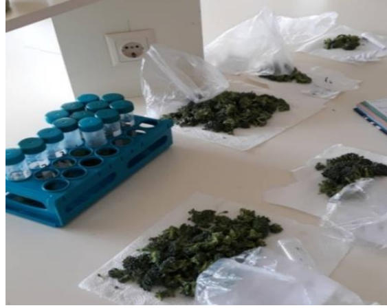
Şekil 3.8 Brokkolilerin Parçalanması ve Püre Haline Getirilmesi