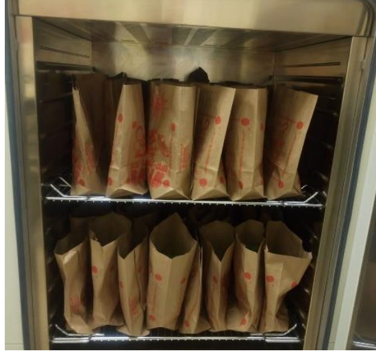
Şekil 3.7 Yaprakların Etüvde Kurutulması İşlemi