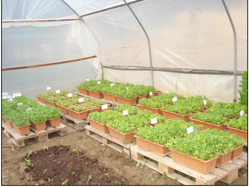
Şekil 3.2. Deneme alanında gelişme dönemindeki bitkiler