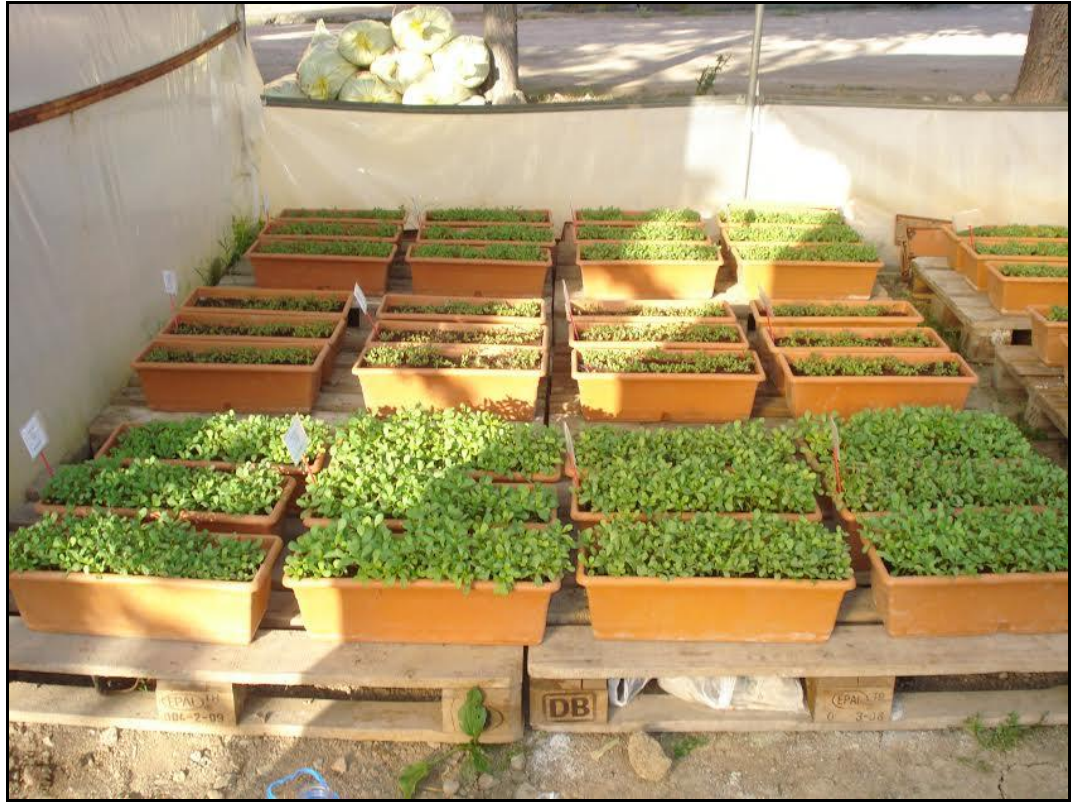
EK 3. Gelişmekte olan semizotu bitkileri-III