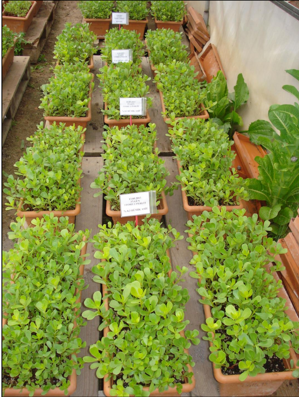
Şekil 3.1. Deneme alanının görüntüsü

yapılmıştır. Tohum ekimi sonrası 1.0 cm kalınlığında kapak materyali (torf) atılmış ve her saksıya alttan su çıkışı olacak şekilde yeteri kadar can suyu verilmiştir. Tohum ekiminden hasada kadar ot temizliği, sulama, ilaçlama ve gübreleme gibi tüm kültürel işlemler eksiksiz olarak yerine getirilmiştir (Vural ve ark., 2000).