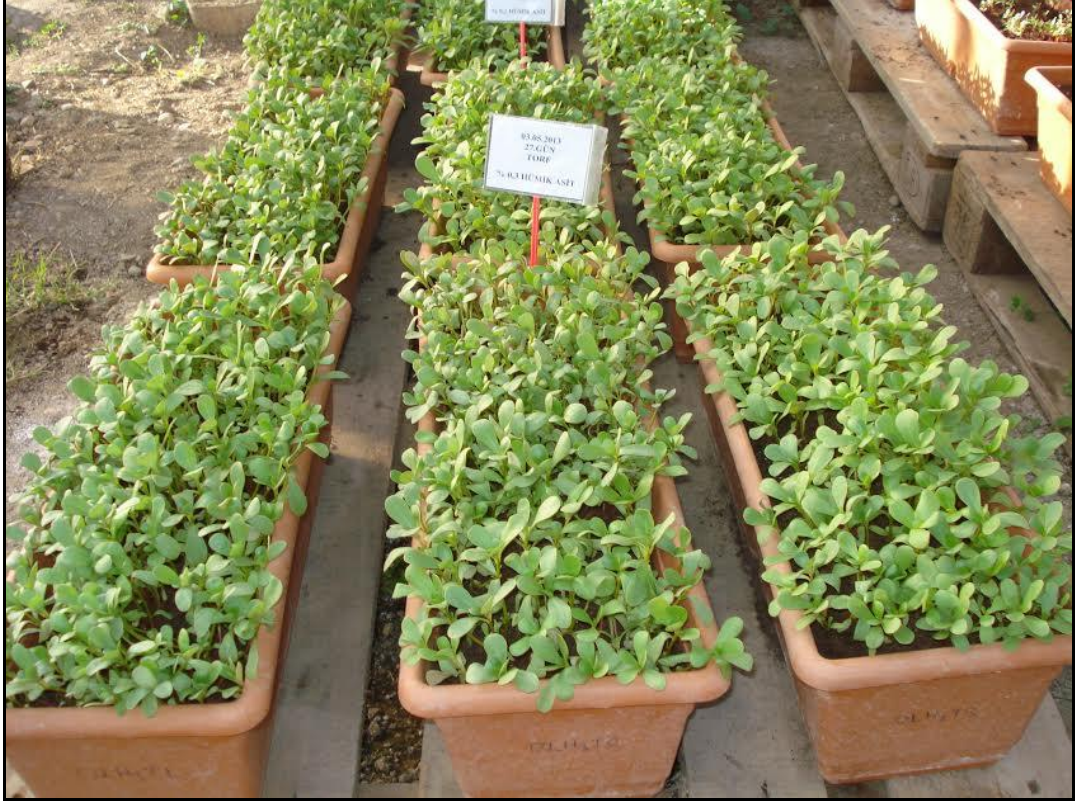
EK 2. Gelişmekte olan semizotu bitkileri-II