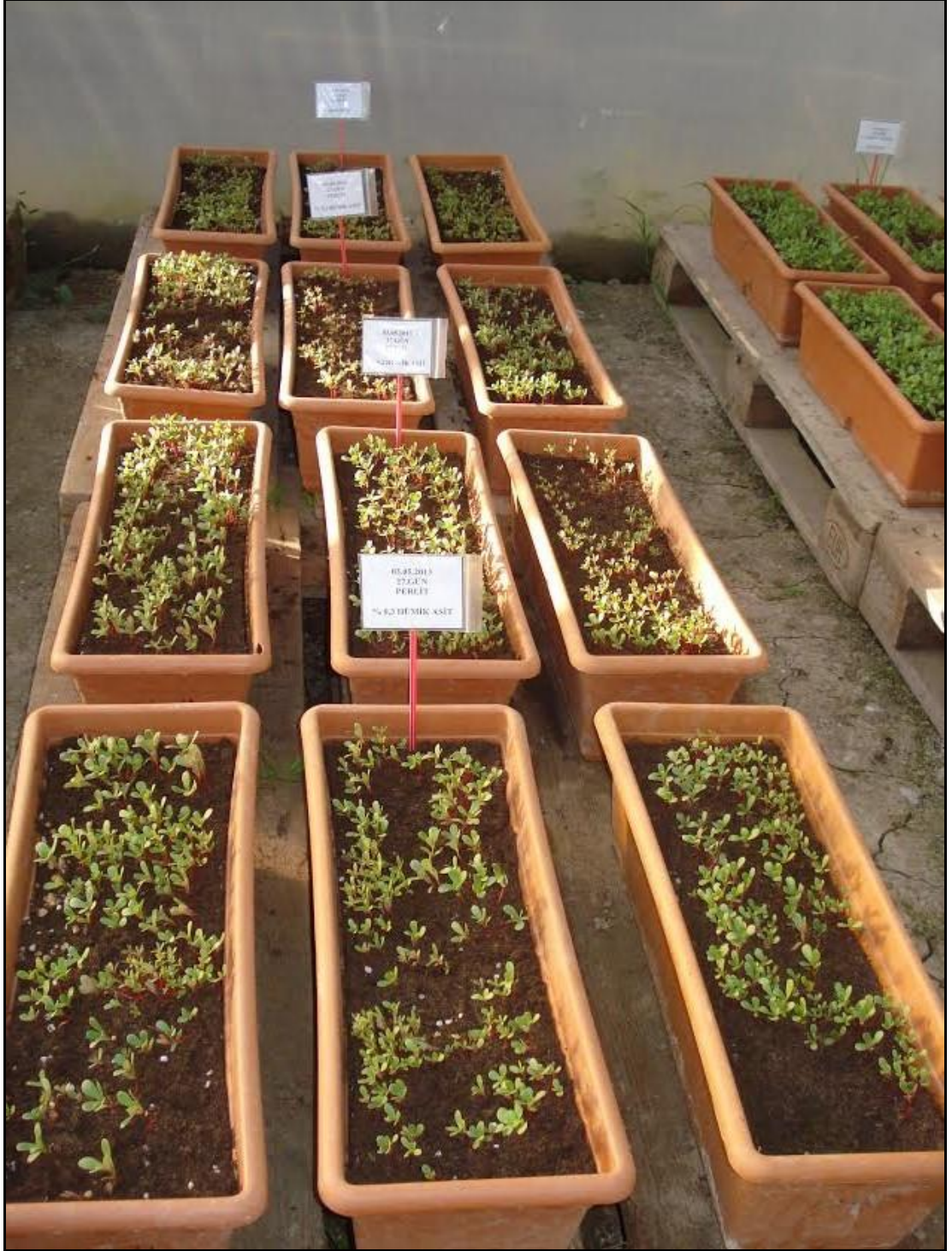
EK 1. Gelişmekte olan semizotu bitkileri-I